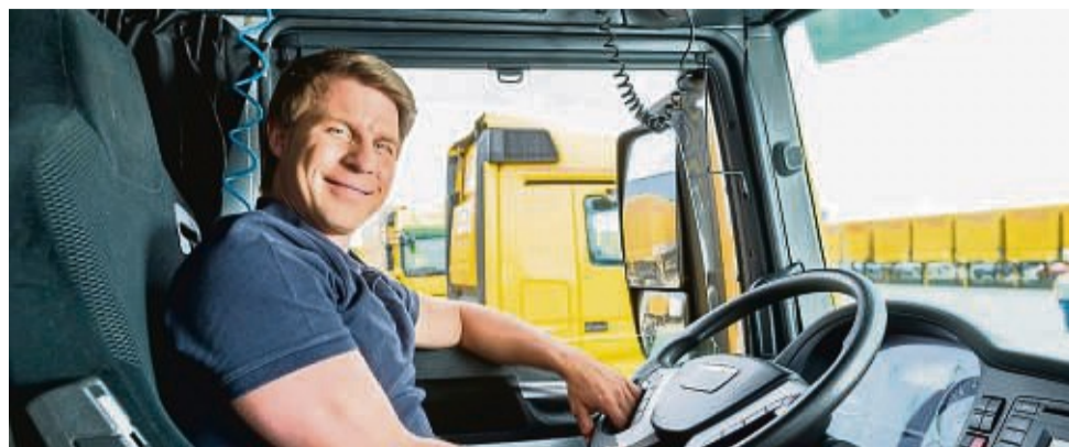
Kraftfahrer bringen Waren von einem Ort zum anderen und tragen damit maßgeblich zu den alltäglichen Bedürfnissen eines jeden Einzelnen bei.

Ihr Wohnzimmer ist die Autobahn, die Raststätten-mitarbeiter kennen sie namentlich: Kraftfahrer. Ohne ihren unermüdlischen Einsatz auf den Straßen kämen Waren nicht von einem Ort zum anderen, würden Bestellungen liegenbleiben und vieles im Alltag nicht so funktionieren, wie man es gewohnt ist.