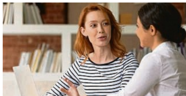
Mit dem Aktivierungs- und Vermittlungsgutschein kann man sich auf eigene Faust einen zugelassenen Maßnahmeträger suchen, der beim Neustart tatkräftig hilft.

Irgendwann aber geht der Blick auch wieder nach vorne. Nun ist es wichtig, die Weichen für den beruflichen Neustart richtigzustellen