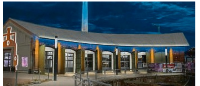
So könnte es aussehen: Ein Entwurf zeigt den Lokschnuppen mit blauer Beleuchtung – die Farbe soll je nach Veranstaltung verstellbar sein. Links ist der Eingang mit der ausgeleuchteten stählernen Silhouette einer Lok zu sehen.

soll verstellbar sein. Bis zum 24. April werden über eine Internet-Plattform Spenden gesammelt (siehe Hintergrund). Das Ziel: 15 000 Euro. Damit wäre mindestens die Hälfte der