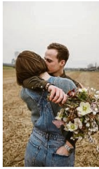
Auch wenn ein Strauß mit regionalen Blumen im Winter eine Herausforderung ist, es gibt ihn. Etwa mit Christrosen und Weidenkätzchen.