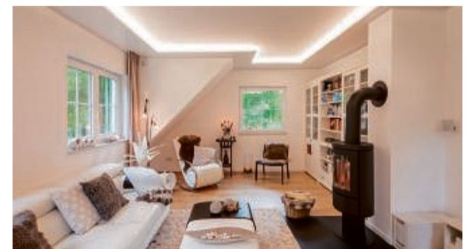
Mit Licht dein Wohnzimmer verzaubern.

Plameco bietet dir dazu flexible Zimmerdecken in vielen verschiedenen Farben und Dessins. Ob matt, hochglänzend, mit Zierprofilen, oder LED-Beleuchtung: Die Decken sind so vielseitig, dass du sie harmonisch jedem Wohnstil anpassen kannst. Wohn-, Schlaf- und Esszimmer sowie Küche, Flur und Bad erhalten damit schnell ein neues Gesicht. Montiert werden sie einfach unterhalb der vorhandenen Decke. Kein ausräumen nötig, lediglich die Möbel werden abgedeckt. Das machen