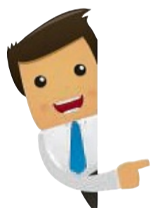
Hubi von azubi.komm hat viele Stellen parat.

Wie geht es nach dem Abschluss weiter? Diese Frage wird sich im Laufe der Schulzeit jeder irgendwann einmal stellen müssen. Studium oder Ausbildung, oder doch FSJ oder Au-Pair? Das Angebot wird immer größer und die Möglichkeiten sind fast unzählig – was die Beantwortung der Frage nicht wirklich erleichtert und viele vor eine echte Herausforderung stellt.