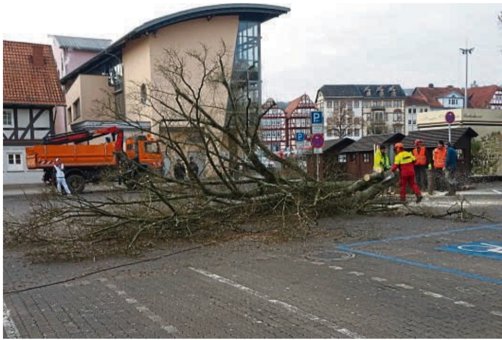
Mein Freund der Baum ist tot: Die Lolls-Linden auf dem Marktplatz nahe der Feuergrube wurden in einer Nacht- und Nebelaktion angesägt und mussten gefällt werden.

Das gesamte Team der Jugendhilfestation I bedankte sich stellvertretend durch die kommissarische Leitung Iris Rosenfeld. red/ass