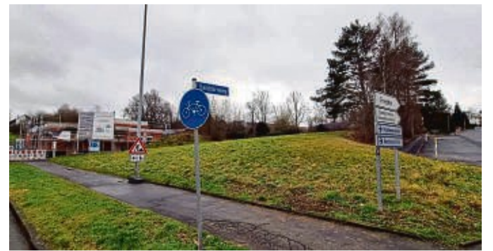
Das Baustellenschild kann stehen bleiben: Auf dem Eckgrundstück am Sanddornweg auf dem Johannesberg soll neben der neuen Feuerwache (hinten links) ein Komplex mit 57 altersgerechten Wohnungen entstehen.

Auf die öffentliche Ausschreibung hatten sich zwei Bieter beworben. Nach einer internen Abwägung der Angebote soll der Meistbietende für 450 000 Euro den Zuschlag erhalten. Geplant ist ein L-förmiger, drei-geschossiger Bau mit 57 Wohnungen, wovon einige in Absprache mit der Stadt als Sozialwohnungen gelten sollen. Als Betreibergesellschaft steht die Johanniter-Unfall-Hilfe hinter dem Projekt, die zudem garantiert, dass im Haus mindestens 20 Stunden pro