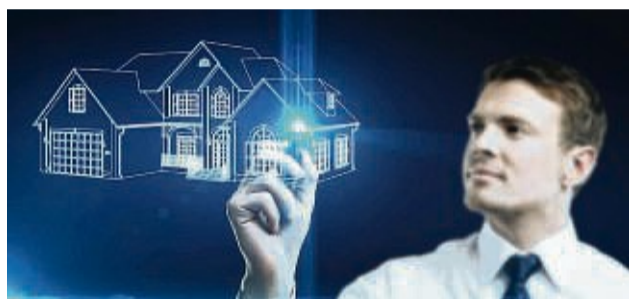
Kaufmänner und Bauzeichner sind immer gefragt.

Es ist eine gute Zeit, sich jetzt für die Gestaltung der eigenen Zukunft zu entscheiden.