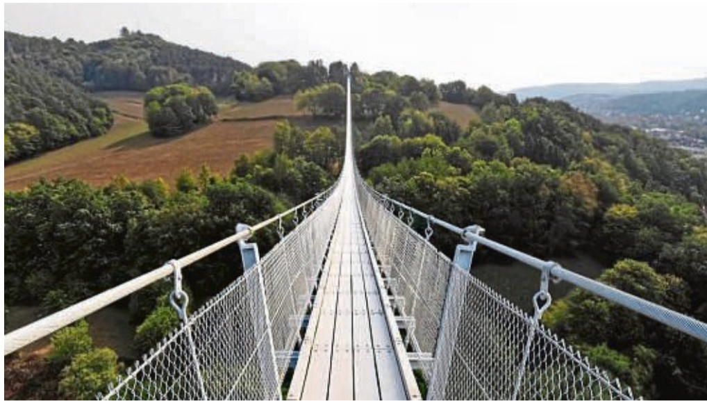
So könnte sie aussehen: Die geplante Fußgänger-Hängebrücke in Rotenburg über das Kottenbachtal, hier dargestellt auf einer Fotomontage mit Blick zum Rotenburger Hausberg.