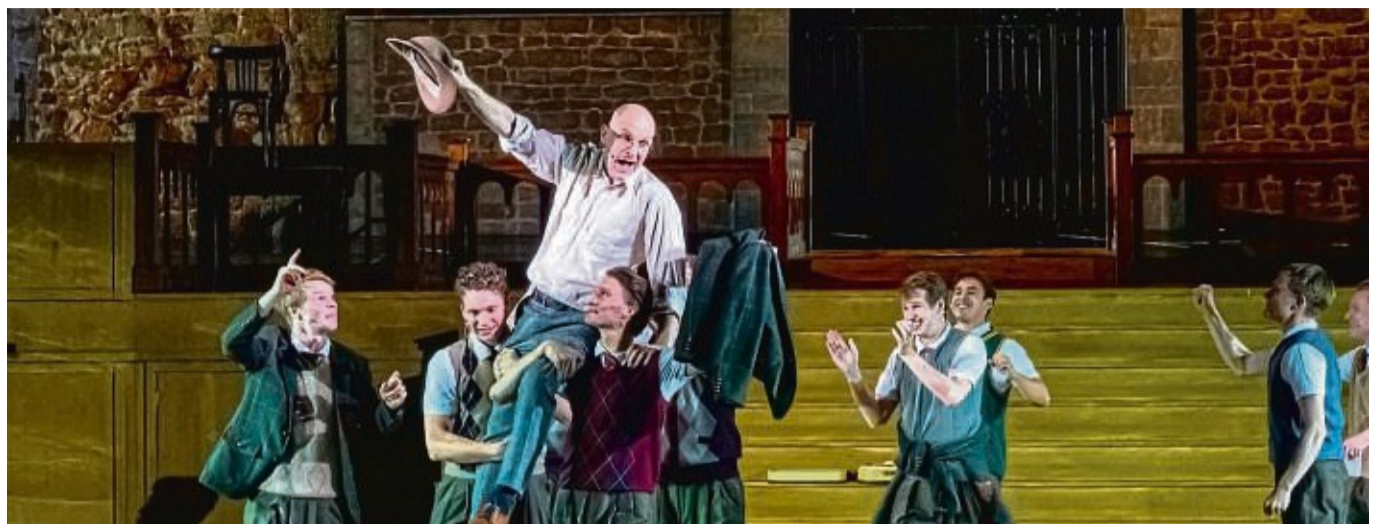
Grund zum Jubeln: Der Vorverkauf und die Castings für die Bad Hersfelder Festspiele laufen gut. Neben dem „Club der toten Dichter“ (unser Foto) steht auch „Notre Dame“ auf dem Spielplan.

Aktuell finden unter anderem die Vorsprechen für alle Inszenierungen statt – teils live, teils aber auch via Inter-