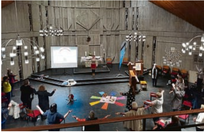
Studientag: Jüngst haben sich 50 Frauen in der Martinskirche mit der Vorbereitung des Weltgebetstags beschäftigt.