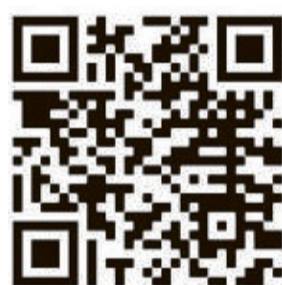
Dieser QR-Code führt auf die Facebook-Seite von azubi.komm.

„Eine Ausbildung ist doch heute nichts mehr wert,“ sagen manche. Aber, stimmt das? Nein, denn eine Ausbil-