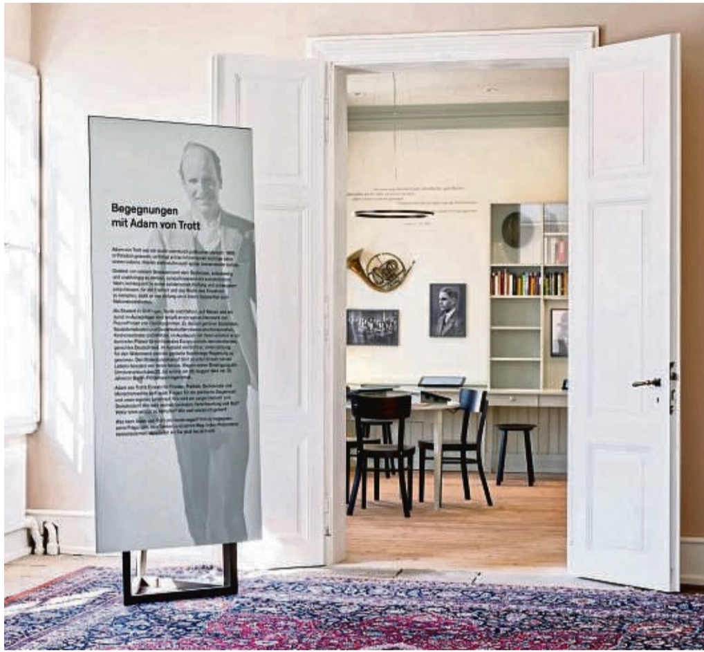
Die Türen stehen offen: Die Dauerausstellung über Adam von Trott kann nach telefonischer Absprache besichtigt werden. Besonders eingeladen sind Lehrer der Region mit ihren Schulklassen. Die Stiftung bietet interessante Workshops und Seminare für Schüler an.