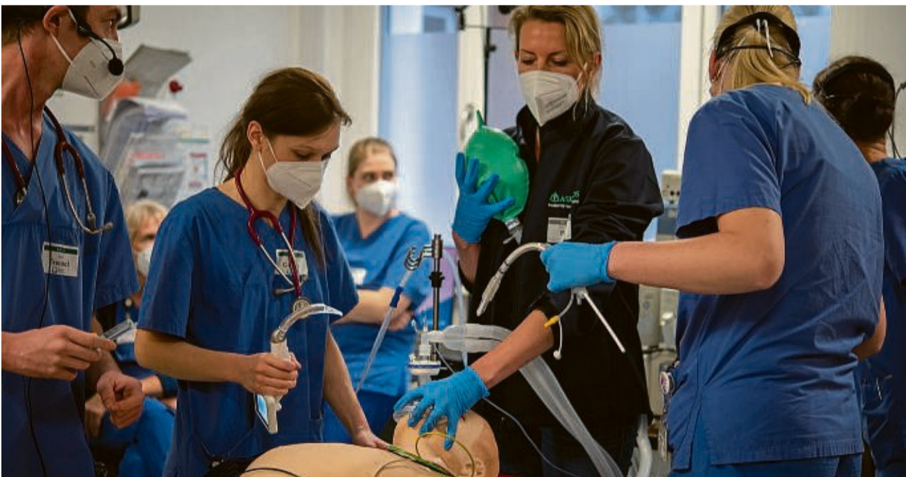
Trainierten verschiedene medizinische Notfälle: Das Team der Zentralen Notaufnahme des Asklepios Klinikums Schwalmstadt

Fachkräfte der Notaufnahme in Schwalmstadt trainieren notfallmedizinische Prozesse