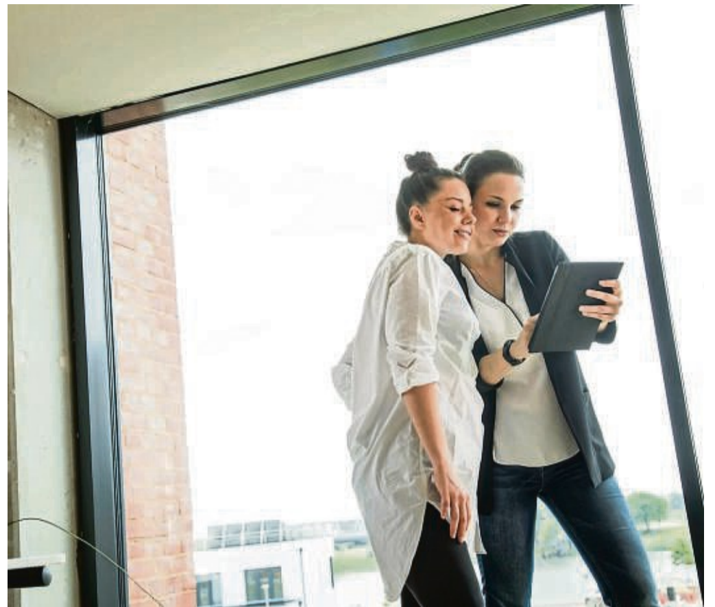
Kommt eine neue Führungskraft, sollten Beschäftigte keine Blockadehaltung einnehmen.