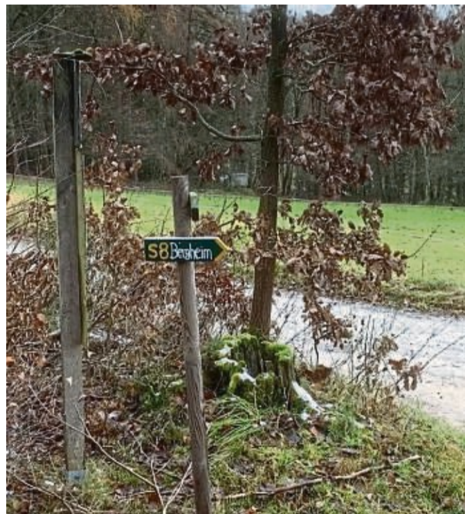
Alles neu zum Frühling: Die Wanderwege rund um Spangenberg wurden neu beschildert und markiert.

Peter Leiss und Fred Vockenroth vom Heimatverein Spangenberg haben sich auf den Weg gemacht und sind alle Wanderwege rund um Spangenberg abgelaufen, haben die Beschilderung erneuert und die GPX-Daten via ko-