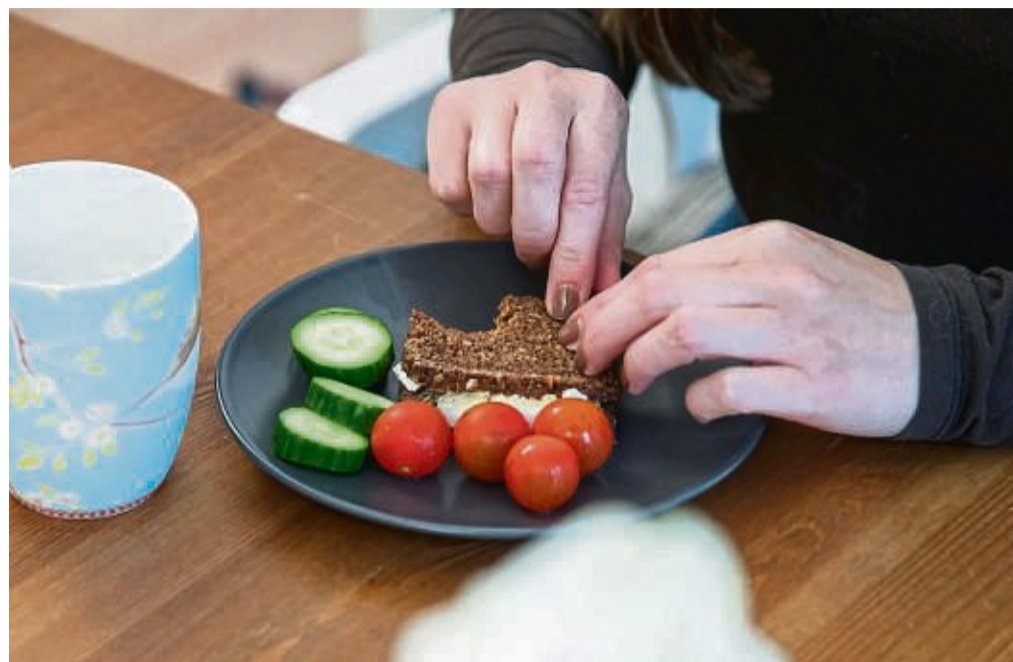
Kann ich noch einmal reinbeißen? Ein Gedankenkarussell, bei dem sich alles um Essen und Gewicht dreht, ist typisch für eine Magersucht.

Doch auch der eigene Charakter spielt eine Rolle: „Betroffene sind oft besonders diszipliniert und perfekto-