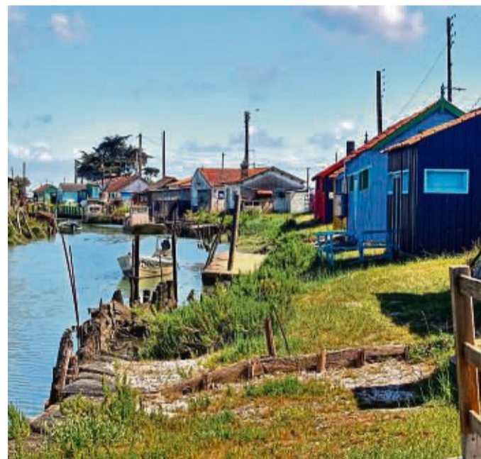
Idyllisch und bunt: Die Austernhütten auf der Île d'Oléron haben ihren eigenen Charme.