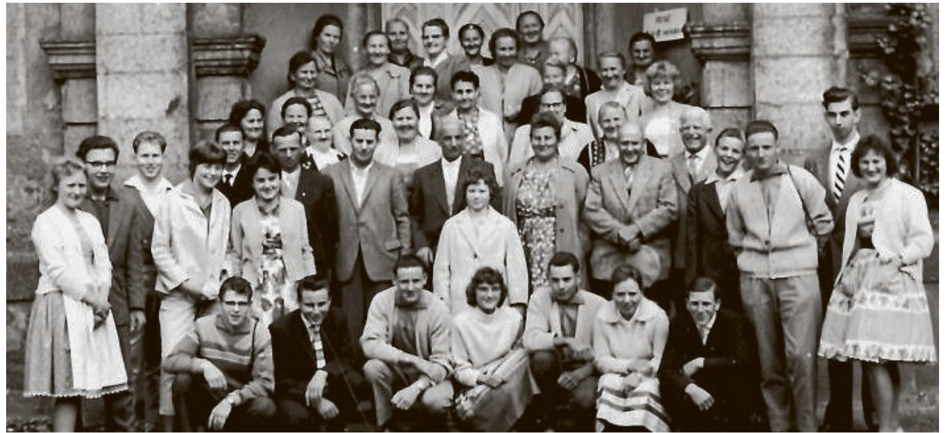
75 Jahre Einsatz für soziale Gerechtigkeit: Das Foto entstand 1952 – vor 70 Jahren während eines Ausflugs der Mitglieder.