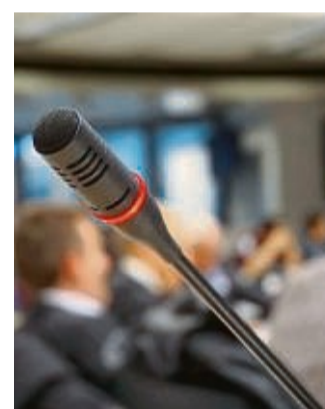
Können sich zu Wort melden: In Ausschusssitzungen der Stadt Witzenhausen besteht 20 Minuten lang die Gelegenheit zu Debatten mit Besuchern.

Diese Möglichkeit zur Diskussion besteht ab sofort. red