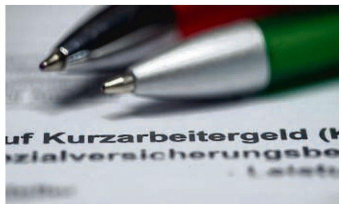
Kurzarbeit kann auf Beschäftigte auch mehrfach im Jahr zukommen – sofern der Betrieb die dafür nötigen Voraussetzungen erfüllt.