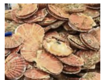
Jakobsmuscheln sind ein Bestandteil der Speisekarte (Symbolbild).