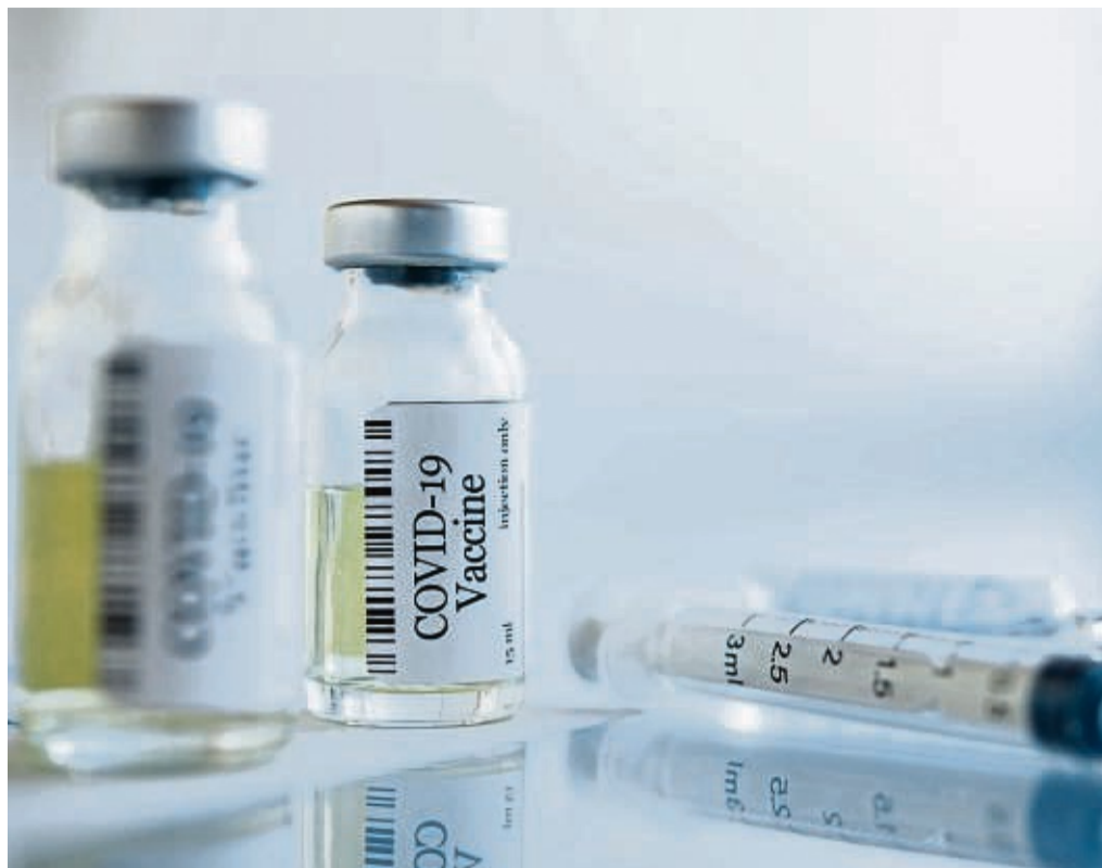
Kein Grund zur Sorge: Es gibt aktuell keine Hinweise darauf, dass Frauen wegen der Impfung unfruchtbar werden könnten.