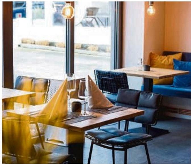
Restaurant in bester Lage: Ein Mündener eröffnet seinen Laden am Timmendorfer Strand. Es gibt „frische, regionale Küche“.

Er arbeitet mit Landwirten vor Ort zusammen. Ab dem kommenden Jahr bekommt er sogar Gemüse von seinen Partnern angebaut. „Für die