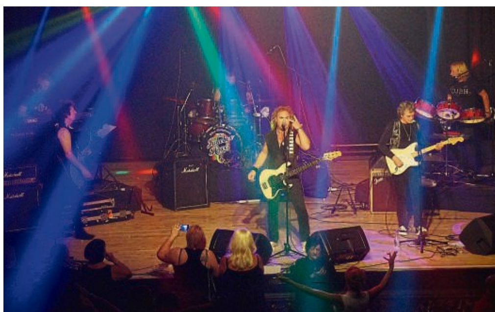
Jukebox Heroes wird am 24. Februar den Gästen live in der Stadthalle Dransfeld so richtig einheizen.