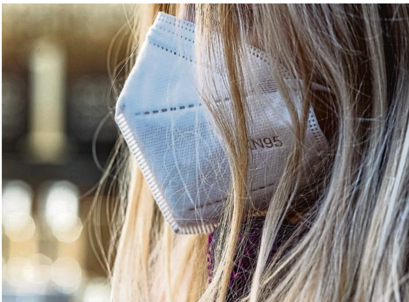
Ein großes Problem im Alltag von Gehörlosen: Seit Beginn der Pandemie tragen die Menschen Masken.