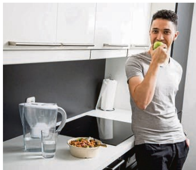
Einen Apfel in der Kaffeeküche: Im Büro kann man mit Obst für eine gesunde Auszeit sorgen.

Ob nun im Homeoffice oder im Büro - auch im Arbeitsalltag könne man einiges für seine Abwehrkräfte tun. Es gehe darum, „dass unser Körper diejenige Immunantwort abrufen kann, die wir in unserer jeweiligen Lebenssituation brauchen“, sagte Peters. Im Winter aber, wenn es draußen nass und kalt ist, es an Frischluft und Bewegung fehlt und frisches Gemüse seltener auf den Tisch kommt als Kohlenhydrate und Fettiges, sei die Bandbreite an bereitgehaltenen Immunantworten oft geringer. Um das Immunsystem im Arbeitsalltag auf Trab zu halten, rät die Medizinerin die Atemluft im Büro zu befeuchten - zum Beispiel durch Gefäße mit Wasser auf der Heizung. So würden die Schleimhäute als erste Barriere für Viren und Bakterien stabilisiert. Hals und Rachen befeuchtet man durch das Lutschen von zum Beispiel Salzpastillen oder zuckerarmen Bonbons. Barriere für Schadstoffe sei auch die Haut. Cremes mit ungesättigten