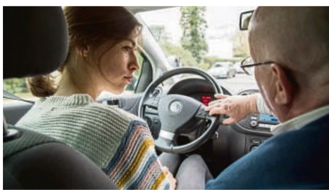
Auf der Suche nach einer Fahrschule können auch Erfahrungswerte im Freundes- und Bekanntenkreis dienlich sein.

Ganz am Anfang der Fahrausbildung steht die Suche nach einer geeigneten Fahr-