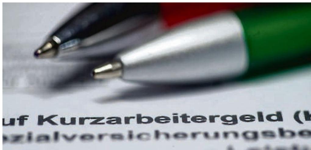
Kurzarbeit kann auf Beschäftigte auch mehrfach im Jahr zukommen – sofern der Betrieb die dafür nötigen Voraussetzungen erfüllt.