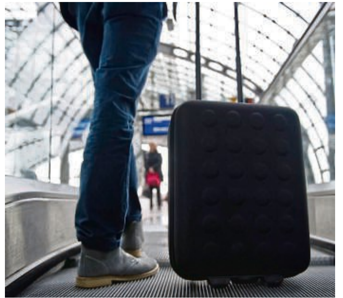
Wer beruflich auf Reisen geht, kann die Kosten steuerlich geltend machen.