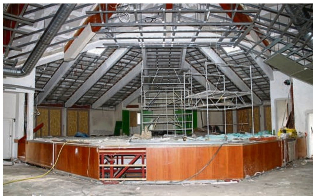
Noch Baustelle: Die Ederbergländhalle wird seit Ende 2020 saniert und umgebaut. Die Wiedereröffnung der Frankenberger Stadthalle ist für Juni geplant.

Als künftige Herausforderung bezeichnete er es, weiterhin Fachkräfte nach Frankenberg zu holen und Gewerbeflä-