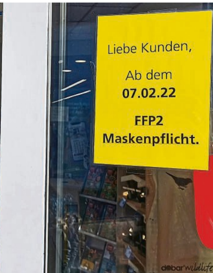
Kontrollen am Eingang entfallen: In Hessens Geschäften gilt seit Montag in allen Geschäften die FFP2-Maskenpflicht.