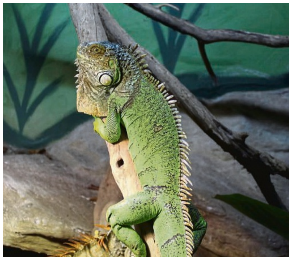
Exotische Tiere, so wie dieser grüne Leguan, finden in der Auffangstation in Sontra ein vorübergehendes Zuhause.

Die Auffangstation in Sontra ist die einzige offizielle in Hessen und Thüringen. Mit der Auffangstation Rheinberg, die Tiere aus Nordrhein-Westfalen aufnimmt, nimmt die Auffangstation Sontra pro Jahr zwischen 3000 und 3500 Tiere auf. Für die meisten Tiere ist Sontra nur eine Zwischenstation, anschließend werden sie an Zoos oder Privatpersonen, die die Tiere halten dürfen, weitervermittelt. „Manche Tiere bleiben aber auch länger bei uns, zu diesen baut man dann eine besondere Beziehung auf“, so Wischnewski. So etwa ein Netzpython, der vor sechs Jahren nach Sontra kam. „Damals war er etwa 1,70 Meter groß, mittlerweile ist er 4,5 bis fünf Meter lang und noch lange nicht ausgewachsen“, fügt der Tierpfleger an. Bis zu neun Meter kann die Schlange werden, für Zoos ist sie damit uninteressant. Wer Glück hat, kann vor Ort erleben, wie Schlangen sich ihre Nahrung selbst fangen und eine Maus oder einen Hamster verspeisen. Neben Schlangen sind auch viele Vogelspinnen heimisch in der Auffangstation. Auch einen Alligator, der in einem verwahr-