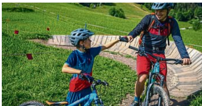
Besonders familienfreundlich sind Regionen, die über Bike-Parks verfügen, in denen kleine und große MBT-Fahrer ihre Technik verbessern können.

Die Experten können auch Hotels empfehlen, die den Ansprüchen von Eltern und Kindern gleichermaßen ge-