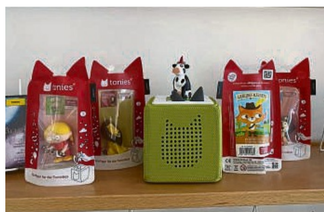
Kinderleicht zu bedienen: Die Tonie@-Boxen sind bei Eltern und Kindern sehr beliebt.

Für Kinder unter sieben Jahren ist der Ausweis jedoch kostenlos. red