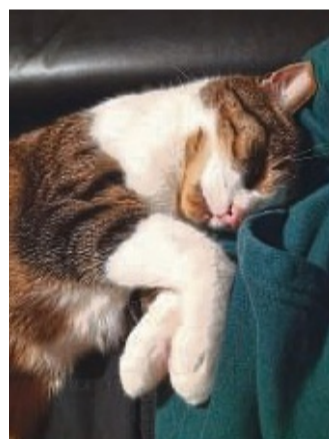
Bei Coronainfektion vermeiden: Engen Kontakt zu Tieren, zum Beispiel durch Kuscheln.

„Ich würde infizierte Tiere rein symptomatisch behandeln“, sagt die Tierärztin. Das bedeutet: Unterstützung des Immunsystems, andere Infektionen wie bakterielle Infekte behandeln, zum Beispiel mit Antibiotika, und Schleimlöser verabreichen. Auch Entzündungshemmer und eine Inhalationstherapie mit Kochsalzlösung sind möglich. Da es noch Unklar-