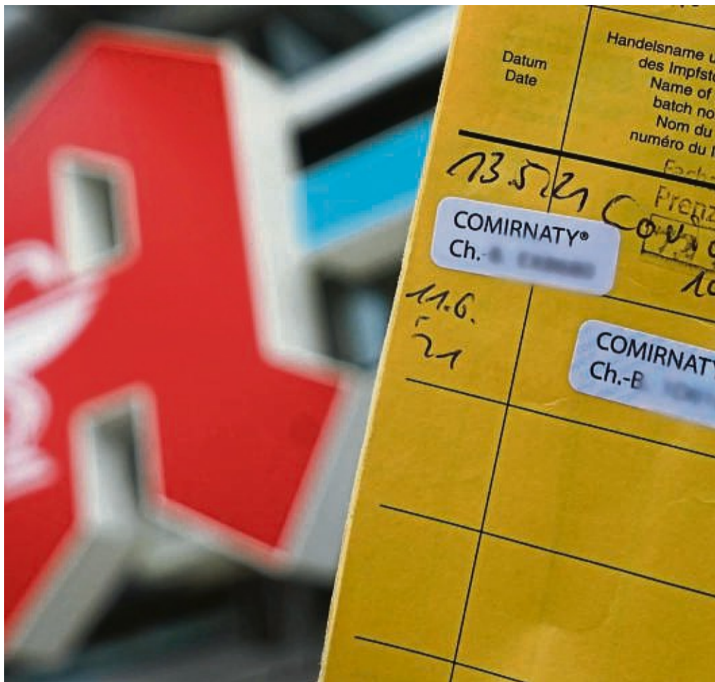
Seit dem 8. Februar dürfen auch Apothekerinnen und Apotheker in Deutschland gegen das Coronavirus impfen. Voraussetzung ist eine umfassende Schulung.

So wird es unter anderem vonseiten der Adler-Apotheke in Eschwege und der Meißner-Apotheke erklärt. „Und wenn beim Impfen doch etwas passiert, ist die Verant-