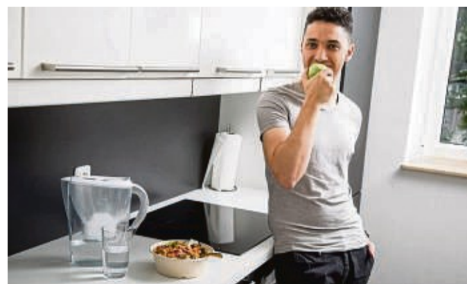
Einen Apfel in der Kaffeeküche: Im Büro kann man mit Obst für eine gesunde Auszeit sorgen.

Das Immunsystem bei der Arbeit trainieren