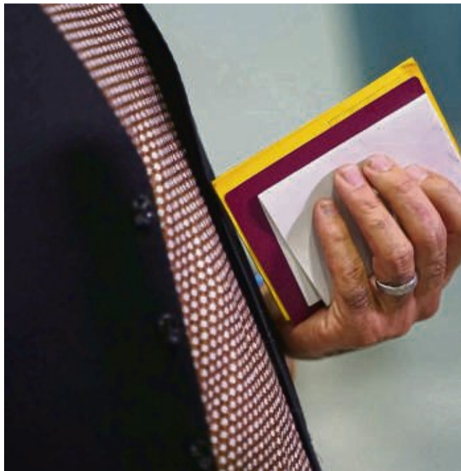
Die Liste der Hochrisikogebiete wird immer länger: Reisende kann das in der Urlaubsplanung verunsichern.