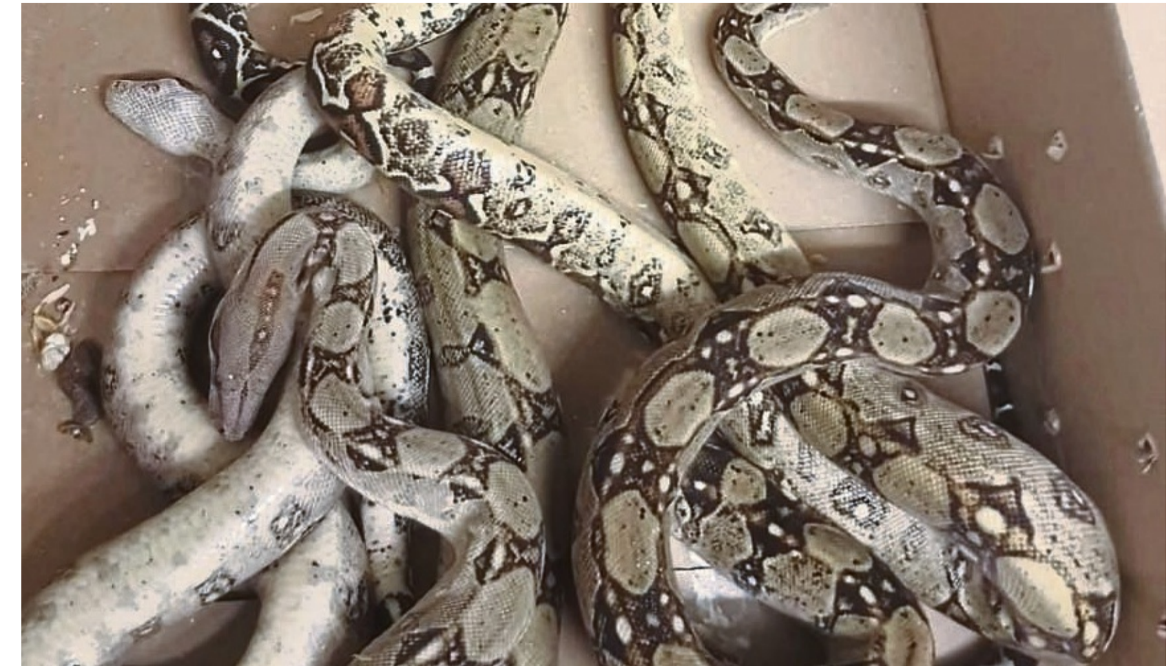
Sieben Schlangen vor dem Reptilienzoo ausgesetzt: Die Würgeschlangen, darunter vier Jungtiere, wurden über Nacht ausgesetzt und sind erfroren.

Kein Tier muss erfrieren, weil sich die Besitzer die Auf-