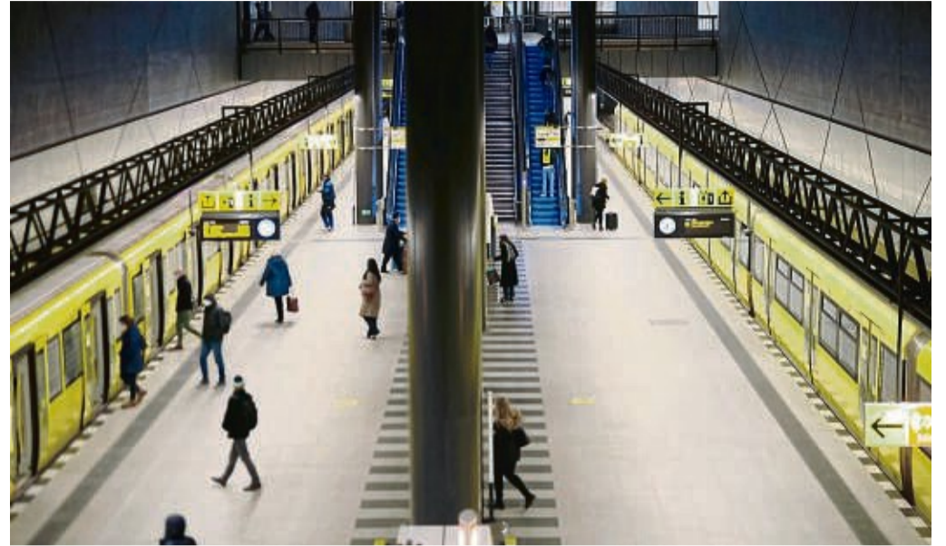
Wenn es beim Gehalt kein Verhandlungsspielraum gibt, kann sich zum Beispiel ein Zuschuss vom Arbeitgeber zum ÖPNV-Ticket lohnen.