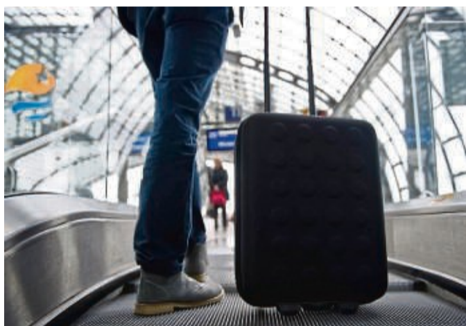
Wer beruflich auf Reisen geht, kann die Kosten steuerlich geltend machen.

Darauf macht die Bundessteuerberaterkammer in Berlin aufmerksam. Wurden die Ausgaben zu einem Teil übernommen, können Arbeitnehmerinnen und Arbeitnehmer die Differenz geltend machen.