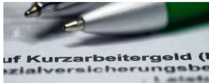
Kurzarbeit kann auf Beschäftigte auch mehrfach im Jahr zu kommen – sofern der Betrieb die dafür nötigen Voraussetzungen erfüllt.