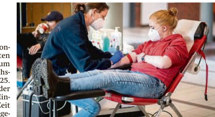
Neuer Blutspendetermin: Am 25. Februar von 16.45 bis 20.30 Uhr in der Adam-von-Trott-Schule.

Weitere Informationen gibt es im Internet unter blutspende.de/informationen-zum-coronavirus . Die kostenfreie Service-Hotline des DRK-Blutspendedienst steht unter 0800/1 19 49 11 zur Verfügung