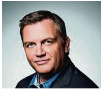
Hape Kerkeling: Autor von „Pfoten vom Tisch“.

Ob er mal weg ist, an die frische Luft muss oder einfach auf sein Leben blickt: Hape Kerkeling ist ein Meister der vielschichtigen Autobiografie, in der es nie nur um seinen Lebensweg geht. Wenn er über sich erzählt, können seine Millionen Leserinnen und Leser immer etwas lernen - selbst wenn sie das gar nicht vor-hatten. Darum ist „Pfoten vom Tisch! Meine Katzen, andere Katzen und ich“ mehr als eine Hommage an seine lebenslange Katzenliebe. Der Bestseller gilt bereits jetzt als der amüsanteste Ratgeber für neue und alte