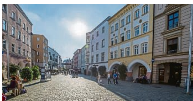
Rosenheims Altstadt mit ihren italienisch anmutenden Arkaden verströmt im Sommer mediterranes Lebensgefühl.

Ob Espresso und Eis unter regionstypischen Laubengän-