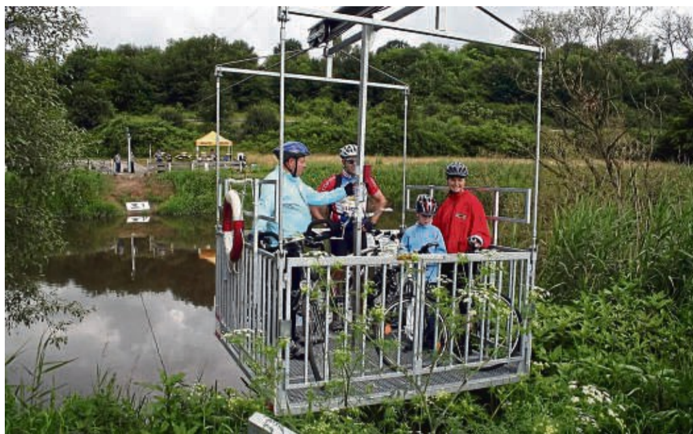
Attraktion: Die Seilbahn zwischen Malsfeld und Morschen ist aber nicht bei jedem beliebt. Wenn nur eine Person übersetzt, ist es beispielsweise sehr kräftezehrend.