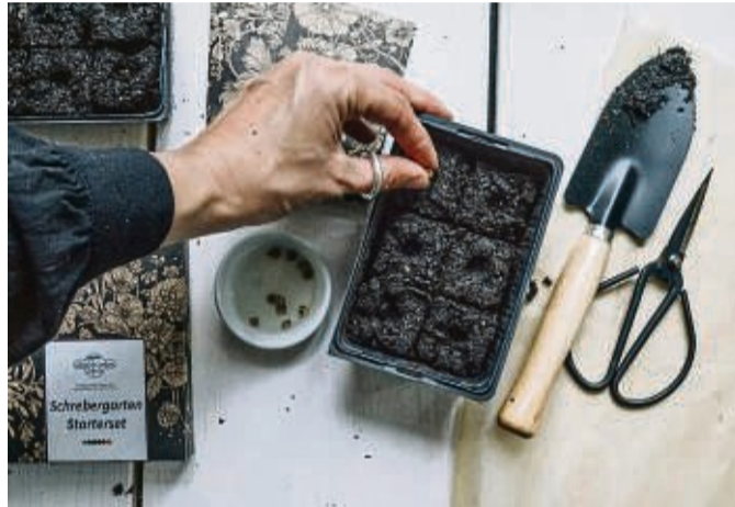
Pflanzen, die frostempfindlich sind und eine lange Kulturdauer haben, sollte man im Haus vorziehen. Dazu zählen etwa Paprika, Tomaten, Auberginen und die großen Kohlsorten.

mache ich eine Bodenprobe. Meist harke ich aber einfach nur frischen Kompost ein, ziehe eine Reihe - und dann geht es los. Gerade die ersten Aussaaten brauchen eher wenig Nährstoffe. Erst wenn ich Tomaten und Kürbis setze, gebe ich Langzeitdünger wie Hornspäne und Rinderdungpellets in die Erde.