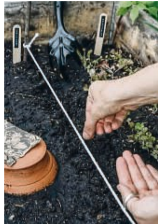
Am Anfang und am Ende ein Stöckchen in die Erde stecken, dazwischen eine Schnur spannen.