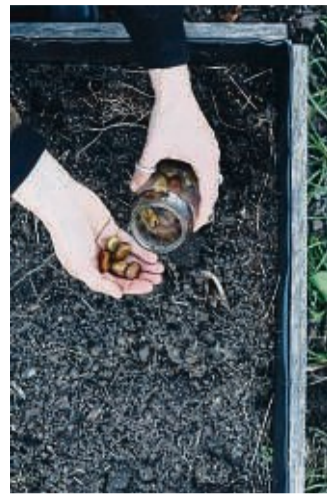
Dicke Bohnen können aber direkt ins Beet.