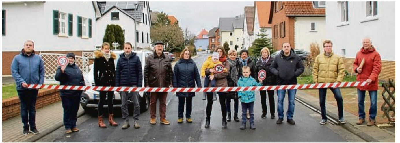
Symbolischer Protest gegen belastenden Verkehr in einer „ruhigen“ Minute: Anwohner der Altenburger Straße mit Absperrband und symbolischen Tempo-30-Schildern. Sie fordern auch ein Durchfahrverbot für Lkw über 7,5 Tonnen und einen neuen Fahrbahnbelag.

Das Hauptproblem: Es werde zu schnell gefahren, der Straßenzustand sei miserabel. Die Altenburger Straße wird auch von vielen Schulkindern benutzt. Sie gehen über den Ederweg zur Dreiburgenschule. Bis zum Ortsausgang fordern die Anwohner für die Kreisstraße Tempo 30 wie in der Ortslage Altenburg, ein Durchfahrverbot für Lastwagen über 7,5 Tonnen, einen neuen Fahrbahnbelag sowie versetzte Blumenkübel am Ortsausgang in Richtung Altenburg beziehungsweise in der Gegenrichtung.