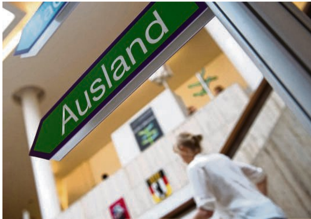
Während eines Praktikums in einem Betrieb im Ausland können Azubis ihre Kenntnisse und Techniken ausbauen.

Für Auslandsaufenthalte in Ländern, die Erasmus+ nicht abdeckt, gibt es das Förderprogramm AusbildungWeltweit. Ausbildungsbetriebe, Kammern, überbetriebliche Ausbildungszentren oder Schulen können Zuschüsse für ihre Auszubildenden beantragen. Sofern bereits ein Partnerbetrieb im Ausland gefunden wurde. tmn