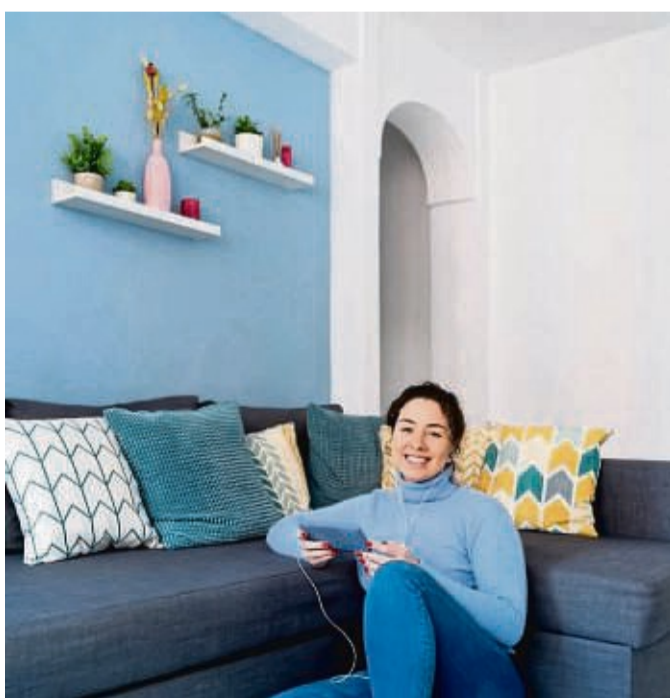
Wer seine Wohnung farblich neu abstimmen lassen möchte, sollte beachten, dass die Farbtöne zu den vorhandenen Möbeln passen.

Auch habe die Qualität der vom Profi eingesetzten Farben weiter zugenommen. „Hinsichtlich Pigmentgehalt, Deckkraft, Beständigkeit und Farbstärke sind diese Materialien, die im Baumarkt nicht zu bekommen sind, den vom Heimwerker eingesetzten Farben haus-