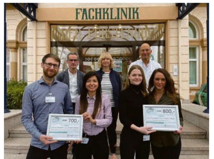
Freuen sich über die Auszeichnung: Die Preisträger (vorne) mit der Jury (hinten).

„Im medizinischen und therapeutischen Bereich gibt es keinen Stillstand der Forschung und Weiterentwicklung, jedoch fehlt im Klinikalltag oft die Zeit sein eigenes Tun dahingehend zu reflektieren. Die Teilnahme an dem Preisausschreiben war daher eine gute Gelegenheit.“ Die zweiten Preisträ-