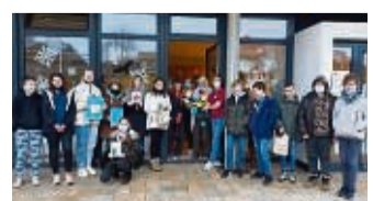
Freude schenken: Schüler des Schulzentrums an der Warte übergaben selbst gebastelte Präsente an Senioren.

schaft, hoffen die Initiatoren. Ein nächstes Treffen im Frühjahr ist schon angedacht, wenn es wieder heißt: Kleine Gesten – große Freuden. red