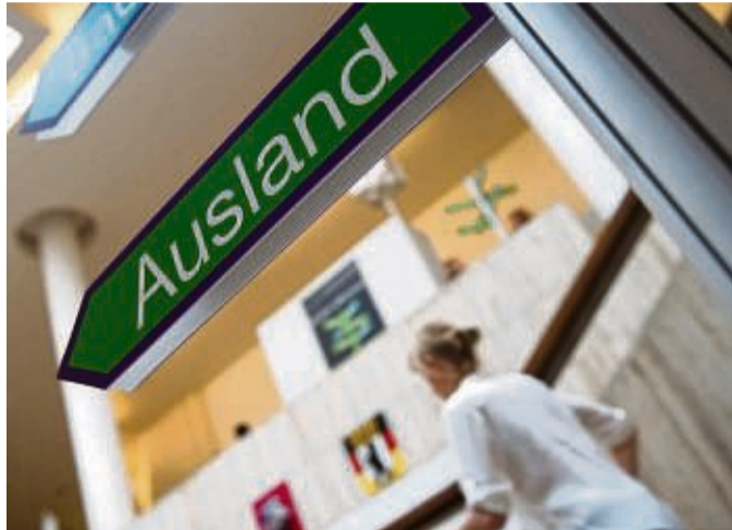
Während eines Praktikums in einem Betrieb im Ausland können Azubis ihre Kenntnisse und Techniken ausbauen.