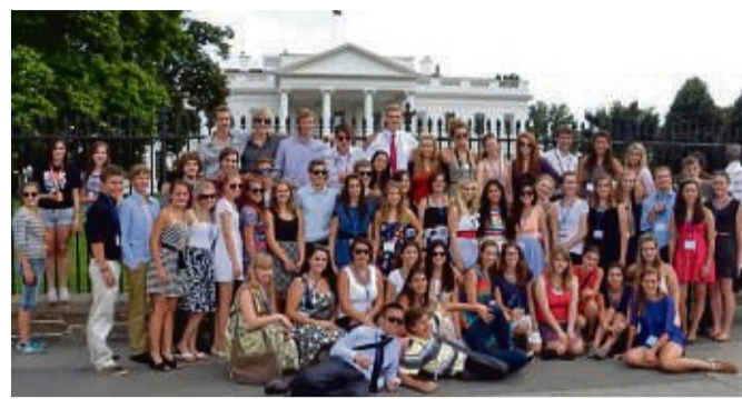
Sie haben ihr Abenteuer schon erlebt: Stipendiaten aus Deutschland vor dem Weißen Haus in Washington. Sie haben für ein Jahr in den USA gelebt.

Ziel des Schüleraustausch-Programms ist es, die deutsch-amerikanische Freundschaft zu stärken. „Die Jugendlichen erhalten einen intensiven Einblick in eine andere Lebensweise und ver-