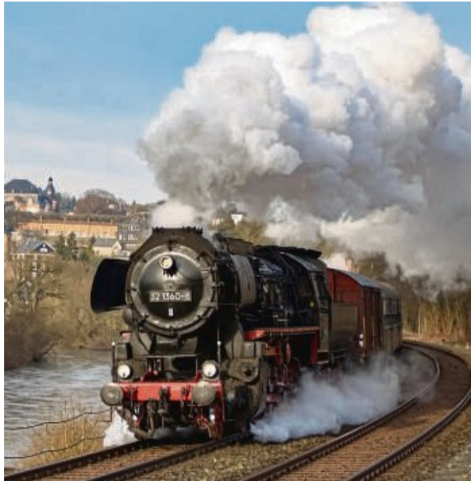
Nach fast zwei Jahren pandemiebedingter Pause laden die Eisenbahnfreunde Treysa e.V. wieder zu ihren Sonderfahrten ein.