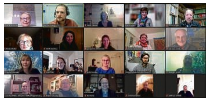
Online-Konferenz: Der Screenshot zeigt die Teilnehmer eines der Fachforen.