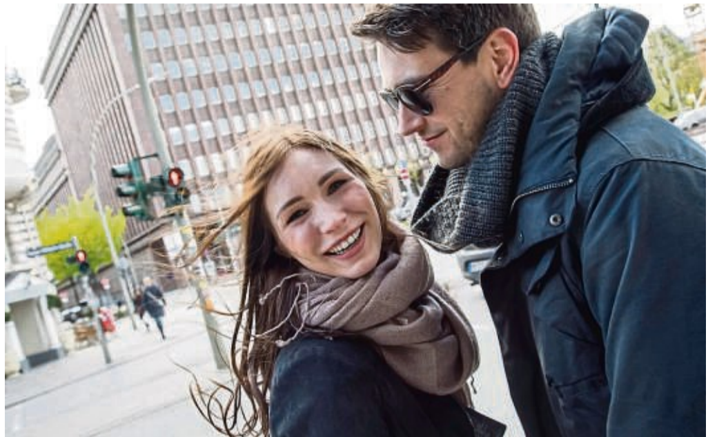
Ein schönes Kompliment kann nicht nur den Tag eines anderen Menschen verschönern, sondern auch den eigenen.

Das war „Du hast so schöne Grübchen, wenn du lachst.“ Diese sind mir vorher noch gar nicht selbst aufgefallen - und seitdem lache ich auch mehr!