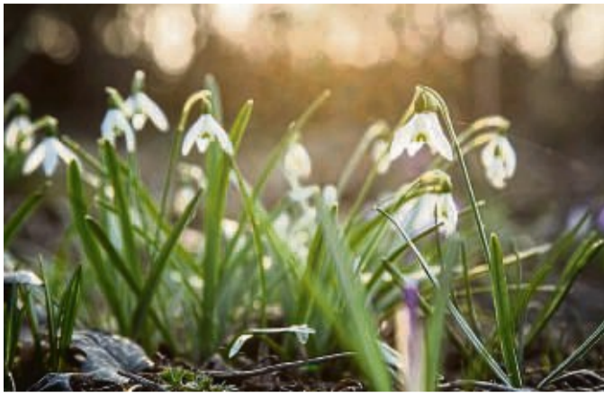
Schöne Blüten – etwa die der Schneeglöckchen – gibt es auch mitten im Winter. Schneeglöckchen etwa blühen von Januar bis Februar.