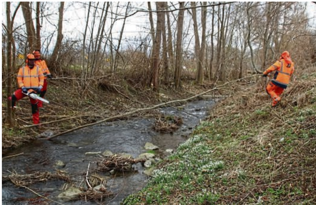
Arbeitseinsatz im und am Rhündabach: Mitarbeiter des städtischen Bauhofes beseitigen störenden Wildwuchs, damit das Wasser wieder besser abfließen kann.