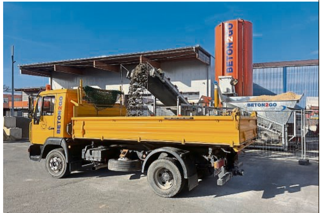
Das Mini-Betonmischwerk „BETON2GO“ produziert in wenigen Minuten Beton und Estrich zum Mitnehmen.

Die kleinste Abgabemenge ist 150 l. (nach oben keine Grenzen) für ca. 35 € inkl. MwSt. Bei dem Vergleich zu anderen Betonwerken sind die Mindestabgabemengen zu berücksichtigen, denn häufig setzen vermeintlich günstige Angebote den Kauf einer kompletten LKW-Ladung von 5 m 3 oder 6 m 3 voraus.