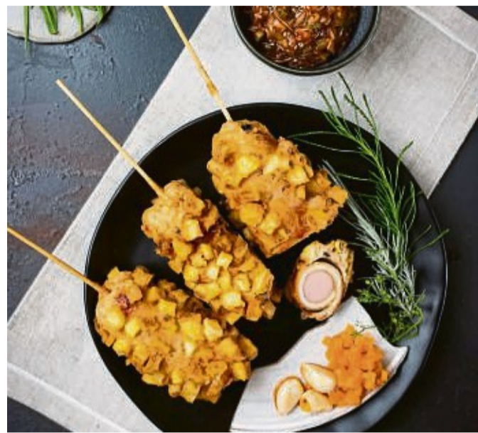
Für Korean Dogs werden die Würstchen in Maisteig gewendet und dann in Pommes-Würfeln gewälzt.