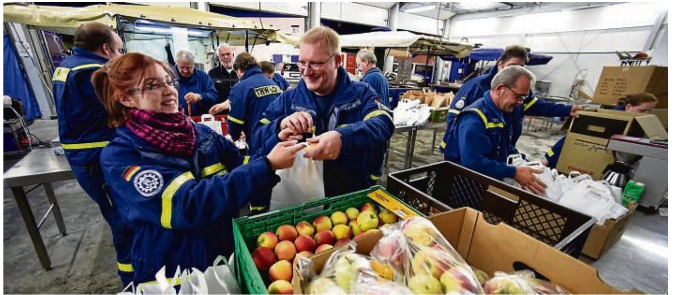
Waren in der Versorgung von Flüchtlingen tätig: Helferinnen und Helfer des Technischen Hilfswerks.

Außerdem engagieren sich sieben Jugendliche beim Ortsverband.