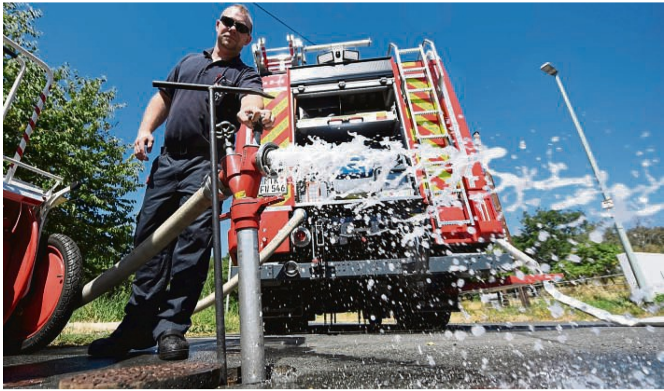
Die Feuerwehr greift mit Hydranten auf das Trinkwassernetz zu (Symbolbild).

So sollen Ortsfeuerwehren ihren jährlichen Wasserverbrauch für eine Abrechnung melden. Darüber hinaus fordert der Verband eine Pauschale für die Löschwasserversorgung, die auf Basis des Vorjahreswasserverbrauchs im Verhältnis zu den Haushalten, für die die Leistung angeboten werden kann, berechnet wird. Aufgrund der Leistungsfähigkeit des Netzes gilt das derzeit nur für die Dörfer Dankelshausen, Jüh-