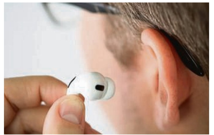
Die 200 Euro teuren Apple Airpods Pro (3. Generation) teilen sich den dritten Platz mit zwei anderen Modellen.