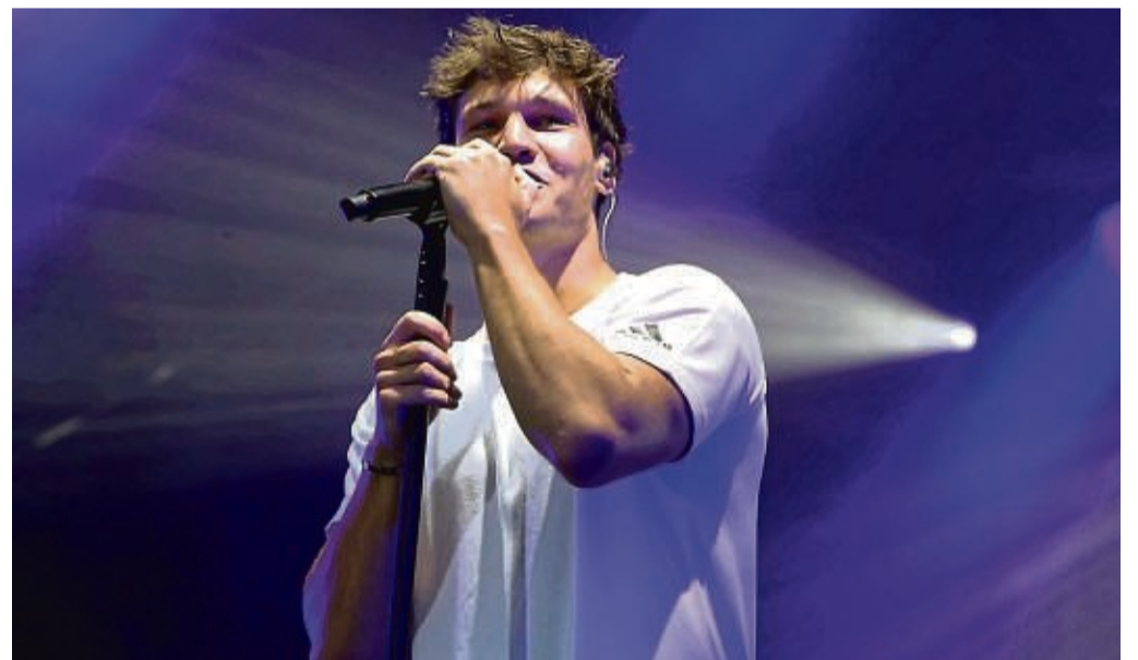
Hat bereits 2021 für gute Stimmung gesorgt: Wincent Weiss beim SoundGarten Open Air in Bad-Sooden-Allendorf.

Soundgarten: Nächster Künstler für den Sommer steht fest