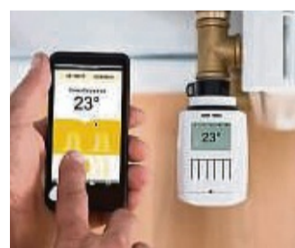
Die Elektroausstattung und Smart Home senken die Energiekosten.

temen kann man schnell und einfach Stromverbrauch und -kosten senken. Der E-CHECK bietet echte Mehrleistung mit der vom Elektromeister angebotenen Energiesparberatung. Die Spezialisten des Elektrohandwerks beraten individuell, an welchen Stellen der Stromverbrauch