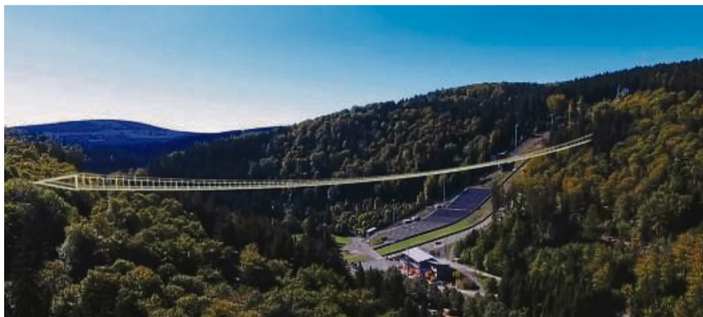
Die längste Hängebrücke der Welt nimmt Gestalt an: So soll der „Skywalk“ – hier eine Bildmontage – zwischen dem Willinger Mühlenkopf und dem Usselner Musenberg aussehen. Als erstes werden die Verankerungen gebohrt.

Die Hängebrücke wird im tibetanischen Stil errichtet - Tragseile und Streben aus Stahl halten die gesamte Konstruktion, die 125 Tonnen wiegt. Die Fußgänger laufen über einen 1,30 Meter breiten Gang. Die Brücke darf bis zu 700 Besucher tragen. Nach etwa acht Monaten Bauzeit soll die Brücke im Herbst fertig sein.