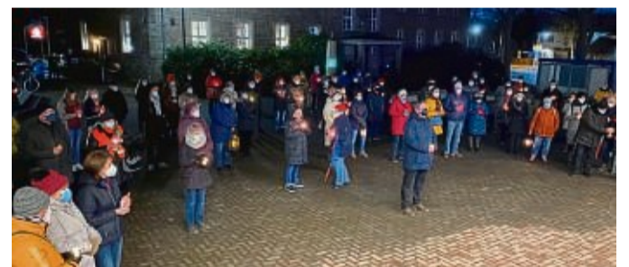
Mahnwache und Friedensgebet auf dem Platz zwischen dem Arolser Bürgerhaus und Rathaus gegen den russischen Angriff auf die Ukraine. Rund 150 Menschen versammelten sich dort und spendeten für die Opfer.

Palettenholz in Korbach zu verschenken. ☎ 05631-63187