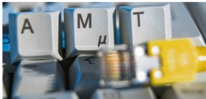
Die Stadt Korbach soll digitaler werden.

Über die Smartphone-Kamera der Nutzenden wird die landschaftliche Entwicklung dann in das Live-Bild eingefügt, sodass Realität und digitale Welt miteinander verschmelzen und eine Geschichte erzählen. Der Geopark Grenzweiden des Landkreises Waldeck-Frankenberg hat das Konzept entwickelt und bereits ähnliche Projekte umgesetzt, etwa in der Korbacher Spalte. lb/red