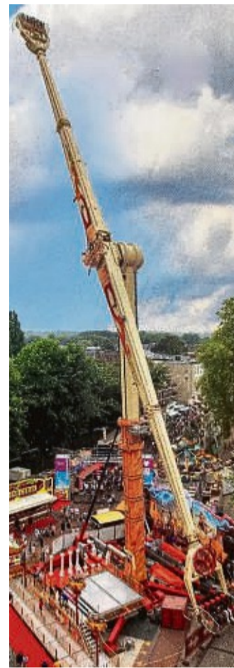
Das Fahrgeschäft Gladiator misst 62 Meter.