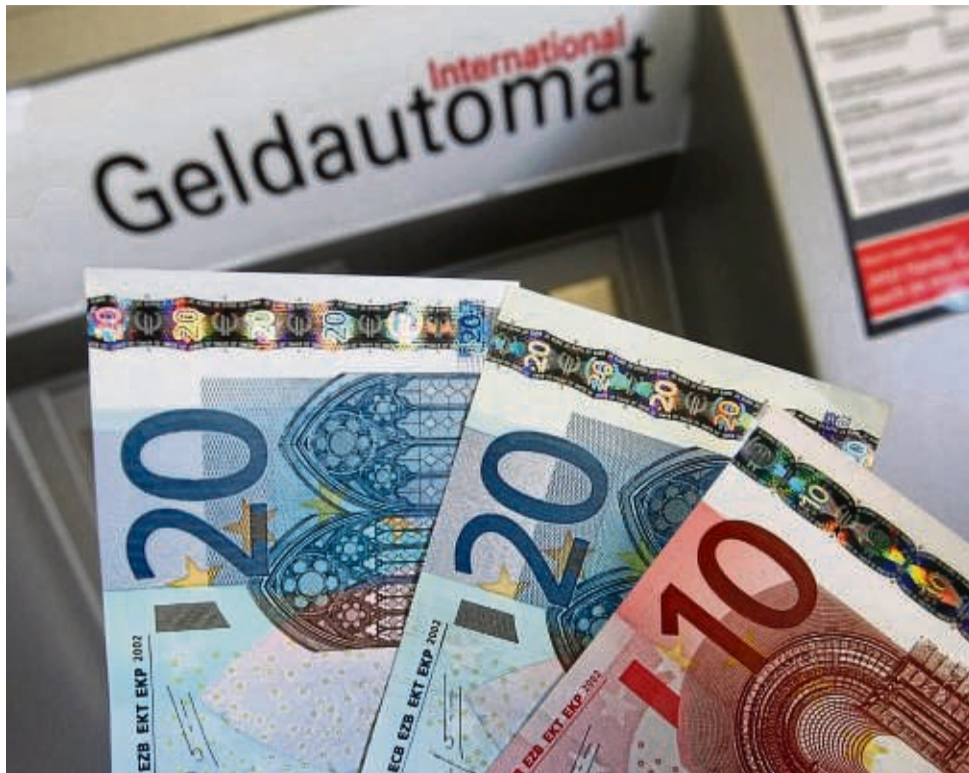
Bargeld in Geldautomaten lockt Bankräuber an. Die Sparkasse Waldeck-Frankenberg führt deshalb ab sofort vorbeugende Maßnahmen ein.