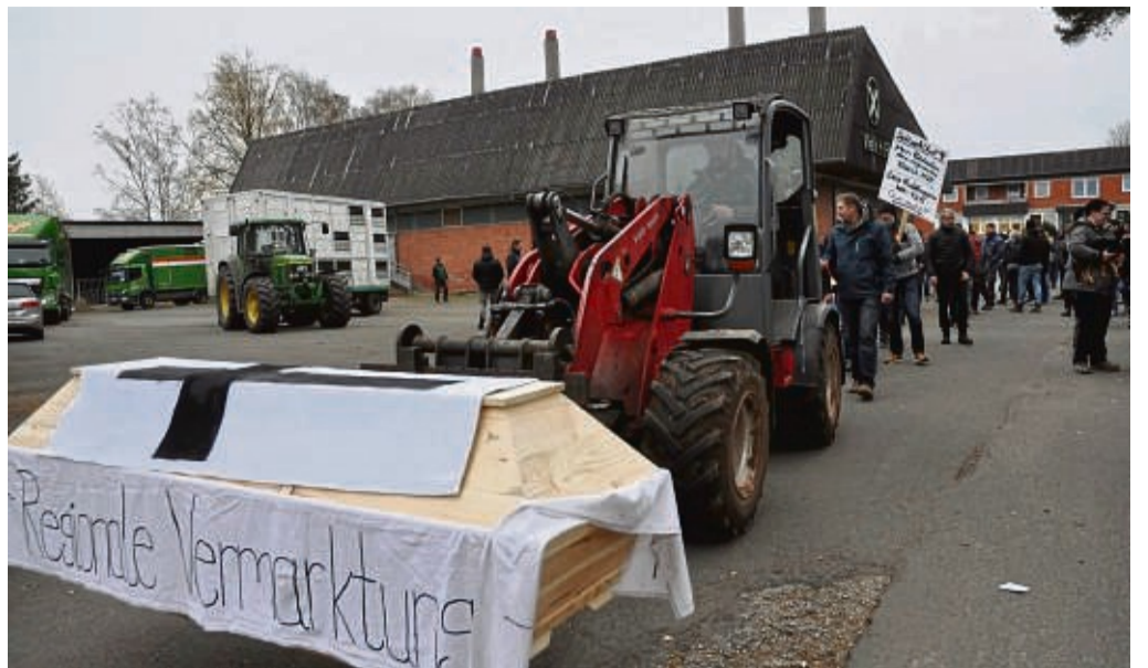
Letzte Schlachtung am 15. November 2021 in Mengeringhausen: Enttäuschte Landwirte, Kommunalpolitiker und Metzger aus der Region trugen damals symbolisch den Mengeringhäuser Schlachthof zu Grabe.

Zunächst habe sich der Landkreis mit den Regierungspräsidien in Kassel als Veterinäraufsichtsbehörde und Gießen als zuständige Förderstelle sowie mit den zuständigen Ministerien in Wiesbaden abstimmen müssen, bevor eine Machbarkeitsstudie habe in Auftrag gegeben werden können. Inzwischen sei aber ein erfahrener Gutachter in Mittelfranken vom Landkreis mit der Studie beauftragt worden. An den Kosten in Höhe von rund 20.000 Euro, beteiligt sich zur Hälfte das Land Hessen. Von der Machbarkeitsstudie erhofft sich der Landkreis