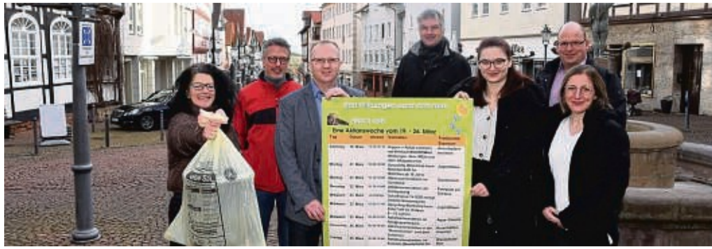
Frühjahrsputz in Bad Wildungen: Vom 19. bis 26. März können alle Bürger helfen, die Kernstadt sauber zu machen.