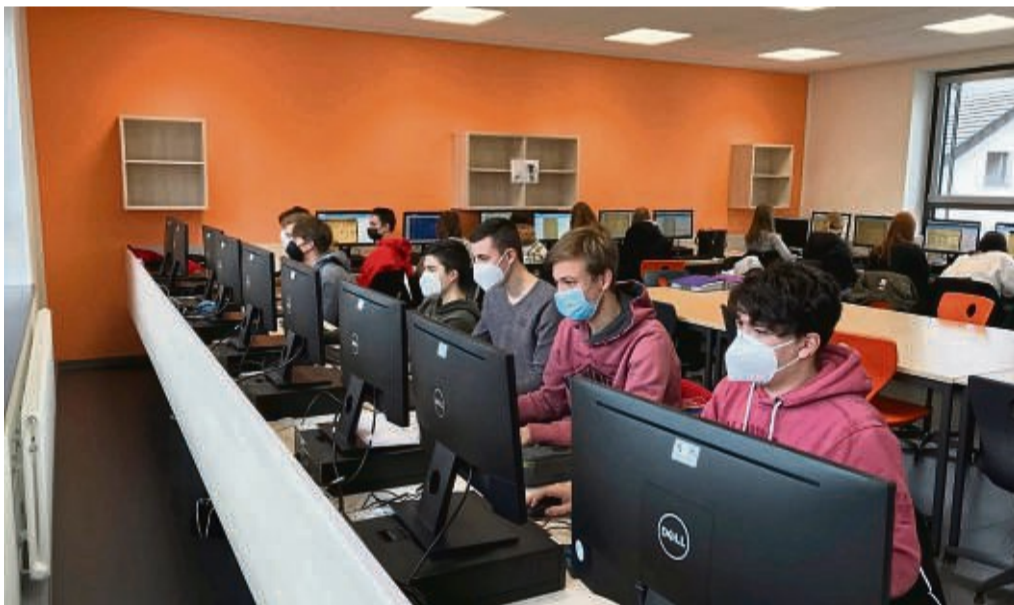
Dokumente aufbereitet: Schüler der Jahrgangsstufe 10 der Willinger Uplandschule verschlagworteten für Arolsen Archives Dokumente aus der NS-Zeit.

„Es ist erschütternd zu sehen, wie viele Menschen verschiedener Nationalitäten nach Buchenwald deportiert wurden“, so die einhellige Meinung der Schüler. Um mehr über die Schicksale einzelner Opfer zu erfahren,