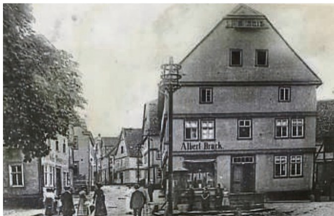
Historische Ansicht: Das Bettenhaus Brack in der Korbacher Altstadt, hier noch mit dem Kump vor der Tür.

„Wegen der vielen Jubiläumsangebote lohnt sich ein Besuch gerade jetzt besonders“, so die Inhaberin. „Die sprichwörtlich große Auswahl, die kompetente Beratung und den umfassenden Service gibt es wie immer gratis dazu.“