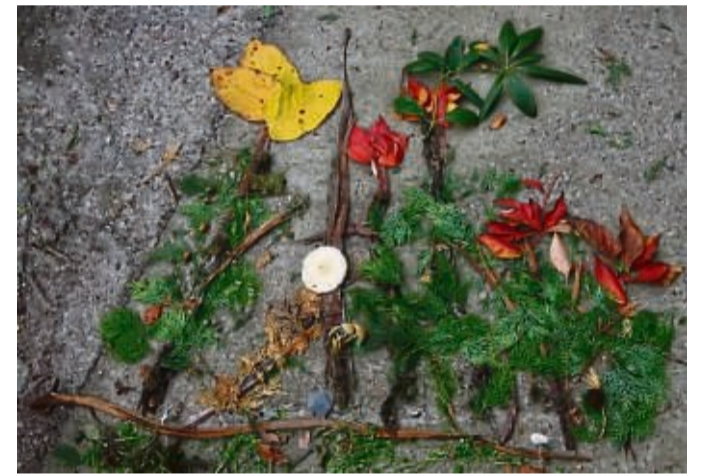
Kreatives Beispiel: Es gibt viele Möglichkeiten, ein Kunstwerk aus Materialien zu erstellen, die die Natur in großer Vielfalt bietet.

Das Mitmachen ist bei dem Wettbewerb für Familien ganz einfach: Kunstwerk in der Natur erschaffen, fotografieren (bitte ein hochauflösendes Bild von mindestens 1 MB und höchstens 5 MB erstellen) und bis zum 31. März an die E-Mail-Adresse jugendarbeit@lkwafrk.de schicken. Das Team des Fachdienstes Sport und Jugendarbeit freut sich auf kreative Einsendungen. red