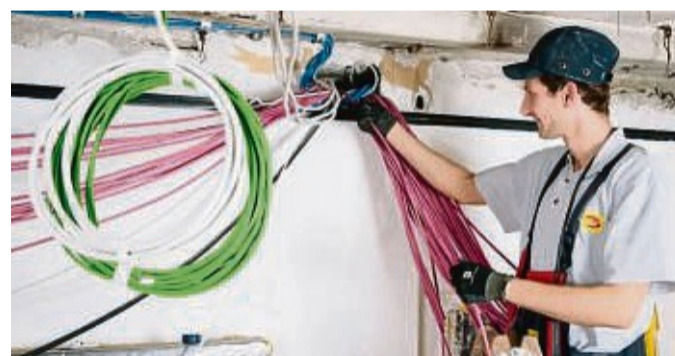
E-Check im Altbau.

Der Fachbetrieb ermittelt mögliche Mängel, bestimmt den Erneuerungsbedarf und berät hinsichtlich zukünftiger Baumöglichkeiten. Bei der Sanierung eines Altbaus sogleich an die Zukunft gedacht werden: Mit einer ent-