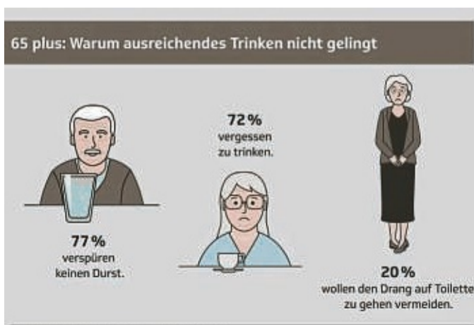
Befragte, denen es nicht gelingt, ausreichend zu trinken, geben die dargestellten Gründe an. GRAFIK: TECHNIKER KRANKENKASSE

decken diesen zu rund 71 Prozent. Generell scheint das Erfolgsrezept für eine ausreichende tägliche Flüssigkeitsmenge das regelmäßige Trinken über den Tag verteilt zu sein (86 Prozent). Menschen, die überwiegend nur zu Mahlzeiten oder am Abend trinken, nehmen hingegen häufig nicht ausreichend Flüssigkeit zu sich (jeweils 28 Prozent). ma