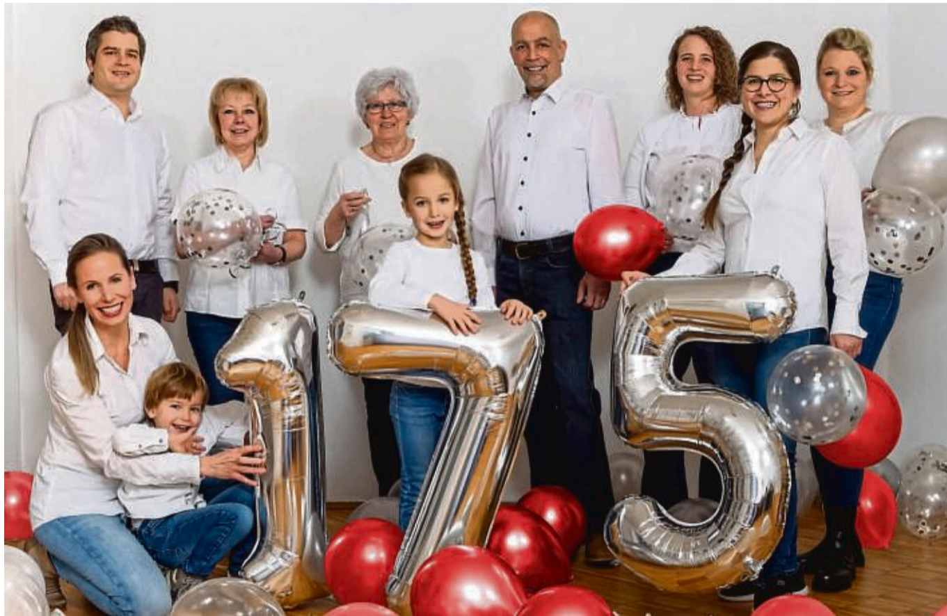
Sie stehen für qualifizierte Beratung: Das Team vom Bettenhaus Brack im Jubiläumsjahr.

Aktuell hätte das Betten- und Aussteuerhaus Brack, auch als Betten Brack bekannt, zum 175-jährigen Jubiläum gerne ein großes Fest gefeiert – doch die Corona-Pandemie, wie auch die aktuellen politischen Entwicklungen bieten keinen passenden Rahmen dafür. „Dennoch möchten wir unseren vielen Stammkunden ein besonderes Geschenk machen