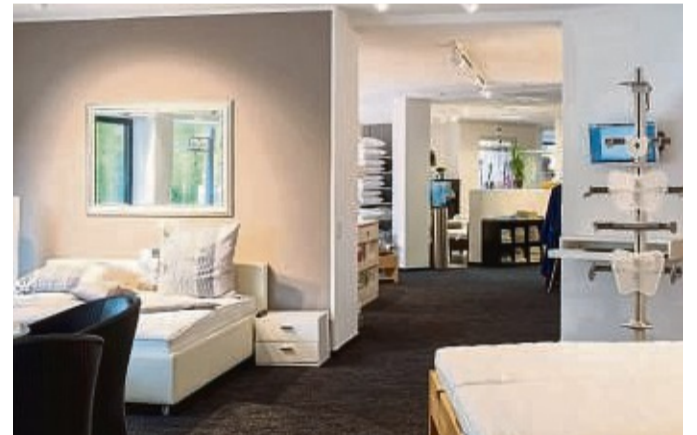
Das Bettenhaus heute: Die hellen, modernen Ausstellungsräume im Jubiläumsjahr.