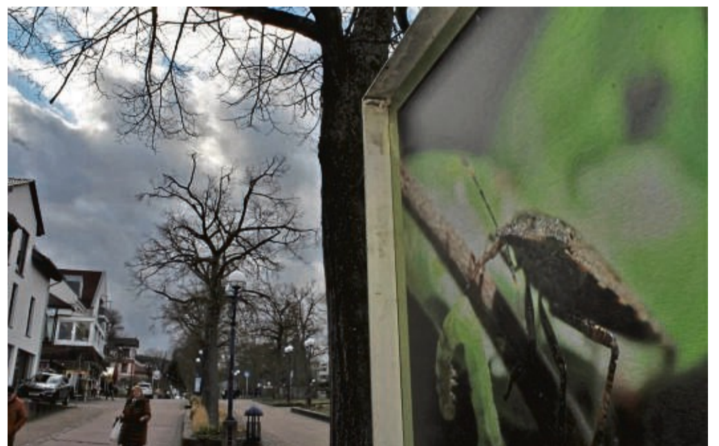
Die Kunst-Stelen entlang der Brunnenallee sind erneut Bestandteil des Wildunger Bürgerhaushalts. Aktuell zeigen sie Bilder von Markus Sarrazin.