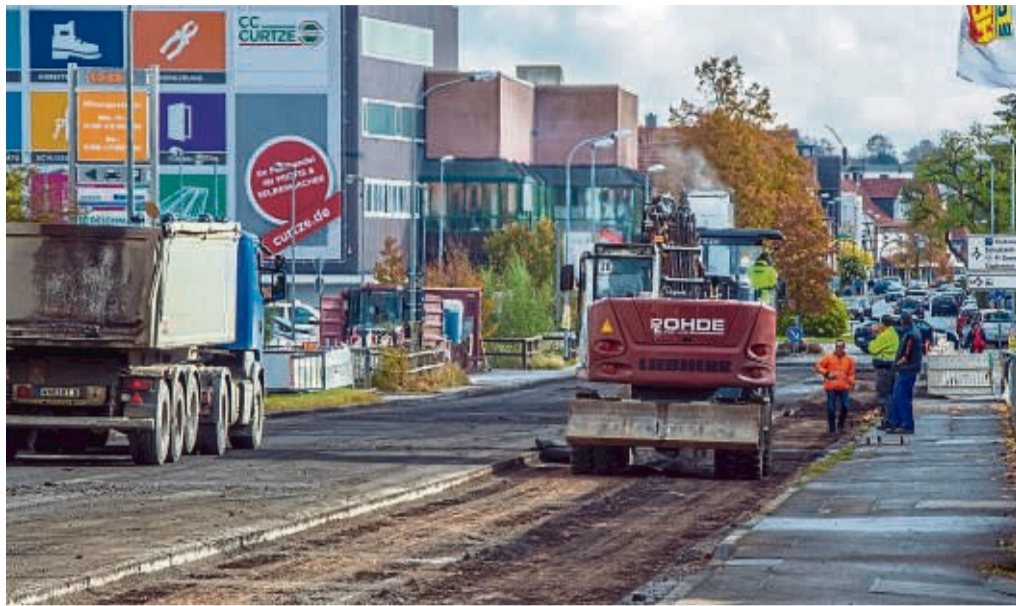
Bauarbeiten an der Briloner Landstraße: Im März geht es mit dem zweiten Bauabschnitt weiter.

In der ersten Phase bis etwa Anfang/Mitte Mai kann die Briloner Landstraße nur stadteinwärts als Einbahnstraße befahren werden. Der Westring wird vom Kreisver-