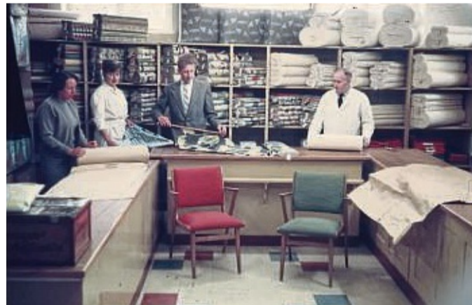
Qualität und Kundennähe: Ein Blick in die früheren Verkaufsräume des Bettenhauses Brack.