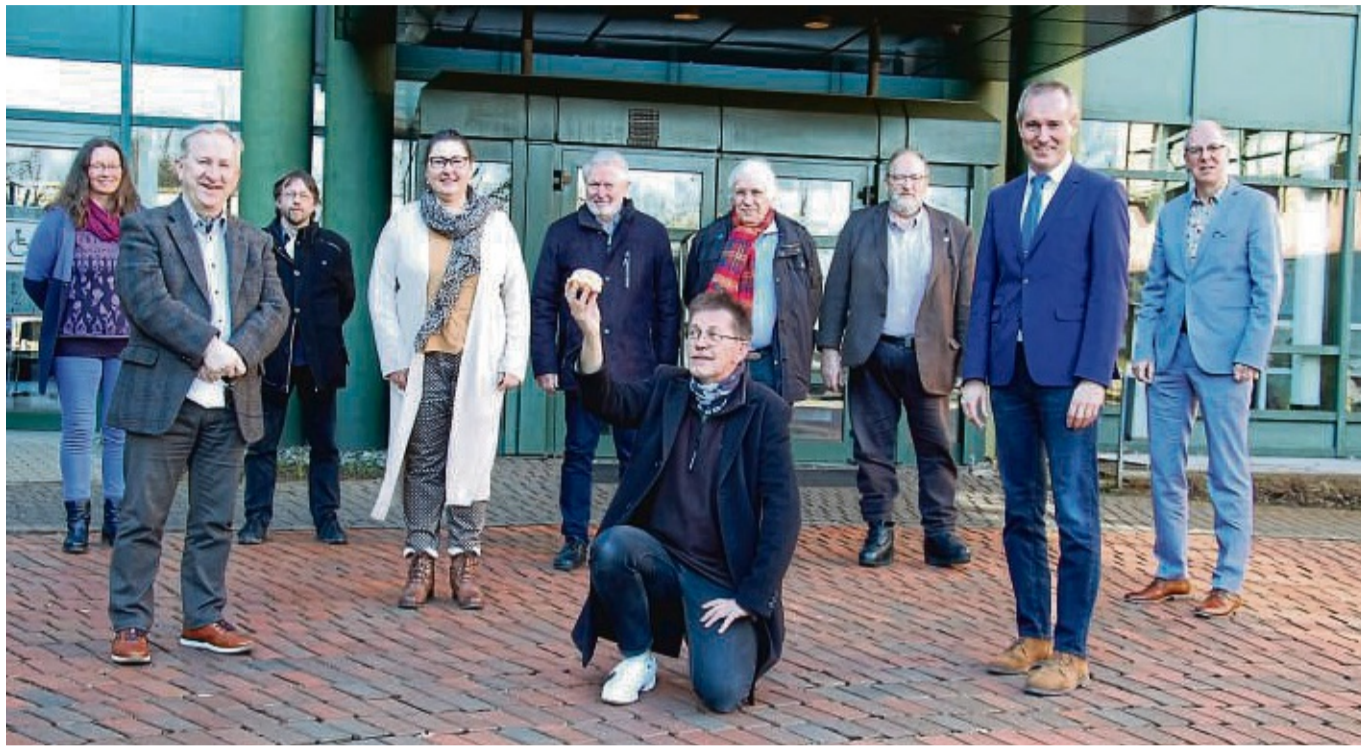
Das Programm steht: Das Kuratorium der Korbacher Theaterwoche legte im Kreishaus die teilnehmenden Gruppen fest und billigte den Spielplan. Vom 23. bis zum 28. Mai sind Aufführungen und die Werkstattarbeit geplant.

Ein Grund: Viele Gruppe hätten wegen der Auflagen zwei Jahre nicht arbeiten