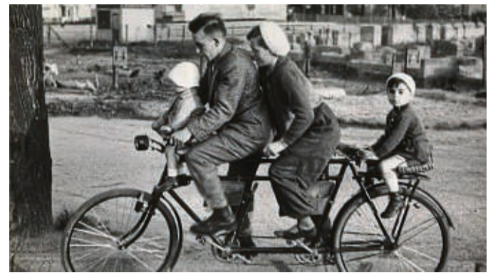
Familiendandem 1947 , Foto von Friedrich Seidenstücker aus der Sammlung der Stiftung Ann und Jürgen Wilde. COPYRIGHT: BAYERISCHE STAATSGEMÄLDESAMMLUNGEN, SIBYLLE FORSTER

Im Text zur Ausstellung heißt es: Friedrich Seidenstücker (1882-1966) zählt zu den bedeutenden Chronisten des Alltagslebens im Berlin der Weimarer Republik. Noch während seines Ingenieurs- und Bildhauereistudiums in Berlin beginnt er im Zoo zu fotografieren. Um 1923 erhält er vom Zoologischen Garten Berlin eine offizielle Fotografierlaubnis und ent-