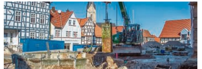
Der Kump vor dem Korbacher Rathaus wird Stück für Stück wieder aufgebaut.

Korbach – Für die Zeit der Bauarbeiten am Rathaus wurde der Kump abgebaut und eingelagert. Nun wurde er wieder aufgebaut. Es war nicht der erste Umzug des Kumps: Ursprünglich befand sich dieser gegenüber vor dem Haus Brack. Bei der Erweiterung des Rathauses Anfang der 1970er Jahre wurde er auf den neuen Rathausplatz veretzt. Es ist Tradition, dass die Teilnehmer des Festes in der Nacht von Schützenfestsonn-