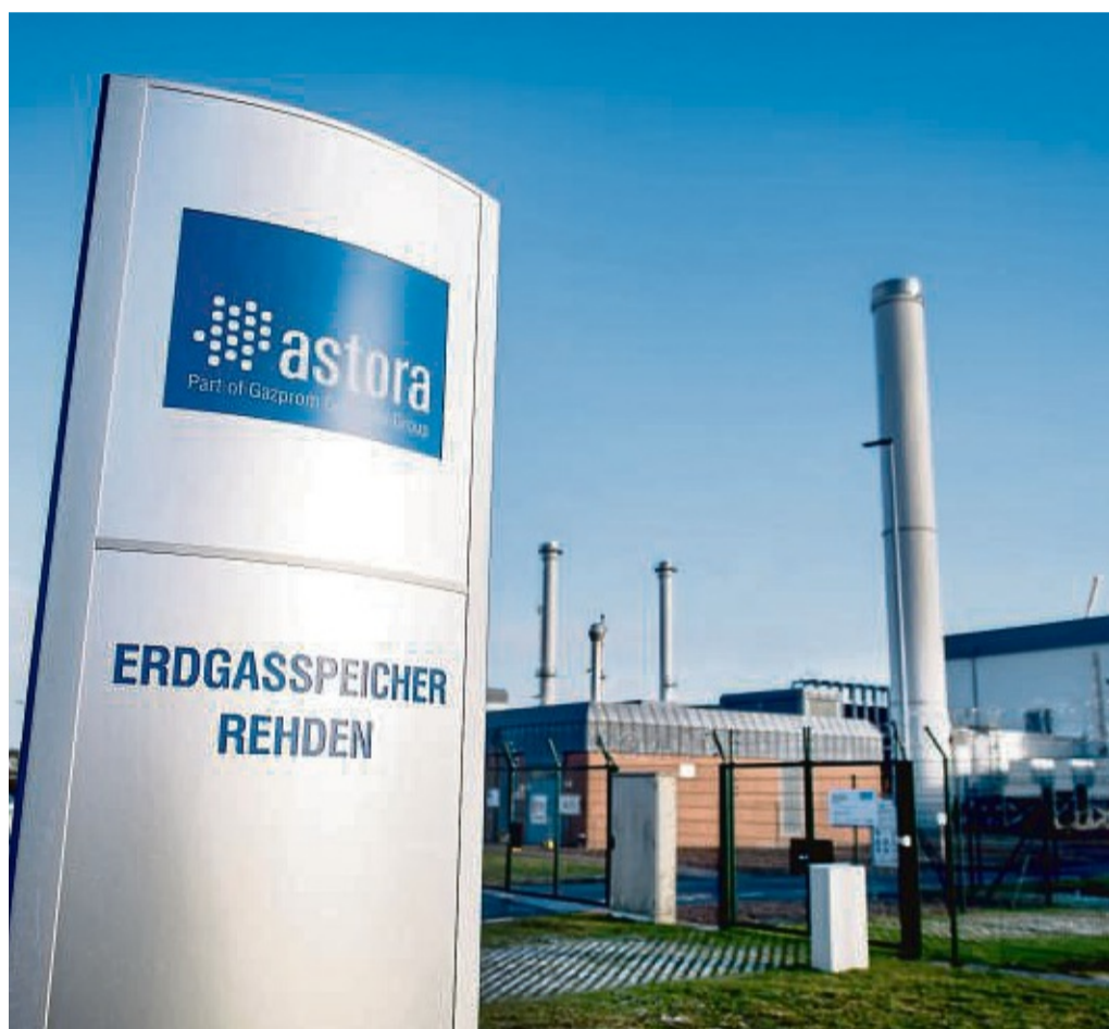
Kaum noch etwas drin: Den Gasspeicher in Rehden (Niedersachsen) hat Gazprom als Besitzer offensichtlich bewusst nicht aufgefüllt vor der Invasion Russlands in der Ukraine.

2015 verkaufte ihn BASF an den russischen Konzern Gazprom, der auch an den Gas-