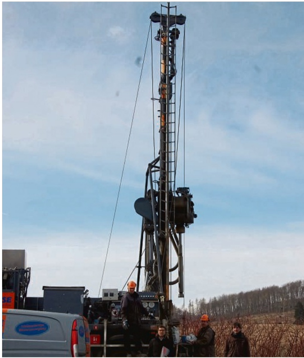
Brunnenbohren am Flechtendorfer Biogarten: In 50 Meter tiefe war das Grundwasser erreicht.

Der Bohrer samt Turm ist auf einem Lastwagen montiert. Peters führte Buch über die Schichten im Boden: