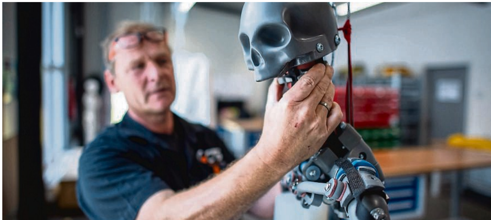
Sieht zwar nicht aus wie ein Mensch, kommt dem menschlichen Körperbau aber nahe: ein moderner Crashtest-Dummy der Firma CTS Crashtest Service.

Statt Verbindungen zwischen Körperteilen wie Bolzen-Gabelgelenke aus dem Maschinenbau schweben ihm Stempelgelenke wie beim Menschen vor. Eine we-