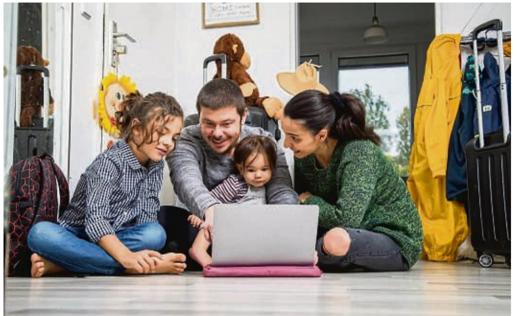
Faustregel für Familien: Am besten früh buchen und dabei auf Flex-Tarif und Kinderfestpreise achten.

Buchungstipps: So wird ihr Sommerurlaub möglichst günstig