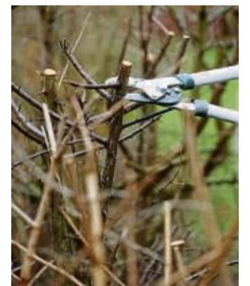
Der Nabu bittet darum, die Schonzeit beim Heckenschnitt einzuhalten.

men. „In diesem Zeitraum bieten Gebüsche einen optimalen Unterschlupf für Vögel, Säugetiere und Amphibien. Die Tiere ziehen dort ihren Nachwuchs groß, finden darin eine gute Versteckmöglichkeit und ziehen sich im frischen Grün auch mal zum Schlafen zurück“, so Eppler.