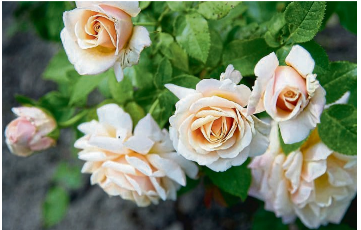
Der Schnitt im Frühling sichert langfristig eine prächtige Rosenblüte.

Rosen zur Forsythienblüte zurückschneiden