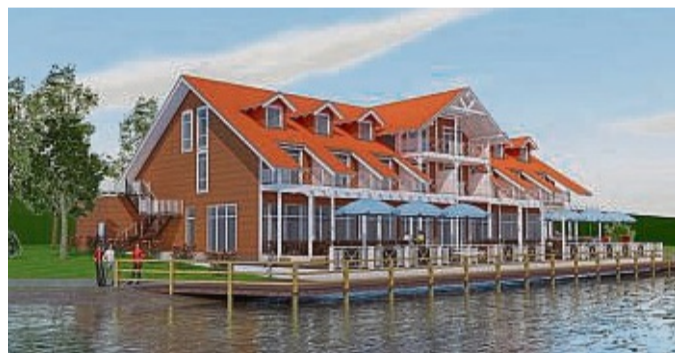
So könnte der Neubau aussehen, der den Imbiss am Strandbad ersetzen soll: Das Restaurant am Ufer des Diemelsees mit Appartements in den Obergeschossen.