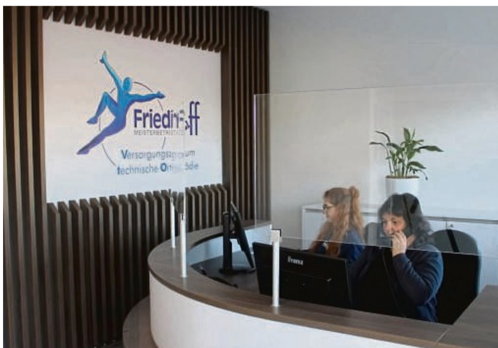
Empfangsbereit ist das neue Versorgungszentrum für technische Orthopädie in Korbach. Das Sanitätshaus Friedhoff bietet hier umfassende Leistungen gebündelt vor Ort.

Das angrenzende neue Hochregal-Lager mit 1.000 m² Grundfläche trägt zudem der permanent stei-