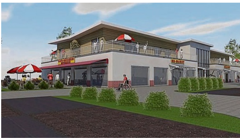
Der ersehnte Nahversorger auf dem Pack-Gelände soll zweigeschossig werden.