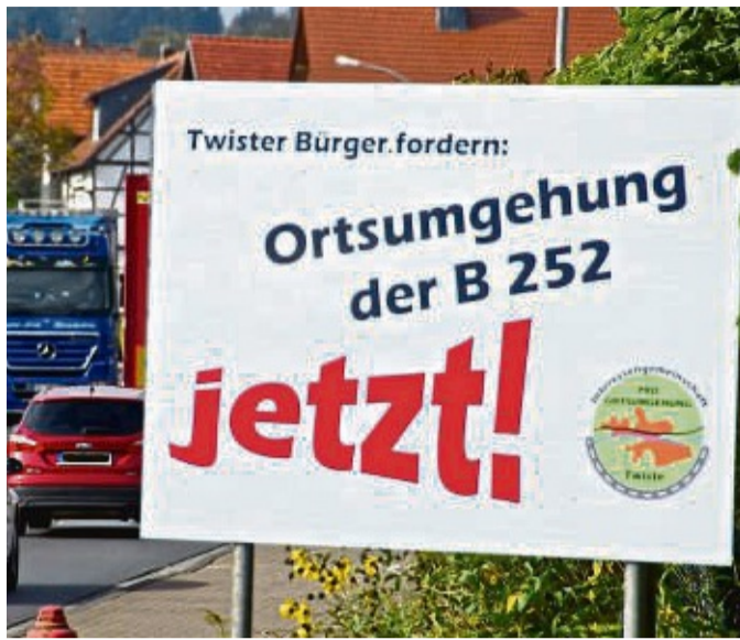
Hessen-Mobil stellt am 31. März und 1. April in öffentlichen Veranstaltungen in der Mehrzweckhalle die Pläne für die Ortsumgehung Twiste vor.

Eine Anmeldung mit Angabe eines Terminwunsches ist bis 28. März bei der Gemeindeverwaltung Twistetal unter Telefon 05695/9799-0 oder per E-Mail an info@twistetal.de erforderlich. Aufgrund der Corona-Schutzmaßnahmen erfolgt der Einlass nur nach vorheriger Anmeldung in begrenzten Gruppen, die dann jeweils et-