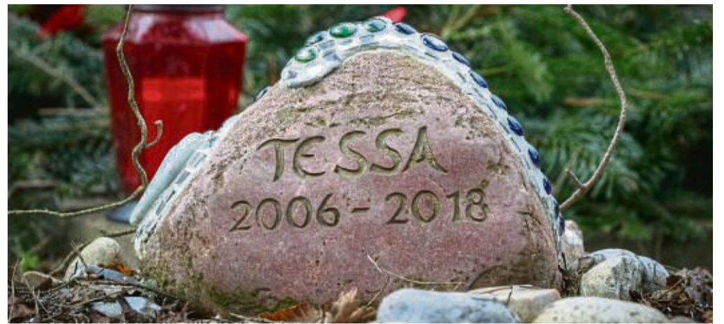
Trauern und das verstorbene Haustier: Das soll auf einem Tierfriedhof möglich sein. 17 Jahre nach einem Beschluss im Bad Wildunger Stadtparlament ist das Thema jetzt wieder aktuell.

„Durch die sehr vielen Haustiere in Bad Wildungen und den umliegenden Gemeinden Edertal und Bad Zwesten ist den Tierbesitzern eine Möglichkeit bereitzustellen, in angemessener Würde von ihrem geliebten Haustier Abschied zu nehmen und einen Ort zur Trauer vorzuhalten.“ Das nächstgelegene Tierkrematorium