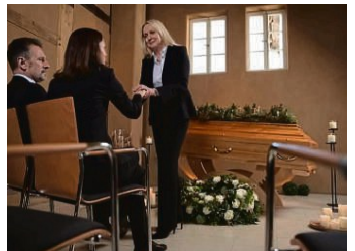
Für eine ehrliche und würdige Bestattung gibt es keine zweite Chance. Am besten lässt man sich schon zu Lebzeiten im Rahmen der Bestattungsvorsorge von ortsansässigen Bestattern gründlich beraten.

Da es für eine ehrliche und würdige Bestattung keine zweite Chance gibt, rät er auch zu einer Trauerfeier. „Auch wenn man sich mit dem Verstorbenen zu Leb-