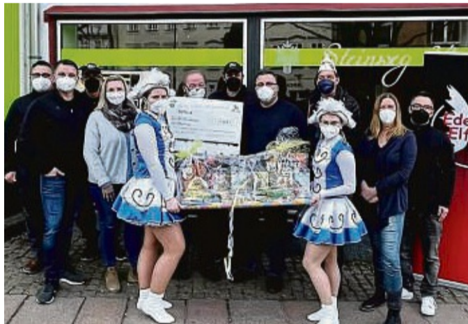
Ein symbolischer Scheck wurde von den Burgwaldnarren an die Elterninitiative leukämie- und tumorkrank Kinder übergeben.

Spendenkonten Elternverein Leukämie- und Tumorkrank Kinder Marburg: Sparkasse Marburg-Biedenkopf: IBAN DE28 5335 0000 1010 0049 81; Volksbank Mittelhessen: IBAN DE60 5139 0000 0076 2117 01