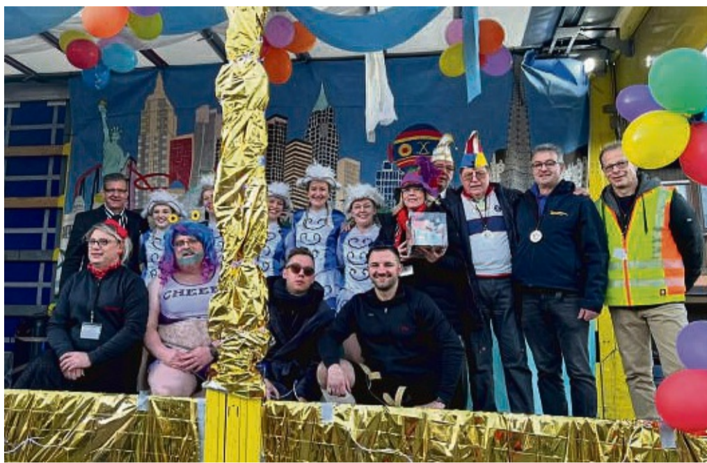
„Karneval to go“: Die Akteure der Burgwaldnarren, die am Karnevalswochenende auf der Lkw-Bühne das Programm gestalteten.

Die zwei Cent beruhen übrigens auf einer rührenden Geste beim letzten Auftritt in Ernsthäusern, wo ein älteres Ehepaar zusätzlich ihre beiden Glückscents spendete.