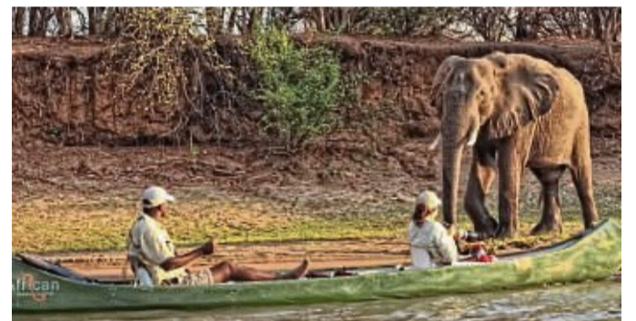
Bei einer Bootsfahrt auf dem Chobe kann man zahlreiche Elefanten aus nächster Nähe erleben.

Antik 26.+27.3. Flohmarkt Hann. Münden Weserpark ab 7 Uhr, keine Neuware, Aktuelle Corona-Regel beachten