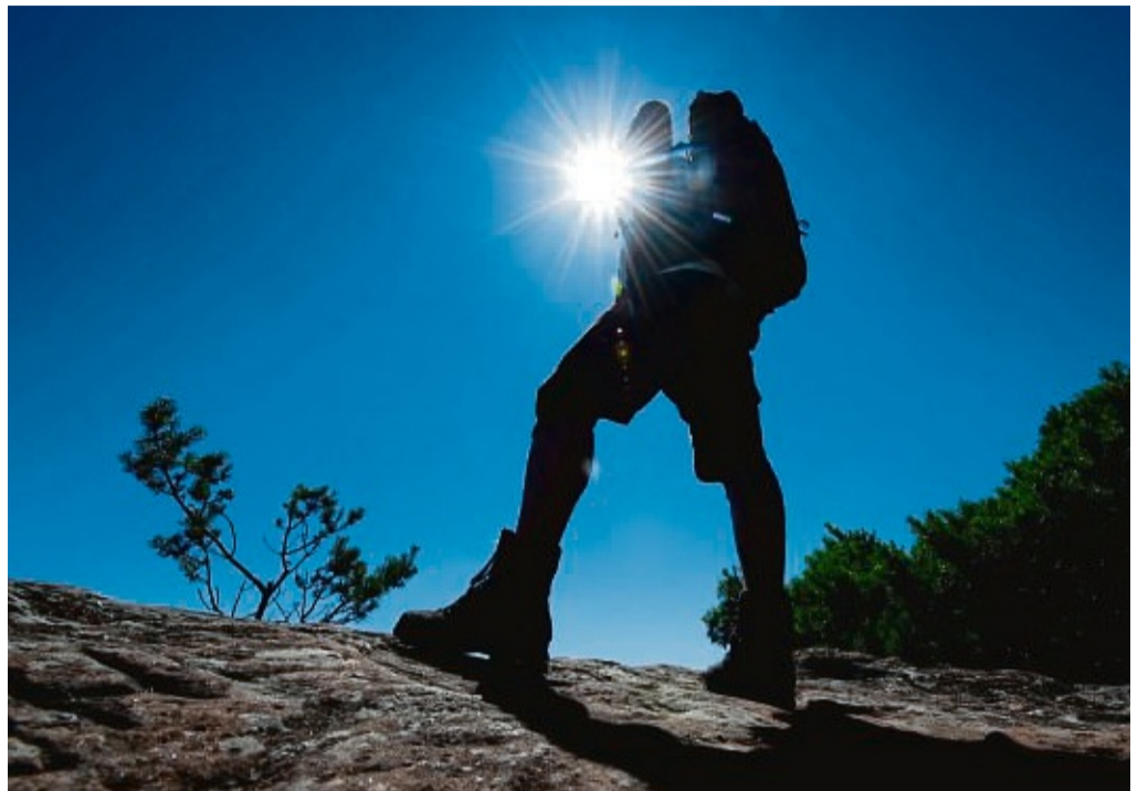
In den Bergen ankommen und am nächsten Tag loswandern? Wer von einer Herzschwäche betroffen ist, sollte das besser nicht tun.

Viele Herzmedikamente machen die Haut empfindlicher gegenüber der Sonnenstrahlung. Betroffene sollten also an einen starken Sonnenschutz denken, ratsam ist ein Lichtschutzfaktor höher als 30. Zudem sollten Herzpatientinnen und -patienten genug trinken. Denn: Viele Herzmedikamente wirken ent-