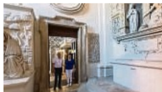
Die ökumenische Tür verbindet die Basilika St. Vitus mit der Evangelischen Stadtkirche.

Über 1250 Jahre Geschichte haben die vom stolzen Schloss überragte Stadt Ellwangen geprägt und ein besonderes Ambiente geschaffen. Gäste können dort viele Kunst- und Bauschätze entdecken. Eines der kulturellen Highlights Ellwagens ist das Alamannenmuseum, das wichtige archäologische Originalfunde aus ganz Süddeutschland beherbergt. Bis zum 18. September lädt die Sonderausstellung „Ein kleines Dorf in einer großen Welt – Alltagsszenen des 5. und 6. Jahrhunderts“ zu einer spannenden Entdeckungsreise in die Welt des frühen Mit-