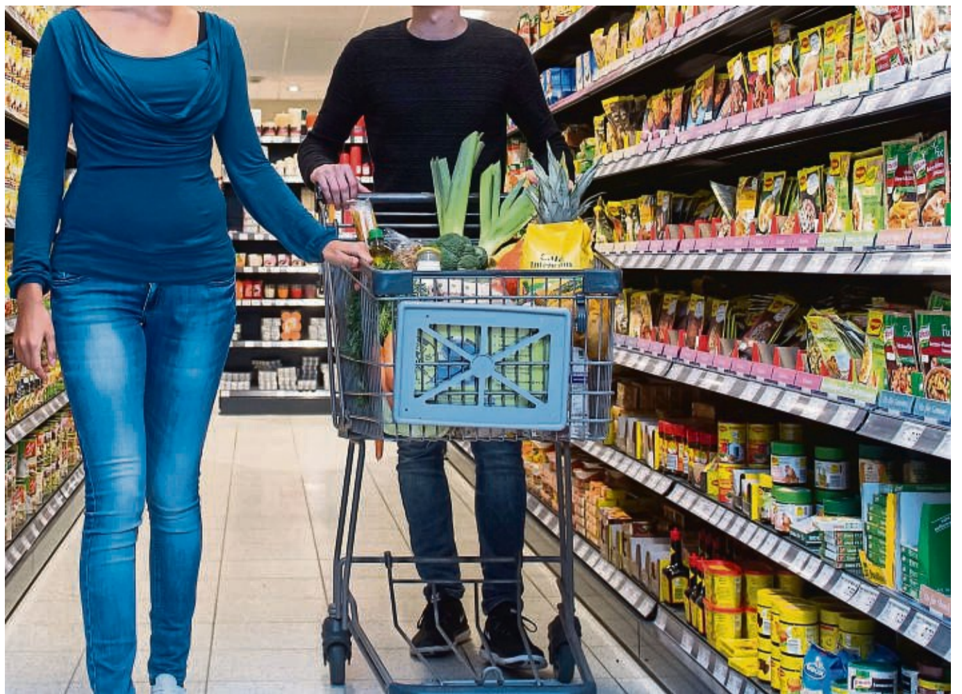
Der Wagen voll, der Geldbeutel leer: Wer beim Einkaufen einige Dinge beachtet, kann Geld sparen.

Kissen | Decken | Bettwäsche | Topper Sleepwear | Zubehör | Beratung