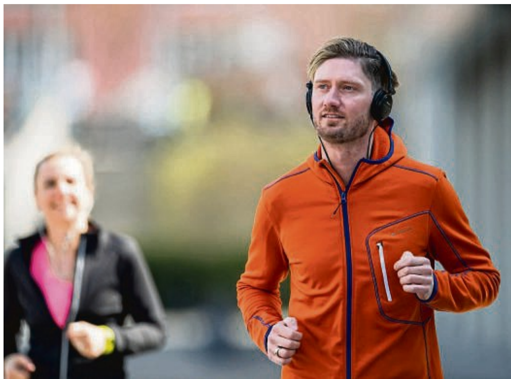
Der persönliche Laufstil ist sehr individuell - ein pauschales „Richtig“ oder „Falsch“ gibt es dabei nicht.

Der Laufstil kann aber Einfluss auf die Schuhwahl haben, so Weber. So bräuchten etwa Fersnläufer – das seien die meisten Menschen – „aus der Erfahrung heraus“ gut gedämpfte Schuhe. Fersnläufer setzen mit der Ferse zuerst auf und rollen mit dem ganzen Fuß ab. Es gibt noch zwei weitere Lauftypen: Mittelfuß- und Vorfußläufer. Webers Rat für Laufanfänger ist der Besuch eines Fachgeschäftes. Die Beratung dort