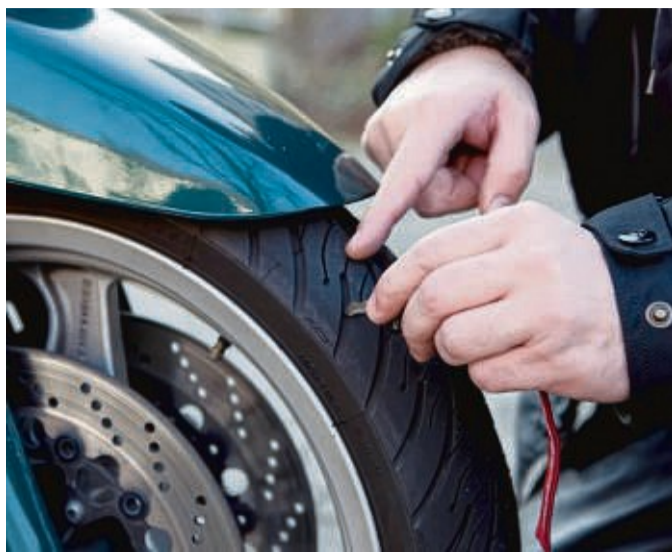
Genug Gummi? Zum Technikcheck vor dem Motorradfrühling gehört auch ein Blick auf die Reifen.

In der Regel sollten spätestens bei zwei Millimetern neue Reifen ans Motorrad. Das sorgt für mehr Grip, vor allem im Regen. Es gibt Reifenmodelle mit Verschleißanzeige, das sind kleine Stege in den Rillen. Zuverlässiger ist es aber, das Profil händisch selbst mit einem analogen oder digitalen Messdorn zu messen.