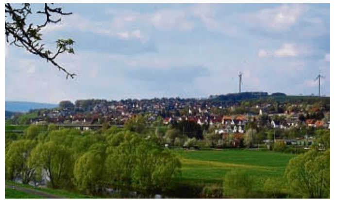
Körle will attraktiver werden.

Es wird Getränke und einen Imbiss bei der Konzeptvorstellung am 29. März geben, teilt die Gemeinde weiter mit. Das ISEK ist Grundlage für das Städtebauförderungsprogramm „Lebendige Zentren“, in das die Gemeinde Körle im Dezem-