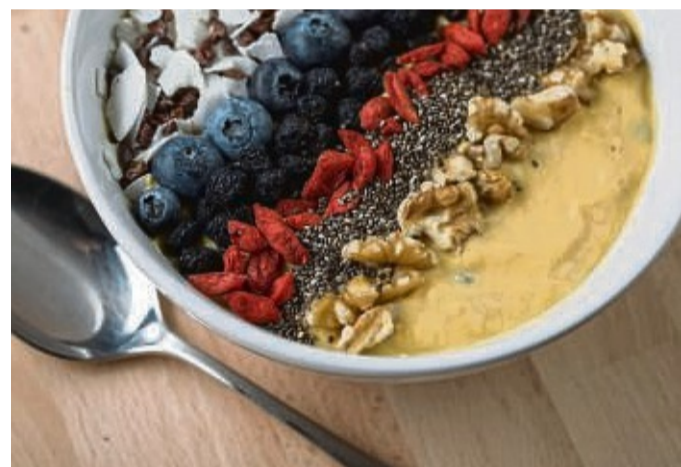
Ob selbstgemixt oder mit Pulver angerührt: Smoothie Bowls werden oft mit Obst dekoriert.

Wichtig: Sind alle Ventilkappen vorhanden, intakt und sitzen sie fest? Sie schützen nicht nur vor Dreck, sondern können auch Druckverluste beim Fahren verhindern. tmn