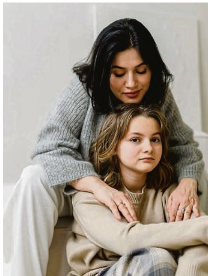
Zu behütet? Manchmal können die Ängste der Eltern das Erwachsenwerden der Kinder erschweren.

Die Studienberatung an der TU München bietet auch Inforeveranstaltungen für Eltern – aber nicht mit dem Ziel, dass Mutter und Vater dann ihren Kindern die Entscheidung