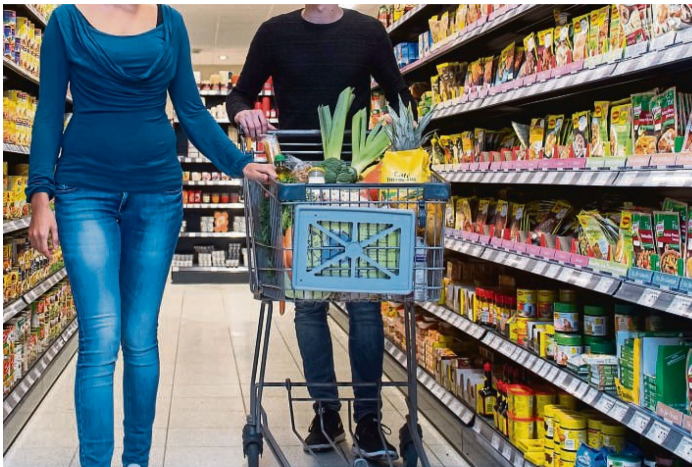
Der Wagen voll, der Geldbeutel leer: Wer beim Einkaufen einige Dinge beachtet, kann Geld sparen.

Häufig sind Produkte unterschiedlicher Packungsgrößen schwierig zu vergleichen. Wie viel günstiger ist