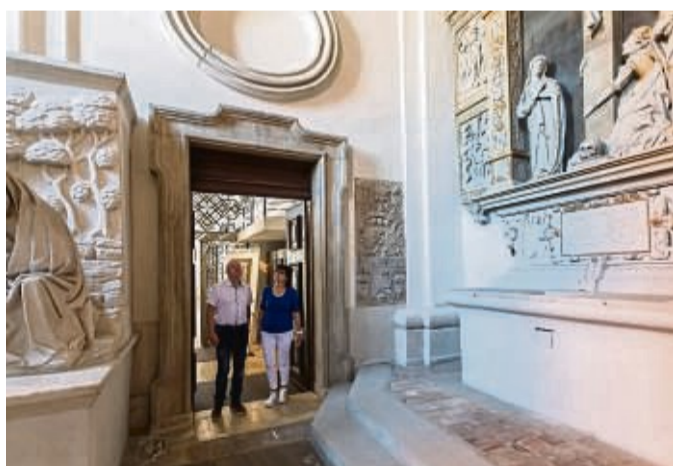
Die ökumenische Tür verbindet die Basilika St. Vitus mit der Evangelischen Stadtkirche.

Jeder Urlaub bringt eigene Herausforderungen mit sich – denn Klima, medizinische Versorgung vor Ort und Reisedauer können je nach Reiseziel ganz unterschiedlich sein. Um einen individuellen Plan zu entwickeln, rät Janicke zu einer reisemedizinischen Untersuchung sowie einer Reiseberatung.