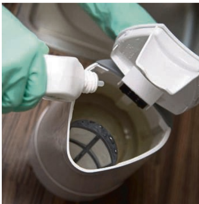
Natürlich wirksam und biologisch abbaubar: Zitronensäurelösung eignet sich zum Beispiel zum Entkalken des Wasserkochers.

Wo Zitronensäure zum Putzen taugt – und wo nicht