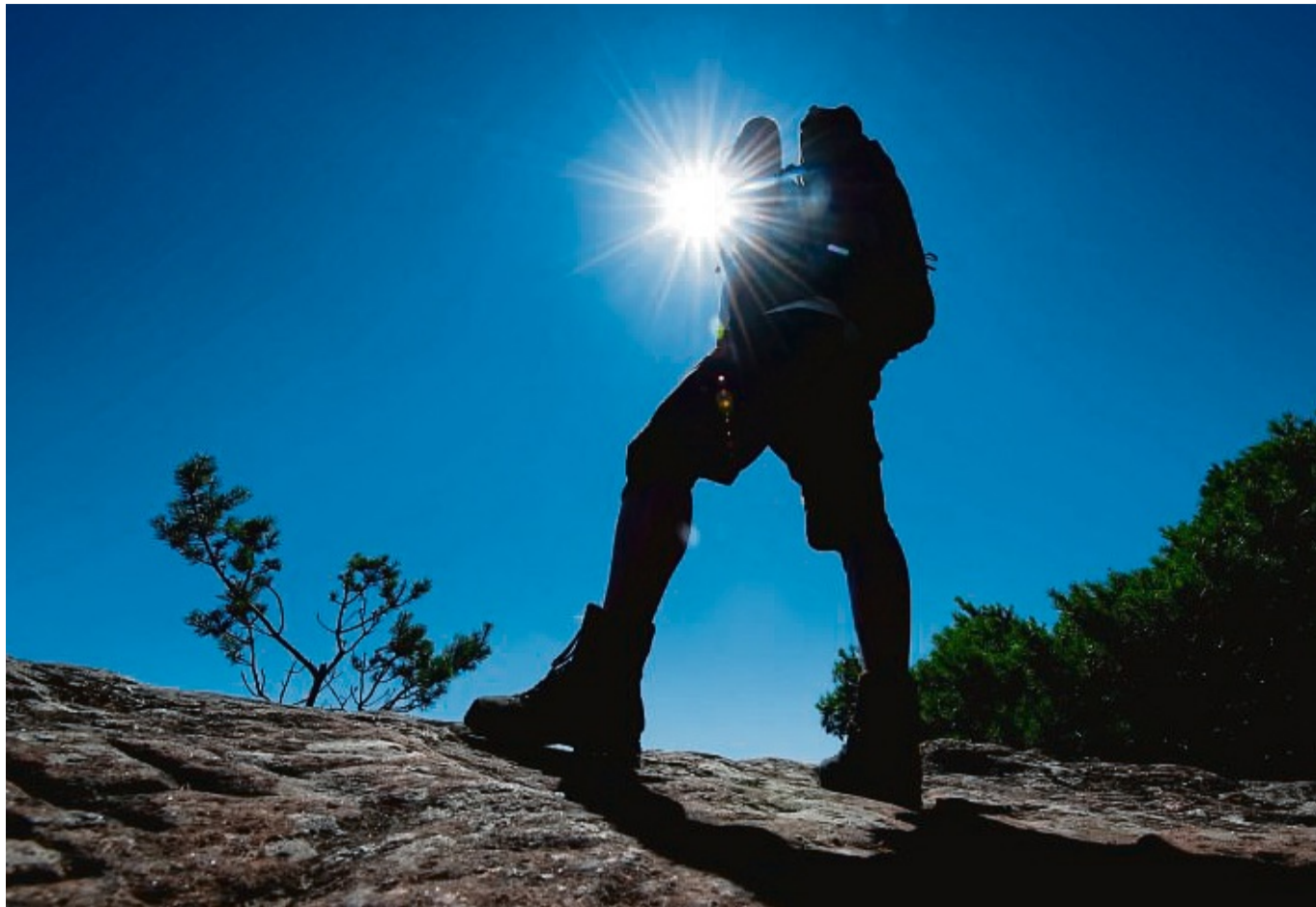
In den Bergen ankommen und am nächsten Tag loswandern? Wer von einer Herzschwäche betroffen ist, sollte das besser nicht tun.