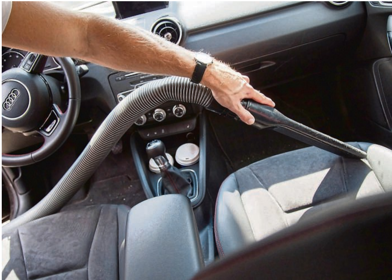
Sauber bis in die Ritzen: Der Staubsauger sollte gründlich Gelegenheit bekommen, Staub und losen Schmutz einzufangen.

Bevor es in die Waschstraße geht, wird der grobe Schmutz mit einer gründlichen Handwäsche oder in der Waschbox mit dem Hochdruckreiniger entfernt. Dabei nicht die Radkästen und Felgen vergessen. Der ACE rät dabei zu mindestens 30 Zentimetern Abstand, um Schäden am Lack zu vermeiden.