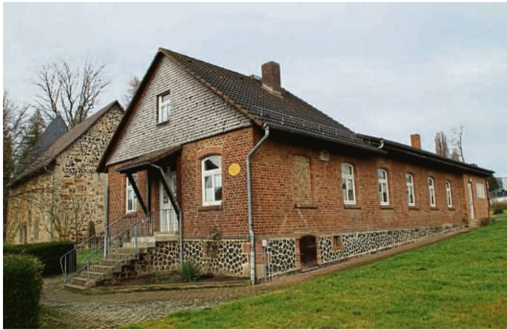
Mögliche Option: Das Grundstück des Frieda-Kerl-Hauses in Felsberg könnte nach Ansicht von Ortsvorsteher Klaus Döll eine Option für einen neuen Kindergarten sein.