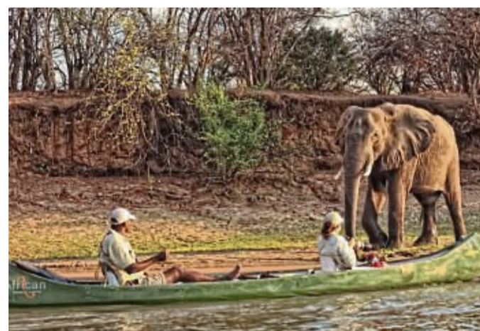
Bei einer Bootsfahrt auf dem Chobe kann man zahlreiche Elefanten aus nächster Nähe erleben.