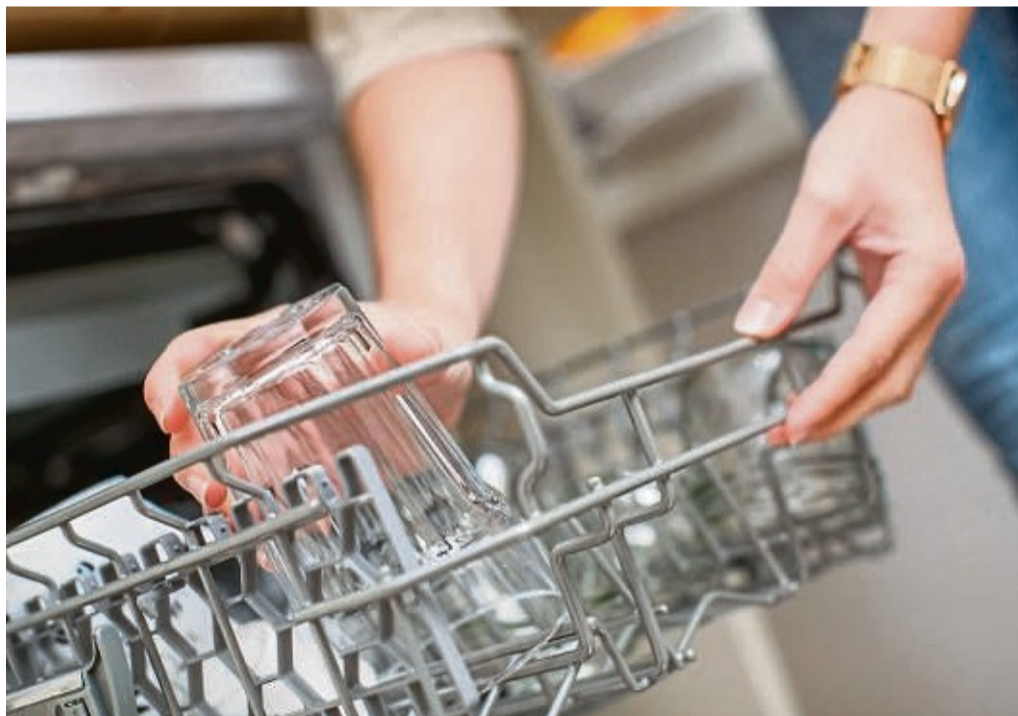
Regeniersalz nachfüllen oder Klarspüler nutzen: Mit nur wenigen Handgriffen bleiben Gläser in der Spülmaschine glänzend.