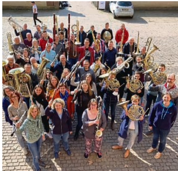
Freuen sich auf die Veranstaltungen: Die Musiker der Bläserphilharmonie Osthessen.