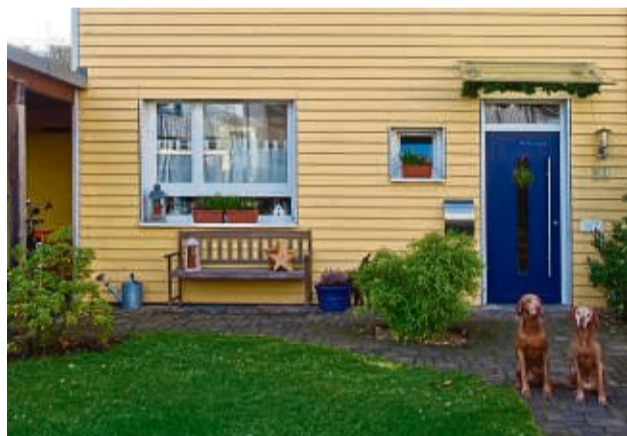
Holzfassaden vermitteln Behaglichkeit und fördern ein gesundes Raumklima.

PEFC und FSC für Transparenz. Unter www.holzvom-fach.de gibt es dazu mehr Informationen sowie weitere Tipps zum nachhaltigen und klimaschonenden Bauen. djd