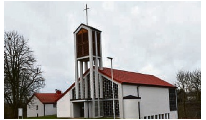
Katholische Kirche in Sontra: Hier findet am Sonntag um 10.45 Uhr die Messe statt.