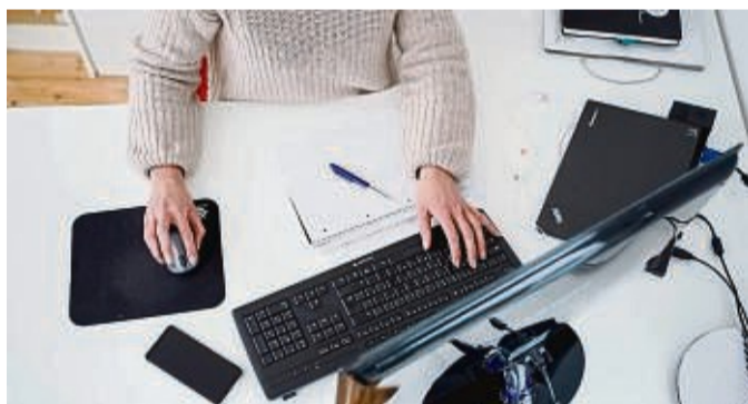
Schließt man einen externen Monitor und eine Tastatur an den Laptop an, kann das eine echte Entlastung für Nacken und Rücken sein.

Noch immer arbeiten viele Menschen im Homeoffice, oft am Laptop. Das führt zu einer krummen Sitzhaltung. Dabei kann die Ausrichtung des Bildschirms viel bewirken.