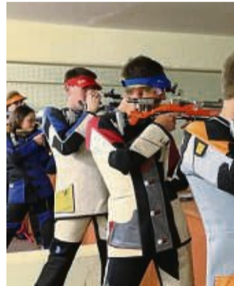
Beliebter Sport: Schützen beim Üben.