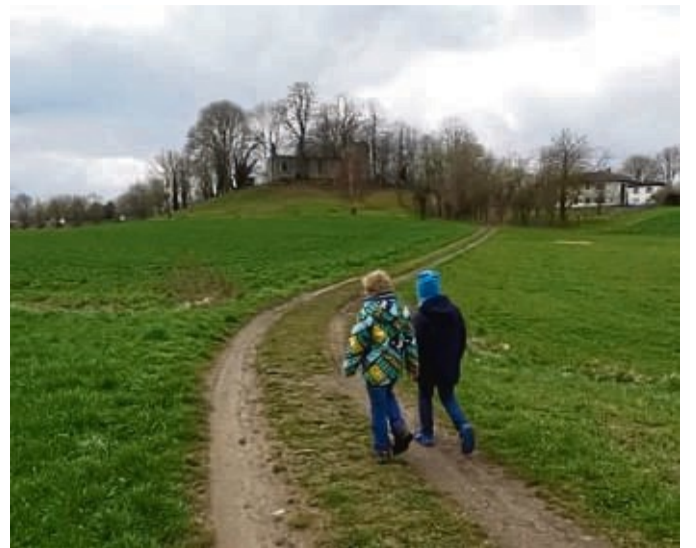
Hike and Bike: Kinder entdecken bei Rätseltouren den Werra-Meißner-Kreis.

Die Startpunkte der Routen sind in Bad Sooden-Allendorf (Bike), Hessisch Lichtenau (Bike), Sontra (Hike-Wandern) und Waldkappel (Hike). Die Touren sind laut der Mitteilung so angelegt, dass sie jeweils in zwei bis drei Stunden absolviert werden können. Zum Spielen werden neben Wanderschuhen oder Fahrrad noch ein Smartphone benötigt, da die Touren über eine kostenfreie App gespielt werden. Die Teilnahme ist kostenlos. Nach der Anmeldung erhalten die Teilnehmenden ei-