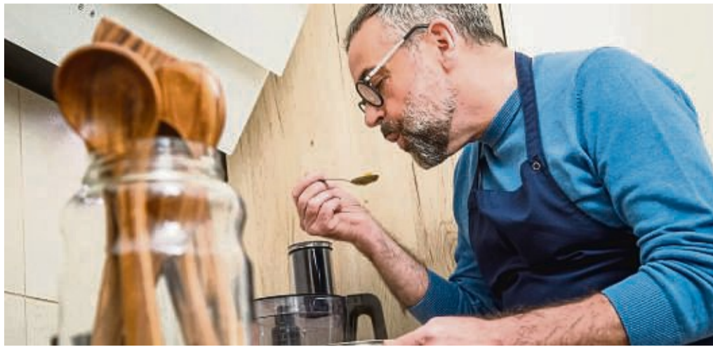
Wer sich nach der Paleo-Diät ernährt, kocht viel frisch. Fertiggerichte sind tabu.

Wer sich „Paleo“ ernährt, isst wie unsere Vorfahren in der Steinzeit. Hält die Ernährung von Fred Feuerstein so fit, dass wir auch heute – zumindest theoretisch – ein Mammot erlegen könnten?