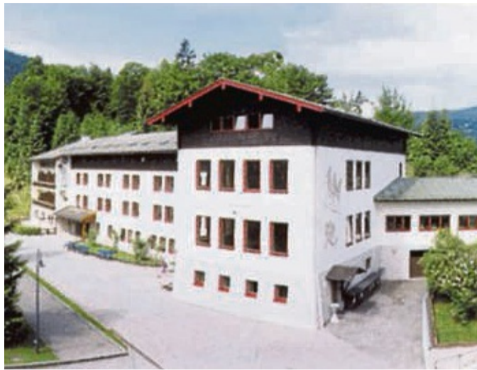
Das Hotel Buchenhaus in Schönau am Königssee können Interessierte besuchen.

Der Reisepreis beinhaltet: Unterkunft (alle Zimmer mit Dusche und WC ausgestattet), Frühstücksbuffet mit Lunchpaket, warmes Abendessen, An- und Abreise mit dem Reisebus, Kurtaxe sowie Programmgestaltung im Haus, eine Busrundfahrt im Berchtesgadener Land und die Reisebegleitung. Der Einstiegsort ist Melsungen, Busbahnhof. Bei Inanspruchnahme eines Mehrbettzimmers