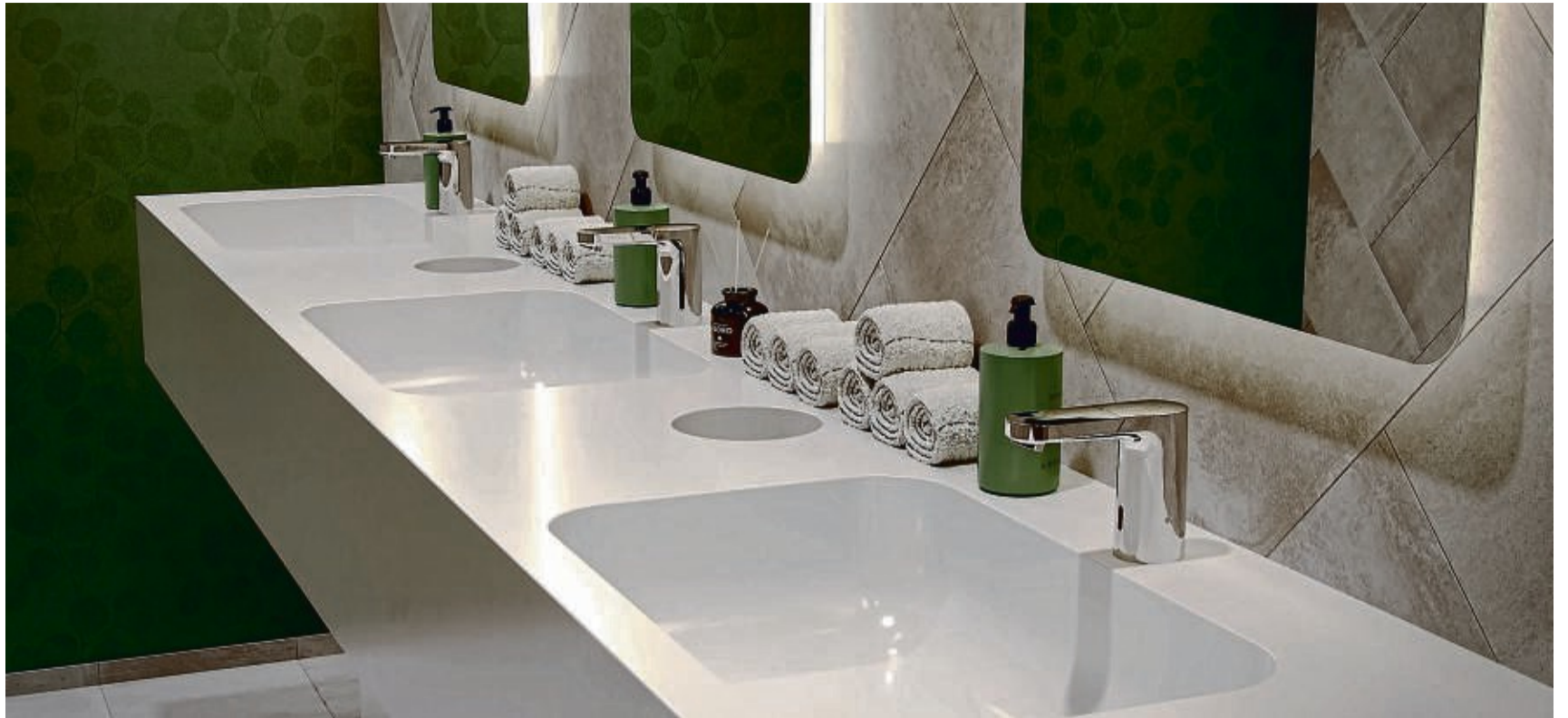
Kontaktlose Armaturen sind vor allem an hochfrequentierten Waschplätzen sinnvoll.