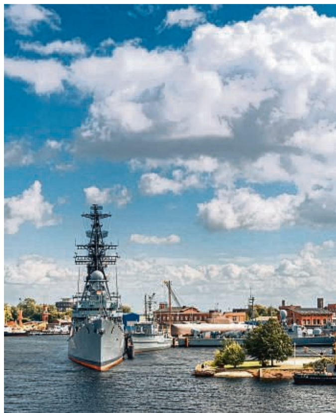
Eine Hafenundfahrt zeigt den Marinehafen und den Jade-WeserPort aus.