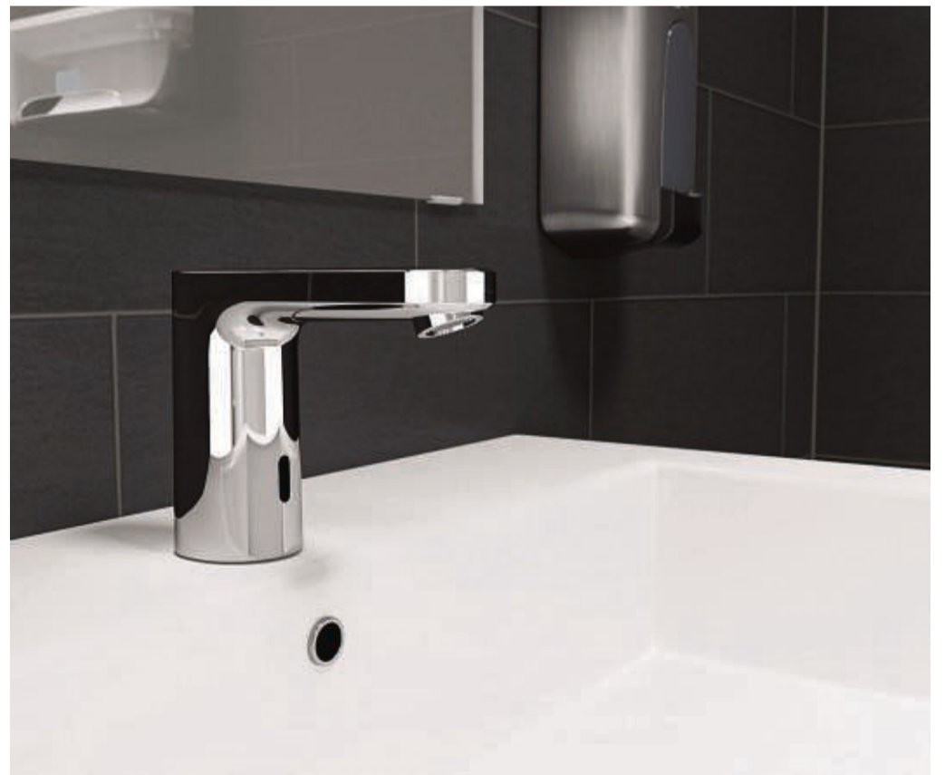
Die Gesundheit im Fokus: Auch in privaten Räumen werden kontaktlose Armaturenlösungen immer beliebter.