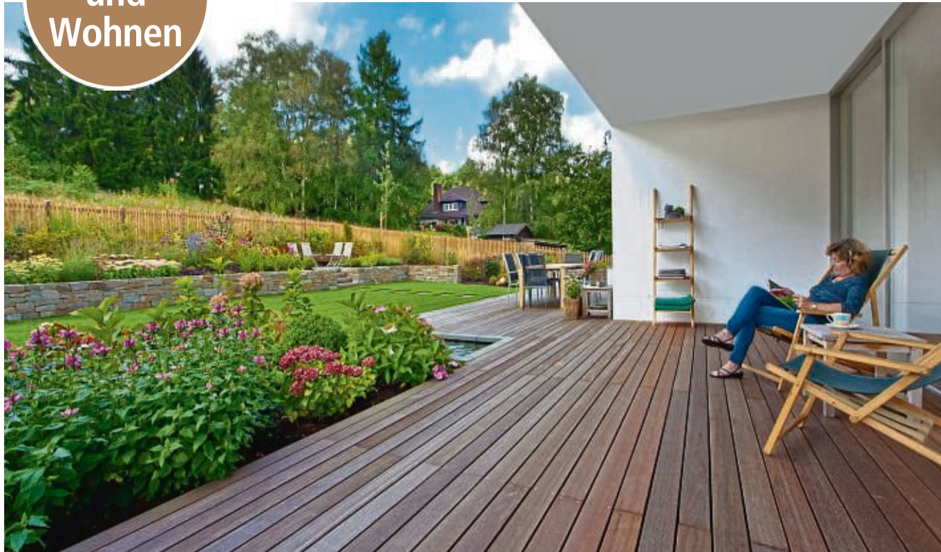
Vom Terrassenboden über gemütliche Sessel bis zur Grundstücksbegrenzung: Das natürliche Baumaterial Holz macht im Garten immer eine gute Figur.