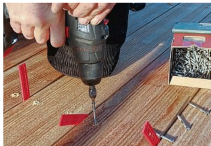
Die fachgerechte Ausführung stellt sicher, dass der neue Terrassenbelag aus Holz lange Freude bereitet.

Eine Holzhütte zum Abstellen der Gartengeräte und des Rasenmähers darf ebenso wenig fehlen wie ein Sandkasten oder Spielturn für den Nachwuchs. Im Handel gibt es dazu wahlweise Konstruktionsholz oder fertige Produkte und Bausätze, die sich unkompliziert montieren lassen.