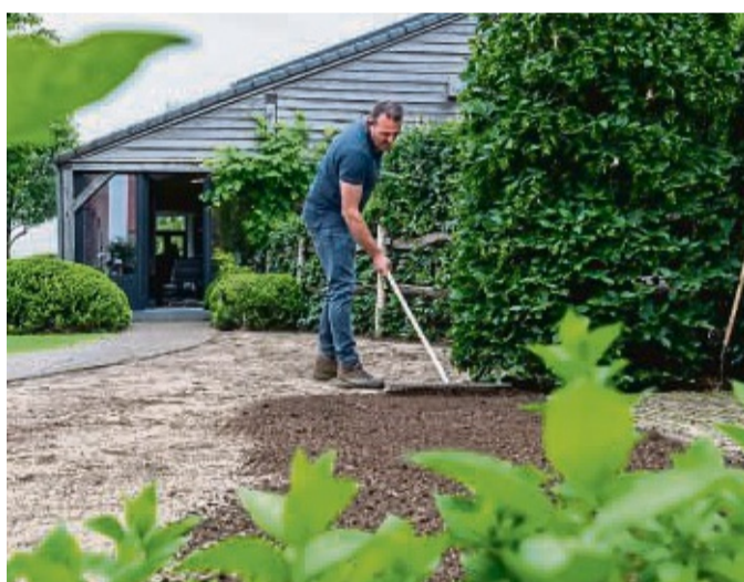
Die Grundlage für einen gepflegten Rasen schafft man bereits mit der Auswahl der geeigneten Saatmischungen.

Der Klimawandel ist ein Faktor, der sich sichtbar auf Rasenflächen auswirkt und deren Pflege wesentlich beeinflusst. Ein hochwertiges Saatgut soll nicht nur eine hohe Reinheit und Keimfähigkeit aufweisen, sondern hat heute weitere Anforderungen wie Strapazierfähigkeit, Hitzeresistenz und eine gute Widerstandsfähigkeit gegenüber Rasenkrankheiten zu erfüllen. Ein nützlicher Qualitätsindikator für Gartenbesitzer ist es, wenn das Saatgut nach internatio-