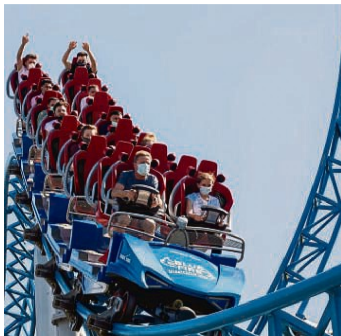
Achterbahnen wie die „Blue Fire“ warten: Ab Samstag (26. März) geht es im Europa-Park Rust wieder rund.

Mit dem Panoramaturm wird es eine bekannte Landmarke weniger geben. In der drehenden Gondel konnten Besucherinnen und Besucher den Park aus luftiger Höhe bestaunen. Nach 2019 war der 104 Meter hohe Turm schon außer Betrieb, vor kurzem wurde mit dem Abbau begonnen. Der Heide-Park Soltau liegt im Dreieck zwi-