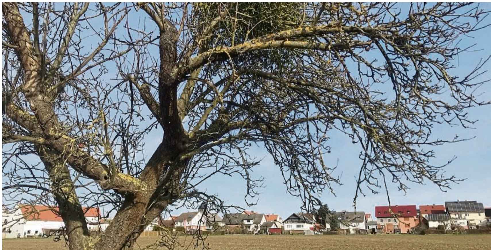
Mistel trotz Wind und Wetter auf einem alten Apfelbaum. Für Bäume ist das Gewächs aber nicht ungefährlich.

Halbschmarotzer breitet sich aus – Experte empfiehlt Schnitt