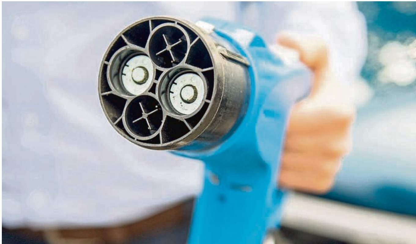
Neue Geldquelle anzapfen? Für E-Auto-Besitzer gibt es da seit Beginn des Jahres durchaus eine neue Möglichkeit.

Durch den Ankauf von eingespartem CO 2 in Form dieser Verschmutzungsrechte können Konzerne Strafzahlungen entgehen. Bislang konnten betroffene Mineralölunternehmen Emissionszertifikate im Verkehrssektor