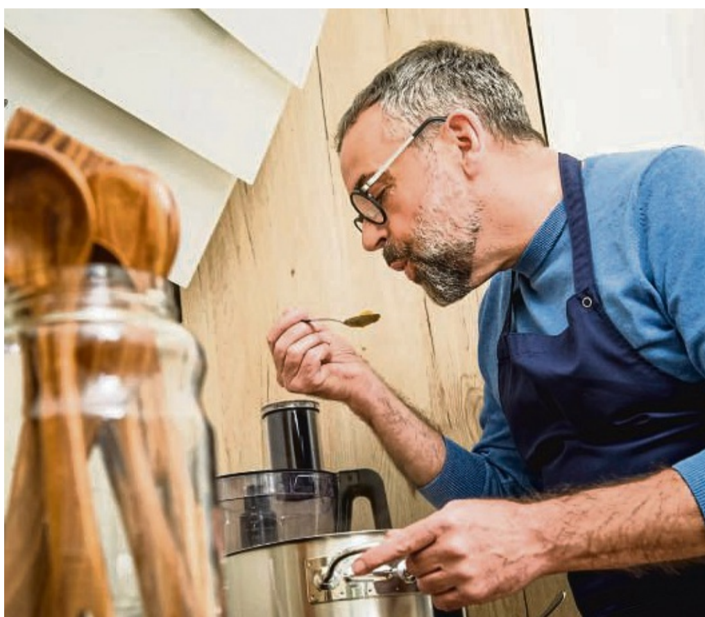
Wer sich nach der Paleo-Diät ernährt, kocht viel frisch. Fertiggerichte sind tabu.