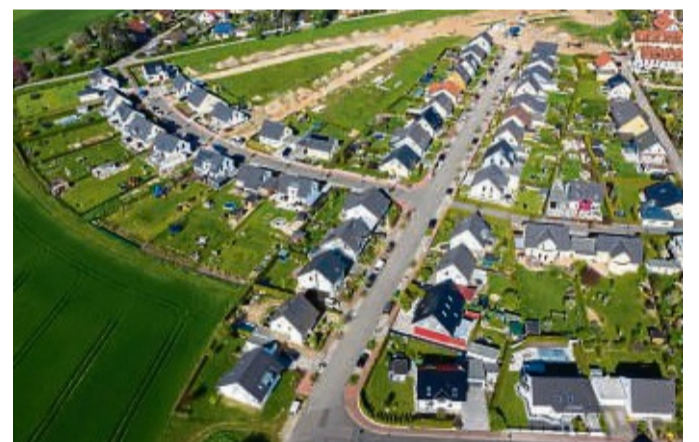
Daten frühzeitig sammeln: 2025 tritt die Reform der Grundsteuer in Kraft.

Wer die Wohnfläche wegen einer Veränderung nicht mit Stand Jahresbeginn 2022 parat hat, muss im Zweifel messen. Was genau zur Wohnfläche zählt und was nicht, regeln die Länder teilweise unterschiedlich. Über konkrete Bestimmungen gibt wieder die zuständige Grundsteuer-Finanzverwaltung Auskunft. Sind dann alle Daten zusammen, müssen sie