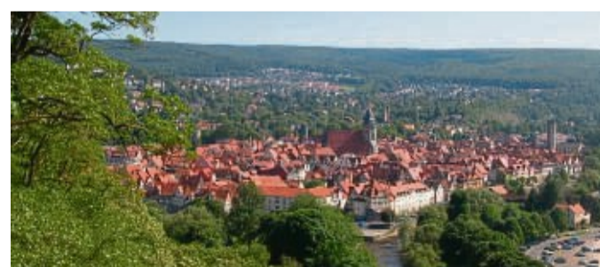
Die Stadt ist von Wald umgeben. Hier der Blick von der Weserliedanlage.

Informationen zum Wettbewerb gibt es unter naturparkfotos.de . zpy