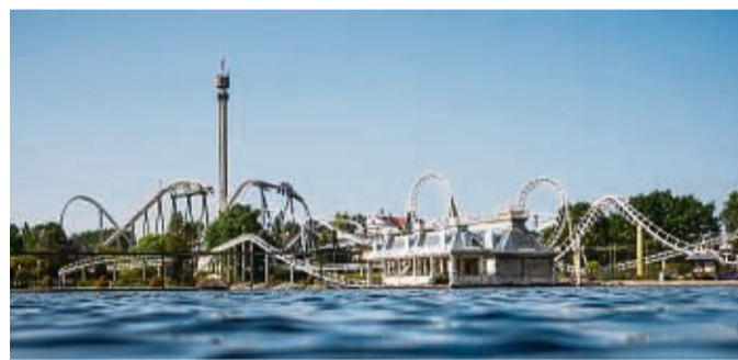
Der Heide-Park Soltau startet ab 2. April in die Sommersaison.

Neben bekannten Attraktionen wie der Huracan-Achterbahn sollen 2022 nach pandemiebedingten Ausfällen in den Jahren davor auch wieder mehr Shows auf dem