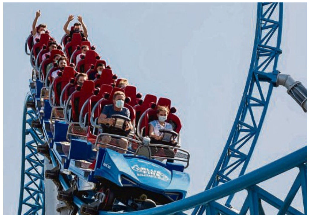
Achterbahnen wie die „Blue Fire“ warten: Ab Samstag (26. März) geht es im Europa-Park Rust wieder rund.

Programm stehen. Es seien neue geplant, heißt es aus dem Freizeitpark. Belantis liegt direkt an der Autobahn A38.