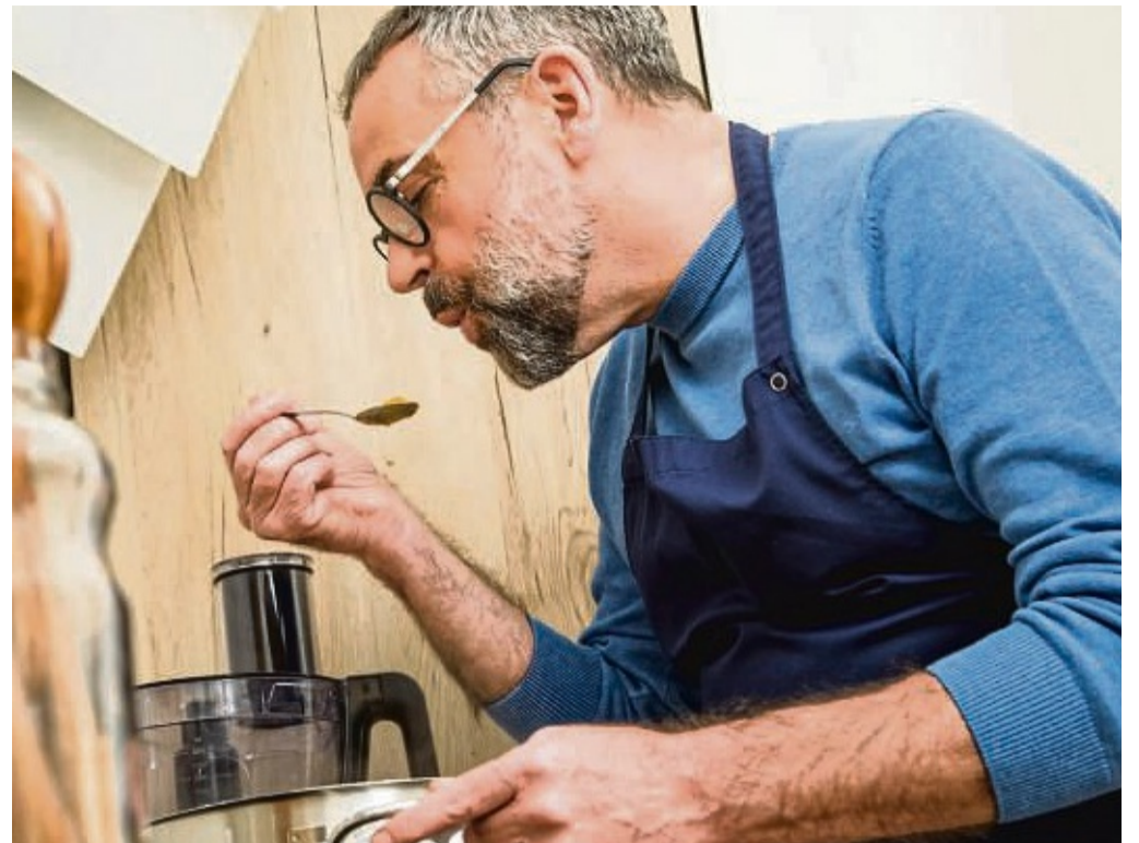
Wer sich nach der Paleo-Diät ernährt, kocht viel frisch. Fertiggerichte sind tabu.