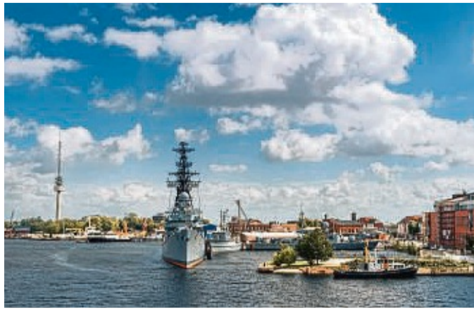
Eine Hafenrundfahrt zeigt den Marinehafen und den Jade-WeserPort aus.