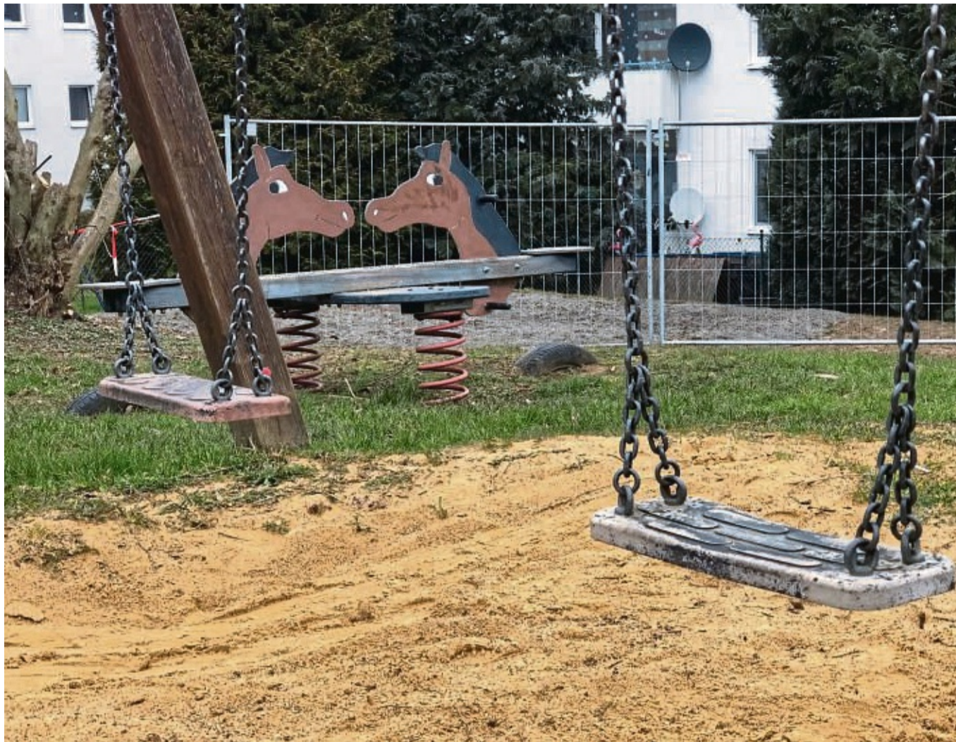
Der TÜV hatte eine Spielkombination bemängelt: Deshalb hat die Stadt das Spielgerät am Jasminweg in Wolfhagen entfernt und einen Bauzaun aufgestellt, der das Gelände vom Platz mit den funktionstüchtigen Geräten abtrennt.

Dann allerdings tauchte Anfang des Jahres das Problem mit den fehlerhaften Jahresabschlüssen für die Jahre 2014 bis 2019 auf. Solange die Mängel nicht behoben sind, kann der Haushalt, der