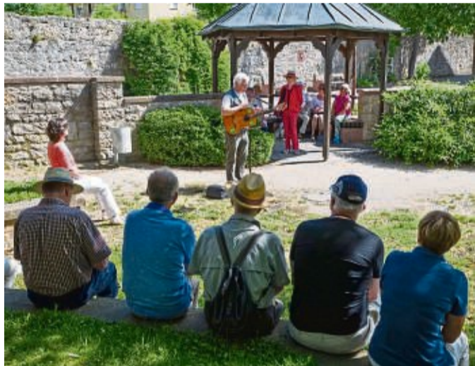
Das schöne Karlstadt lässt sich am besten bei einer Stadtführung entdecken.

tron die Stadt geprägt hat. Auf der „Maritimen Meile“ liegen Erlebniswelten für die ganze Familie: das Küstenmuseum, das Unesco-Weltnaturerbe Wattenmeer Besucherzentrum, das Marinemuseum und das Aquarium Wilhelmshaven. Und gleich hinter dem Deich lädt das Welterbe Containermeer zu Strandtagen ein. Unter www.wilhelmshaven-touristik.de lässt sich das Magazin „Havenkante“ bestellen oder herunterladen.