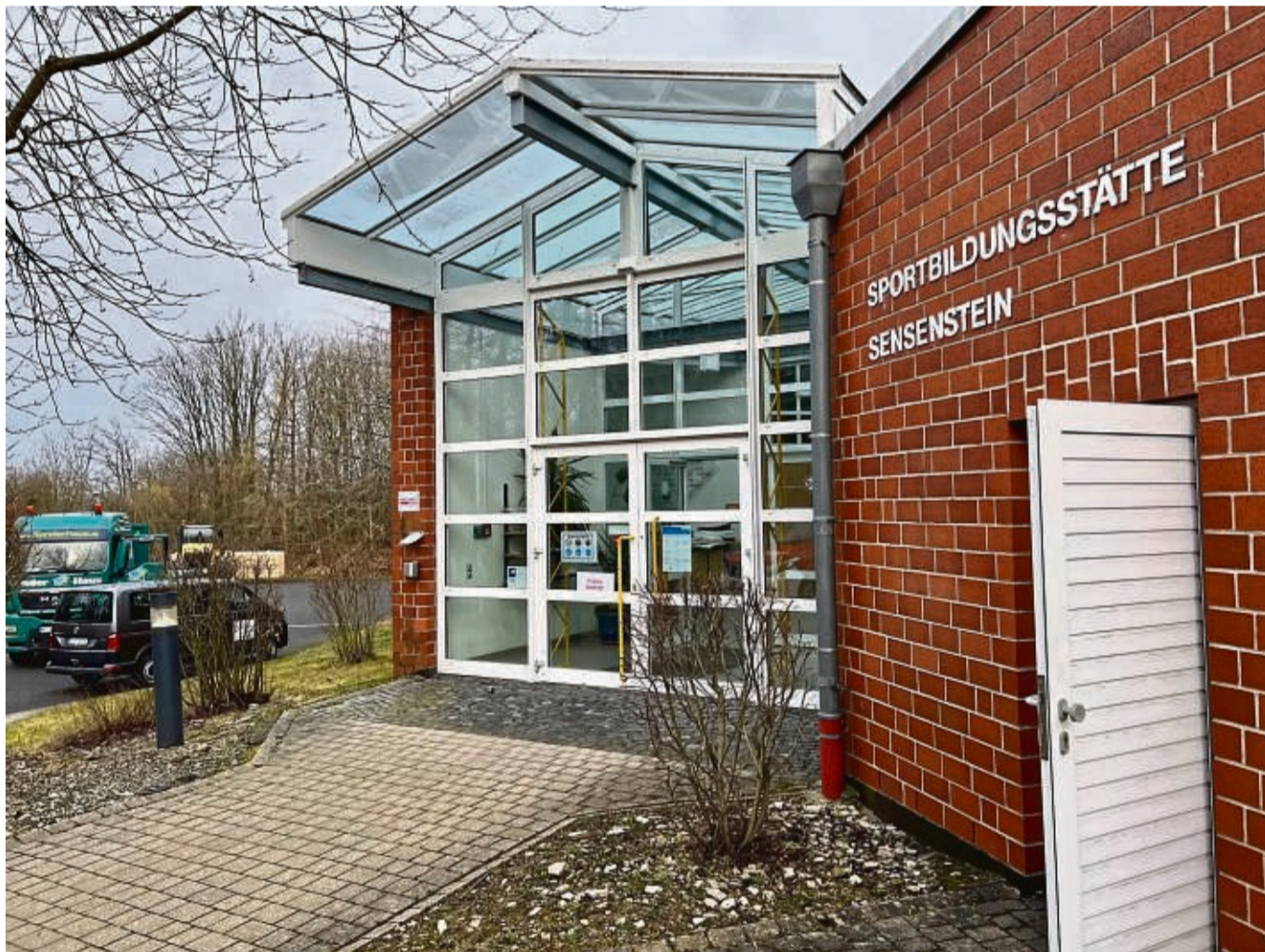
Wurde bereits als Notunterkunft vorbereitet: Die Sporthalle auf dem Sensenstein bietet vorübergehend Platz für bis zu 288 Menschen, etwa 150 weitere Plätze gibt es in den regulären Unterkünften. Allerdings sollen die Geflüchteten so schnell wie möglich in Wohnungen oder Gemeinschaftsunterkünften wechseln.

„Auch das Angebot einer freien Couch hilft langfristig