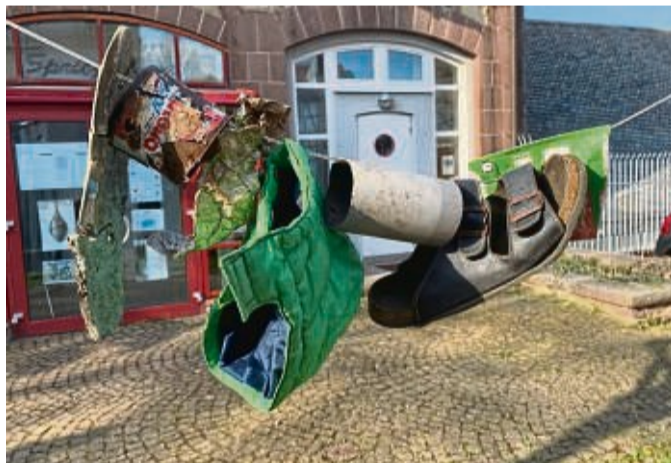
Eine „Girlande der Schande“ von #einfachBUECKEN auf dem Kirchplatz soll das Problem des achtlos weggeworfenen Mülls nochmal verdeutlichen.

„KOMPASS“. Die dazugehörige Umfrage ergab, dass mehr Sauberkeit in der Stadt ein zentrales Anliegen in der Bevölkerung sei. „Wenn das Umfeld gepflegt und sauber ist, fühlen sich die Menschen wohler und sicherer“, fasst die KOMPASS-Verantwortliche im Ordnungsamt zusammen. Das Arbeiten an der Grundidee für die Anti-Müll-Aktionswoche trafen dabei zusammen mit gleich gelagertem Engagement aus der Stadtgesellschaft heraus. Dafür beispielhaft stehen die Aktivitäten von „einfachBUECKEN“, der