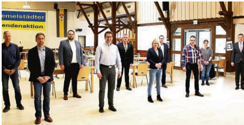
Die Ortsvorsteher, Ortsbeiräte und örtlichen Feuerwehren unterstützen den Spendenaufruf von Bürgermeister Elmar Schröder für die Ukrainehilfe.