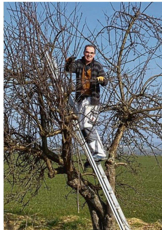
Obstbaumpflege des Ortsbeirats Wethen.