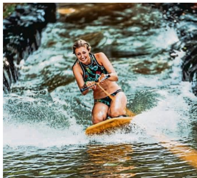
Im Wasserskigraben geht es durchs kühle Nass.

Dort gibt es auch weitere Infos zu Künstlern und Eventmodulen, zum Zeltplatz und zu Parkmöglichkeiten. Und