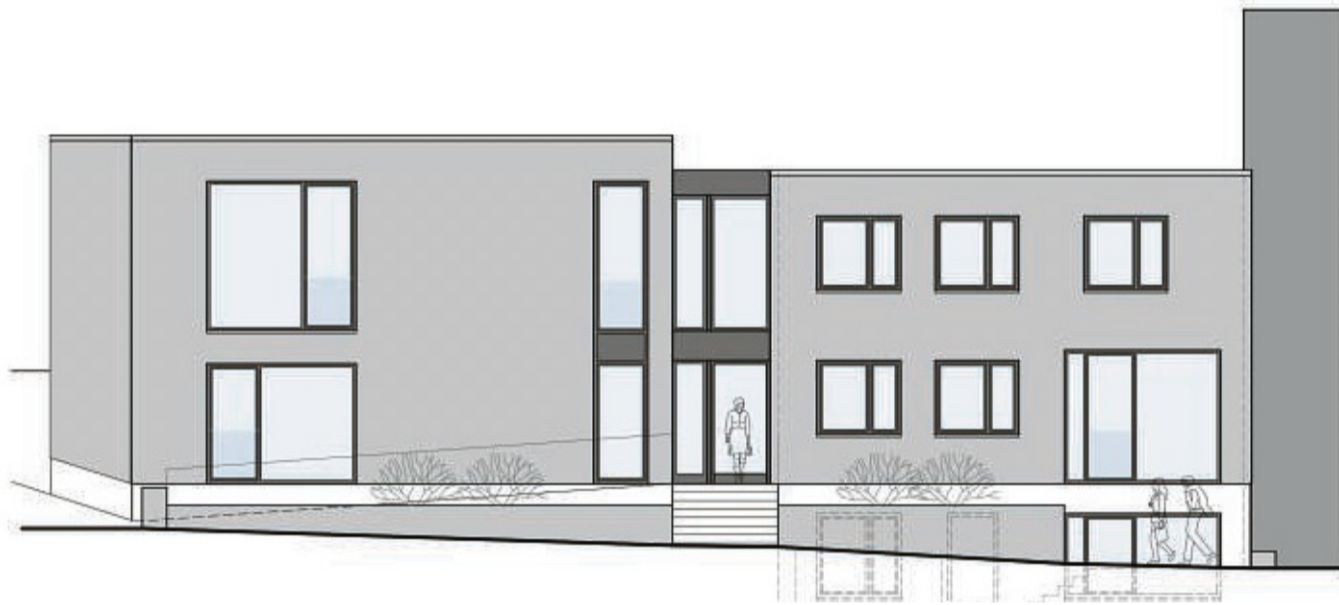
Zweistöckig und teilunterkellert: So soll das neue Gebäude neben der Sparkasse vom Nordwall aus aussehen.