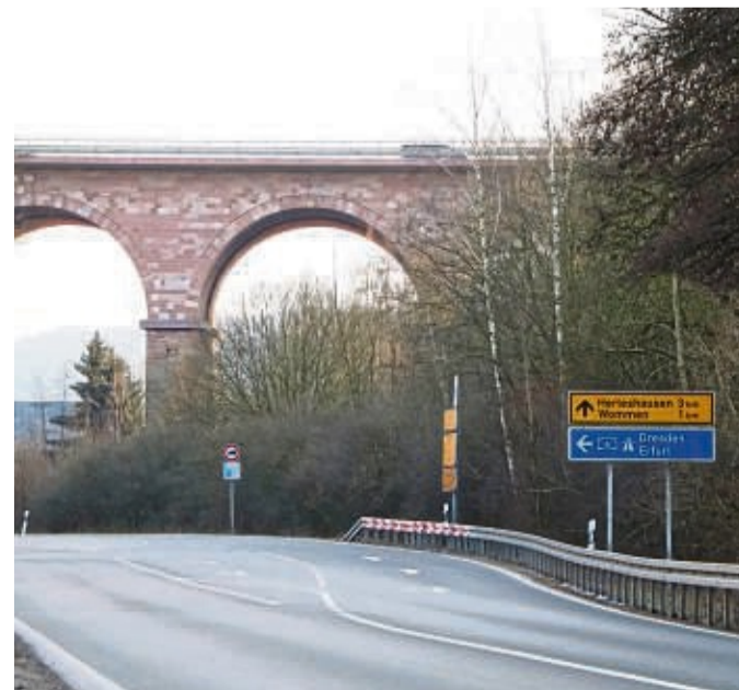
Die A4-Anschlussstelle bei Wommen soll geschlossen werden: Das fordert der Ortsbeirat Unhausen.

☎ (0561) 92094-100 oder -101 www.top-direkt.de