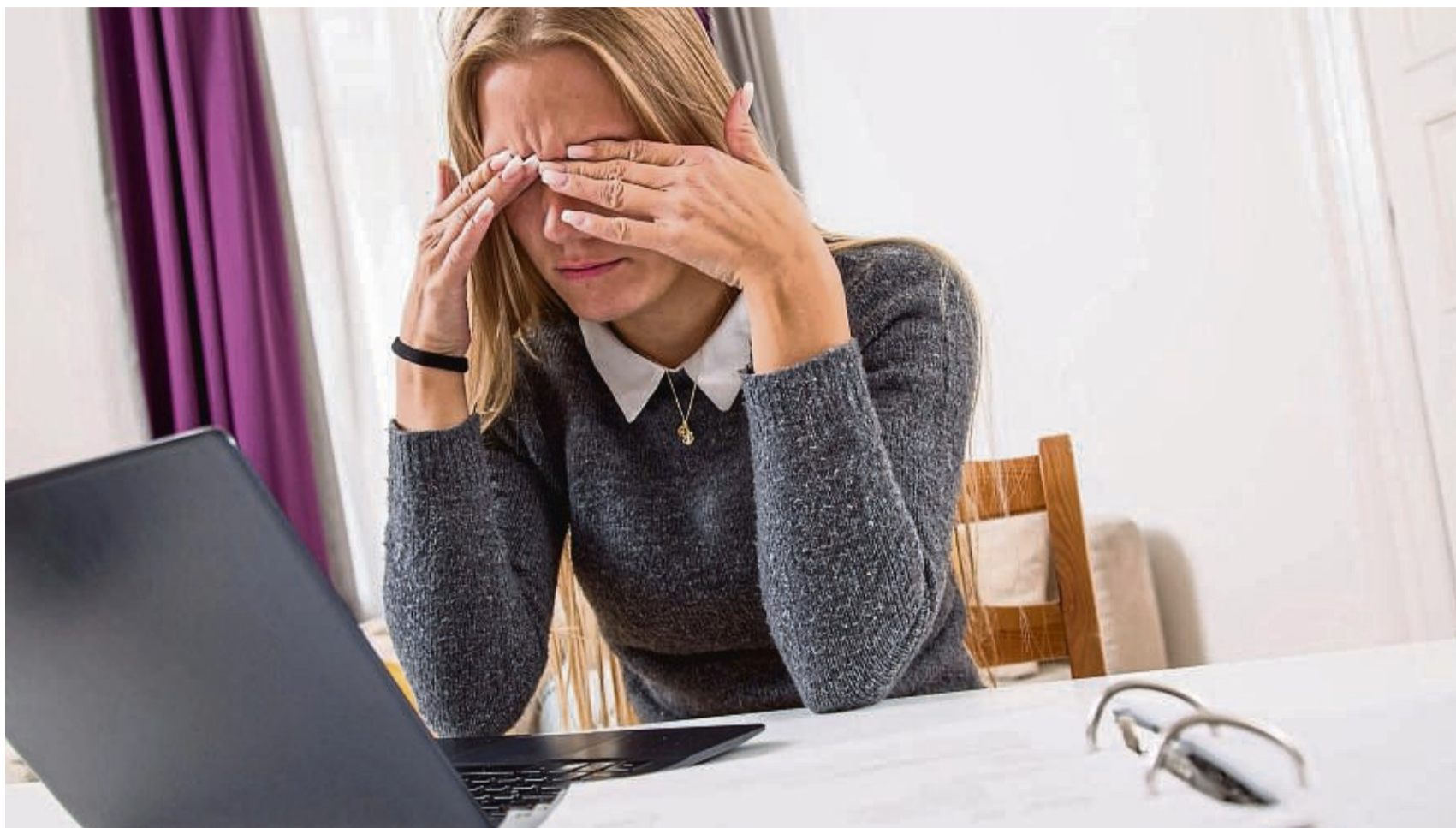
Gerade Frauen sind im Beruf oft zu selbstkritisch – dann sind Gegenmaßnahmen nötig.