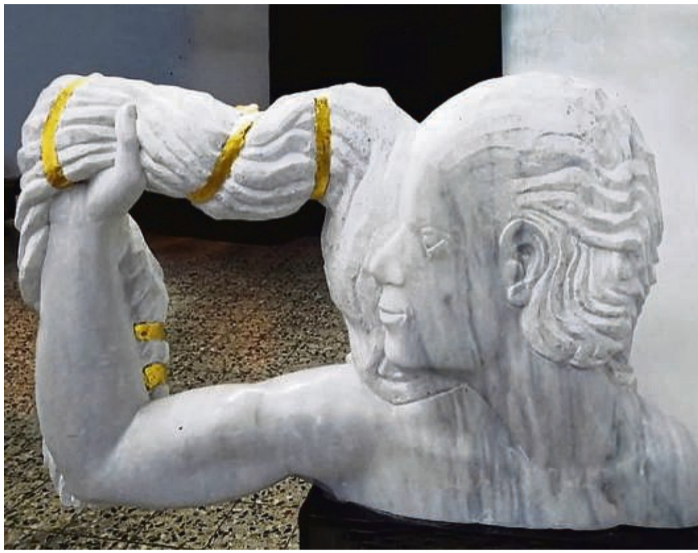
Nach zwei Jahren Pause: Neue Ausstellung hat im Eschweger Hochzeitshaus eröffnet.

Die Bilder des Künstlers Norbert Städele aus Fuldatal zeigen eigentümlich angeordnete Steine, die Strich für Strich mit Farbstift geschaffen wurden. Die Motive sind immer wieder in neuen Situationen zu sehen. „Hier steht