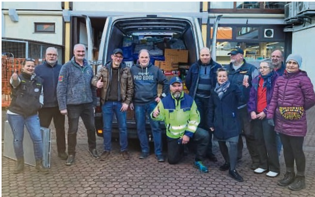
Transportierte Hilfe: Aktuell organisiert der Verein auch Transporte mit Hilfsgütern nach Polen.

„Eschwege hilft“ ist mehr als nur eine Spendensammelstelle