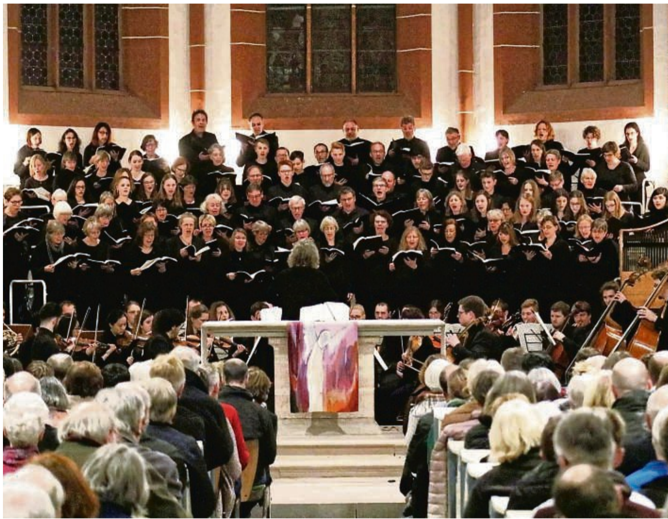
Wenn die Eschweger Kantorei auftritt, ist die Bühne voll. Die Musiker hoffen, dass die aktuellen Regeln dieses Konzert zulassen.

Während der Coronapandemie war die Chorarbeit nur eingeschränkt möglich. Proben per Videoschleife waren kein idealer Ersatz für das gemeinsame Singen vor Ort. „Während der Sommermonate haben wir jede Gelegenheit genutzt, um raus an die frische Luft zu gehen. Wir haben alles probiert, zum Beispiel in der Kirchenruine in Abterode gesungen“, sagt Voss. Bis Oktober vergangenen Jahres waren es vor allem leichte Stücke mit wenigen Sängern. Die Johannes-Passion jedoch ist richtig schwer und braucht den gan-