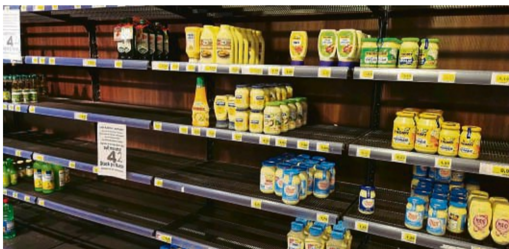
Leere Regale: In vielen Supermärkten sind Öl und Mehl knapp.