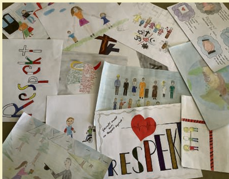
Adam-von-Trott Schule, Klasse 9aR.