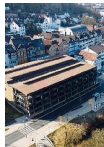
Unser Luftbild zeigt das Parkhaus an der Uferstraße in Frankenberg. Das Grundstück ist eine Option für den Neubau der Technischen Hochschule.

Damals gab es schon Pläne für einen Neubau. Favorisierter Standort: der Parkplatz neben der Sparkasse in