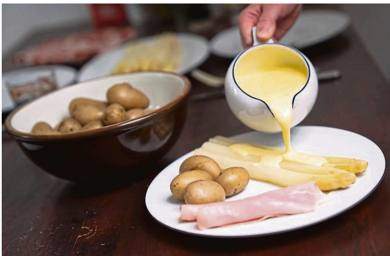
Milder Schinken, milder Spargel: Kochschinken zum weißen Spargel ist vor allem im Süden Deutschlands populär.

Bei der Wahl der Sorte achten Spargelbauern dabei nicht nur auf gute Erträge, sondern auch darauf, dass die