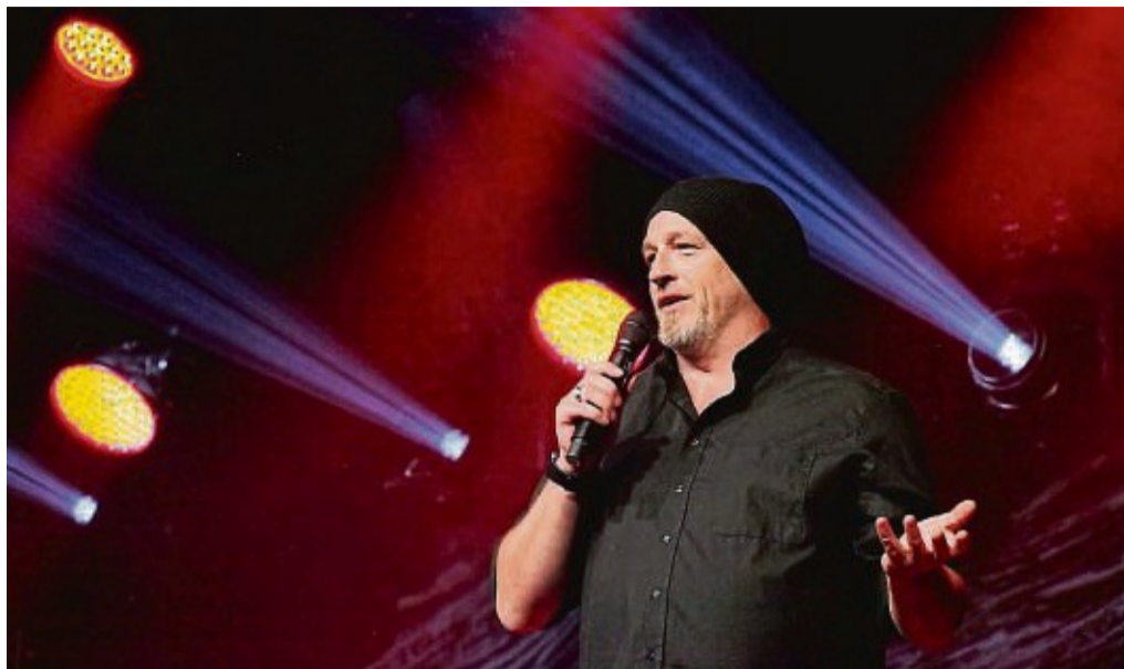
Er kommt: Torsten Sträter wird am 14. Juni im Wolfhager Kulturzelt sein aktuelles Programm präsentieren. Bereits 2018 gastierte er in den Teichwiesen.