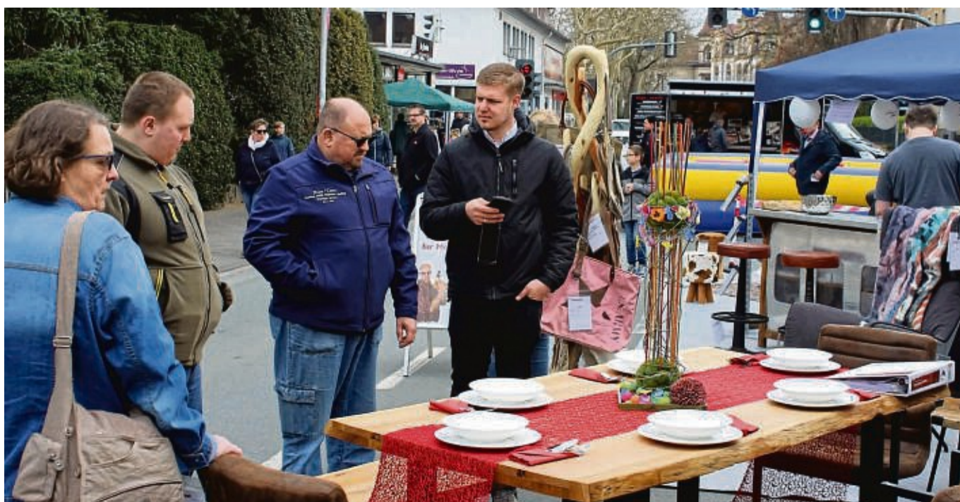
Buntes Markttreiben: Viele Verkaufshütten und -stände beleben am Sonntag die Straßen in Hofgeismar.