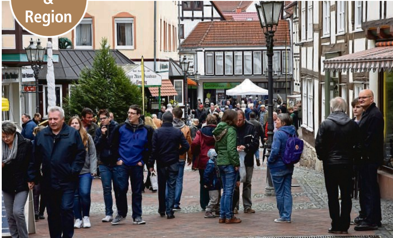
Verkaufsoffener Sonntag: Endlich wieder in aller Ruhe durch die Stadt schlendern, shoppen und mal gucken, was sich so in der letzten Zeit alles geändert hat. Das Würfelturmfest ist die beste Gelegenheit, ein wenig Normalität einkehren zu lassen.