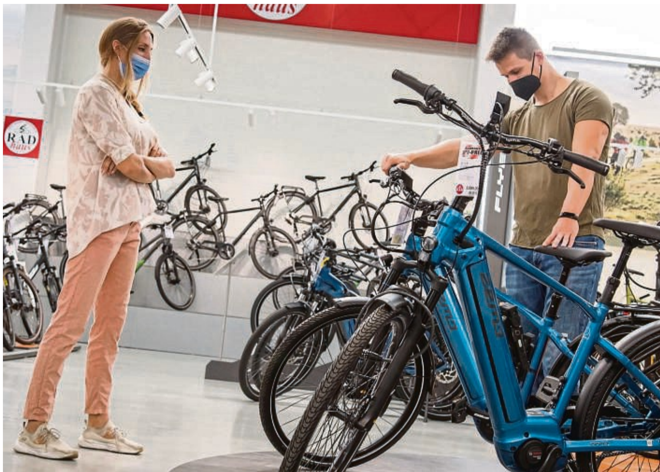
Auswahl mit Beratung: Klassischerweise gibt es das im Fachhandel - es gibt aber auch Mischformen aus Onlineberatung und Ladengeschäft.

Die Klassiker in dieser Gattung sind das City-Rad und das Trekking- oder auch Reiserad. Beide Radtypen gibt es wiederum in zahlreichen Variationen. Die finden dann beispielsweise als Urban Bike, Singlespeed, Fixie, Hollandrad oder Cruiser den