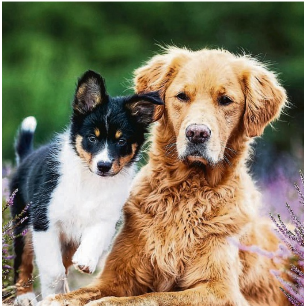
Einen gut sozialisierten erwachsenen Hund zum Freund zu haben, ist für Welpen ein Segen.

Panik sei bei entsprechenden Hundebegegnungen allerdings fehl am Platze. „Die allermeisten Hunde bei uns sind nette, gut sozialisierte