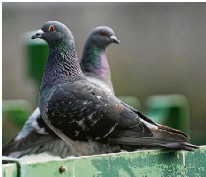
Tauben sind zahlreichen Gefahren ausgesetzt. Um erkrankten Tieren zu helfen, werden Spenden gesucht (Symbolbild).

Darin sollen 50 bis 70 Tauben Platz finden können. Auf dem Boden sollen Futter- und