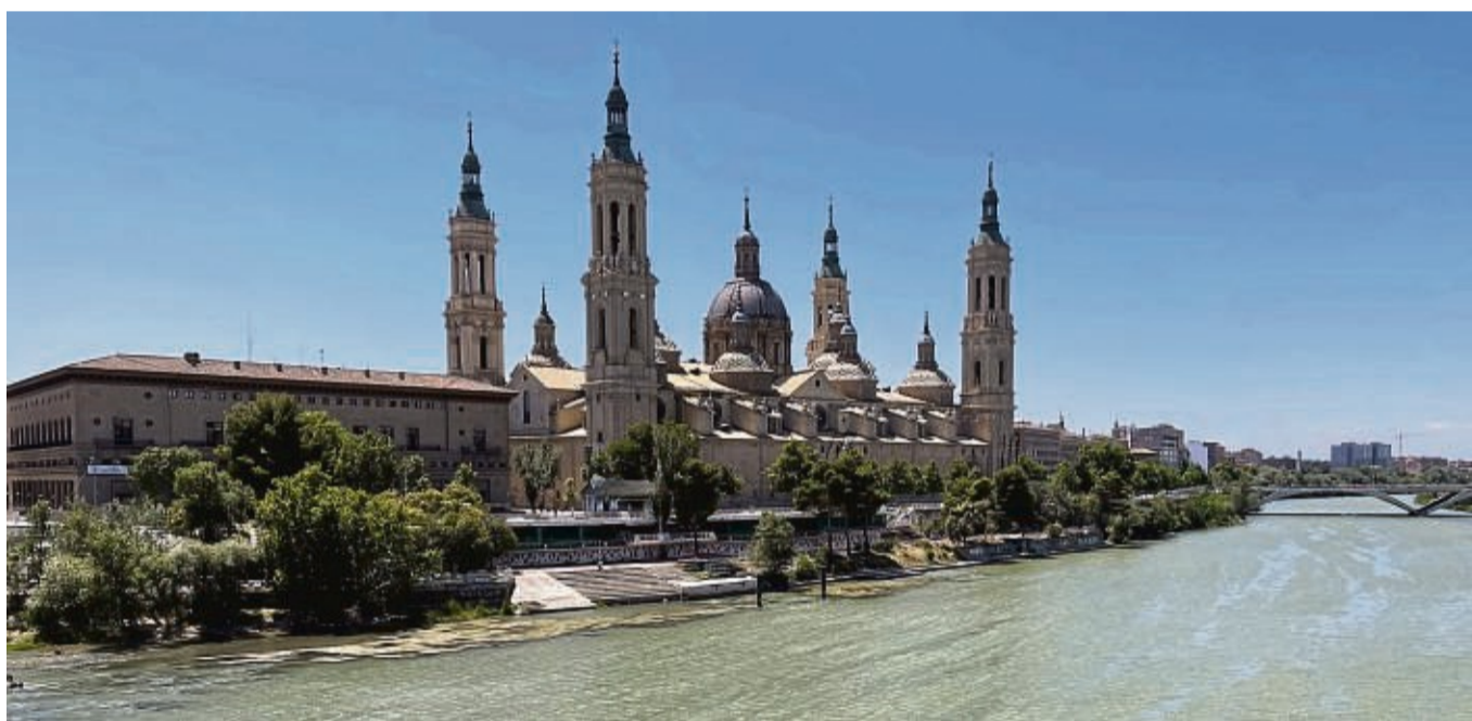
Saragossas Basilika del Pilar gilt als älteste Stätte der Marienverehrung der Christenheit.