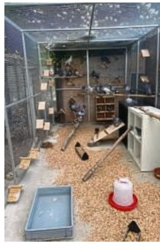
So soll die Voliere in Reinhardshagen aussehen.

Auch verletzte Tiere sind nach einer PMV-Impfung in der Voliere willkommen. Denn der Verein kümmert sich immer wieder um Tauben, die Verletzungen an den Beinen oder Flügeln haben,