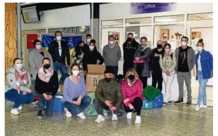
Auszubildende und Lehrkräfte der BBS Hann. Münden haben Sach- und Geldspenden für Menschen in der Ukraine gesammelt.