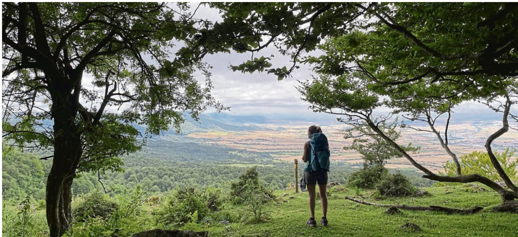
Die Bergwälder im Baskenland haben etwas Mystisches an sich.