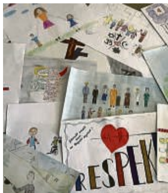
Mit dem Thema Respekt setzten sich die Schüler auseinander.