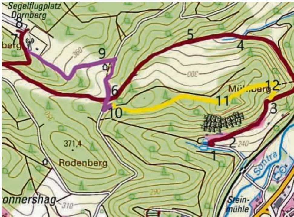
Fünf Kilometer Rundweg: Von der „Elfengrotte“ zum Segelflugplatz und zurück ist man rund zwei Stunden unterwegs.

Die erste Wanderung führt von der „Elfengrotte“ in Sontra hinauf zum Segelflugplatz und zurück. Die Wanderstrecke ist ca. fünf Kilometer lang, die reine Wanderzeit beträgt etwa zwei Stunden. Es gibt aber viele interessante Aussichtspunkte, die