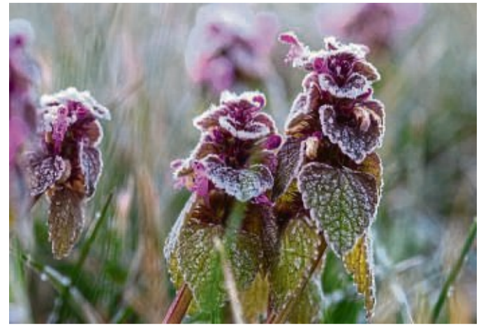
Auch im Frühling kann es noch Frost geben.