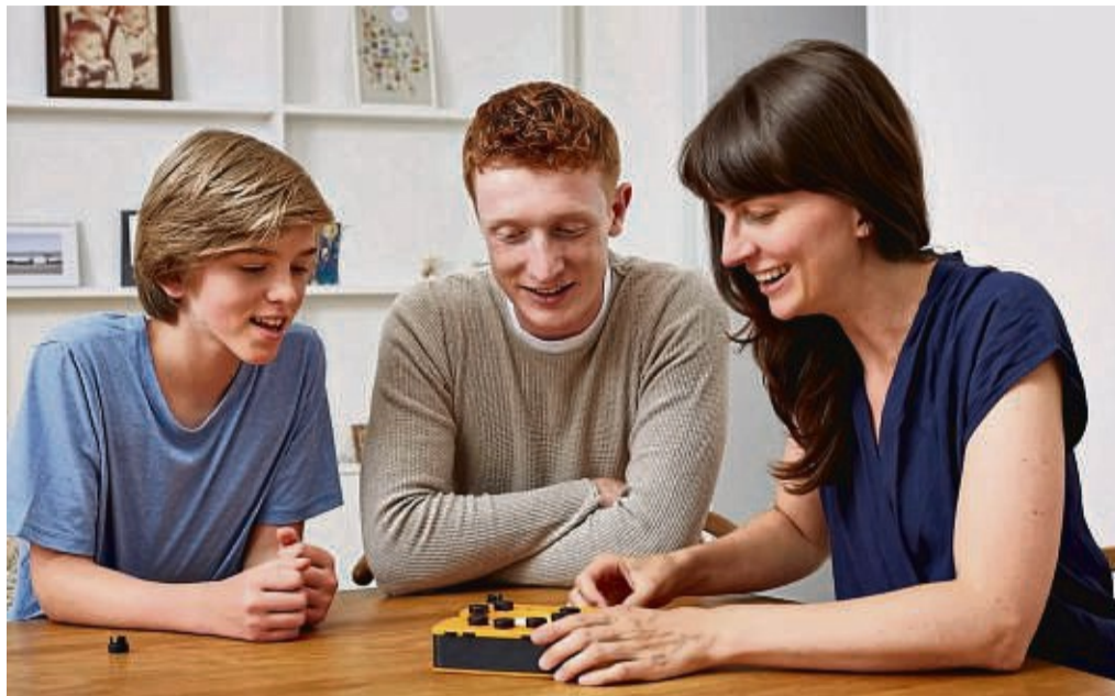
Ob in Bahn, am Esstisch oder auf dem Autorücksitz: Das Zocker-Spiel „Smart 10“ kann ohne Aufwand quasi überall gespielt werden.

Das Kneipenquiz in Brettspielform hat sich zum modernen Klassiker entwickelt, so dass es inzwischen diverse