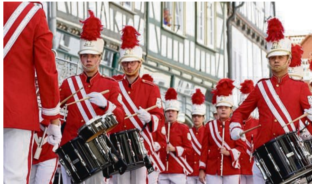
Spielen ihr Frühlingskonzert erstmalig auf dem Brauereihof: Der Spielmannszug Werratal wird unter anderem mit dabei sein.

Der Eintritt ist an beiden Veranstaltungstagen frei. An allen Tagen gibt es frisch gezapftes Eschweger Bier sowie Bratwurst und Handbrot aus dem Holzbackofen.