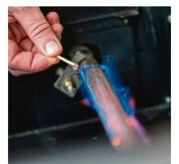
Der Gasgrill sollte vor dem ersten Entzünden der Grill-saison gewartet werden.

Undichte Anschlüsse lassen sich laut DVFG mit einem einfachen Trick aufspüren. Ein Gemisch aus Spülmittel und Wasser zu gleichen Teilen wird dazu auf die Schlauchverbindungen aufgetragen. Entstehen bei geöffnetem Ventil Blasen und