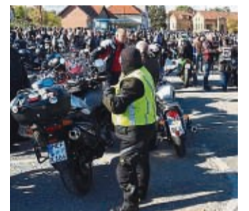
600 bis 1000 Maschinen werden zum Motorrad-Gottesdienst auf dem Hohen Meißner erwartet.

Werdchen in Eschwege. Um 14 Uhr geht es dort los zur gemeinsamen Fahrt auf den Hohen Meißner, wo der Gottesdienst stattfindet. Danach ist eine „Rund um den Meißner“-Ausfahrt geplant mit anschließend Essen, Trinken und Benzingesprächen auf der Freizeitanlage in Abterode. „Nach zwei Jahren Pandemie sind wir geübt darin, Gottesdienste draußen abzuhalten“, sagt Pfarrer Beyer. Auch die mobile Kircheneintrittsstelle ist dann mit von der