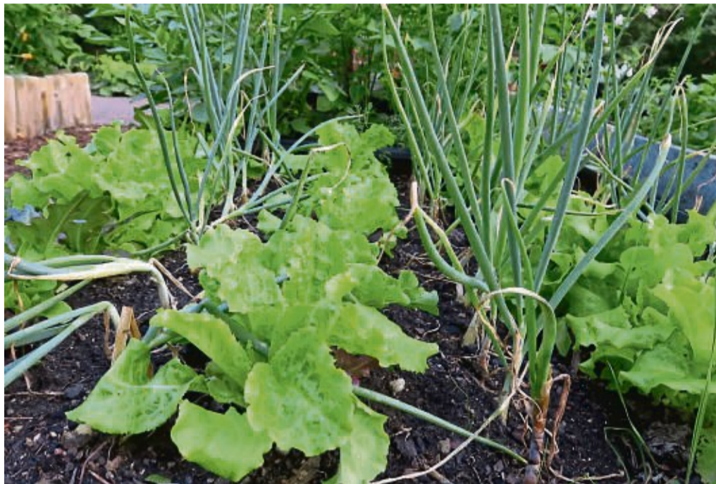
Mischkulturen schützen sich gegenseitig vor Schädlingen und Krankheiten oder fördern sich im Wachstum.

Manche Pflanzen brauchen mehr Nahrung. Andere profitieren davon, wenn schon jemand das Buffet ausgedünnt hat, weil sie mit Überangebot nicht klar kommen. Daher ist die Mischkultur eine jahrhundertalte Gärtnermethode im Gemüsebeet: Man lässt bestimmte Gemüsearten nacheinander auf einer Fläche