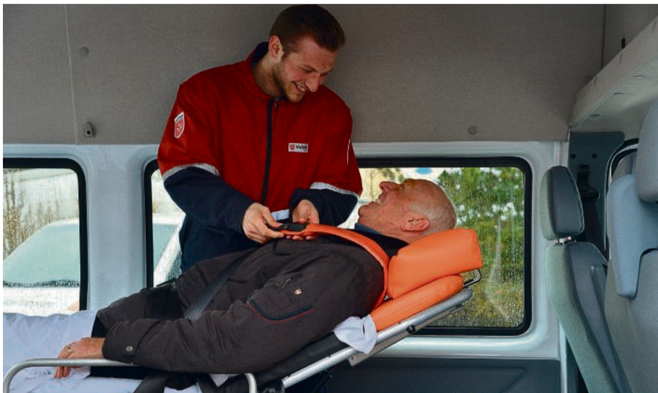
Zuverlässige Beförderung und Betreuung des „Malteser Hilfsdienstes“.

„Nicht selten wird dann einem auch die eigene Vergänglichkeit bewusst“, so Reith. Ein gutes Verhältnis zu den Fahrgästen, besonders zu denjenigen, die regelmäßig den Fahrdienst in Anspruch nehmen ist für die Mitarbeitenden besonders