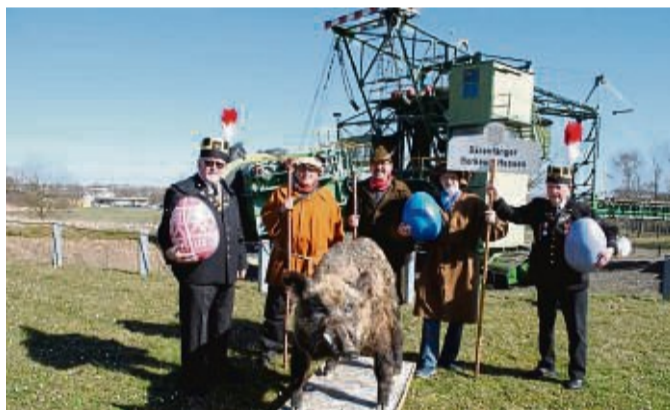
Ideen sind gefragt: Die Borkener Bärenfänger, der Geschichtsverein Borken und das Bergbaumuseum suchen einen Namen für das Tier, das die mutigen Helden auf ihrer Jagd erlegten.

seum startet ebenfalls mit Volldampf in den Frühling und bietet am kommenden Sonntag von 11 bis 17 Uhr ein coronagerechtes Familienprogramm samt Ostereier-Weltmeisterschaft. Dabei können Kinder Ostereier balancieren, baggern und boßeln. Kinder haben freien Eintritt und freie Fahrt mit der Beucherbahn, Erwachsene zahlen vier Euro. Auch der Besucherstollen in der Innenstadt ist am Sonntag von 11 bis 17 Uhr geöffnet.