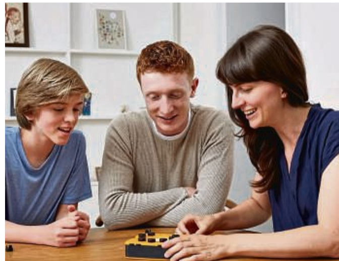
Ob in Bahn, am Esstisch oder auf dem Autorücksitz: Das Zocker-Spiel „Smart 10“ kann ohne Aufwand quasi überall gespielt werden.