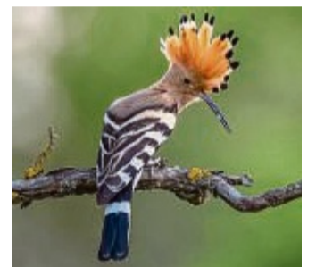
Macht Up-up-up-Rufe: der Wiedehopf, Vogel des Jahres 2022.

Der Zugvogel mit der auffälligen Federhaube wird laut Mitteilung als sehr seltener Brutvogel Hessens in der Roten Liste als vom Aussterben bedroht geführt. Übermäßiger Einsatz von Pestiziden führe dazu, dass er kaum noch große Insekten als Nahrungsgrundlage finde. In Hessen niste der wärmeliebende Vogel vorzugsweise in den Landkreisen Bergstraße, Darmstadt und Groß-Gerau.