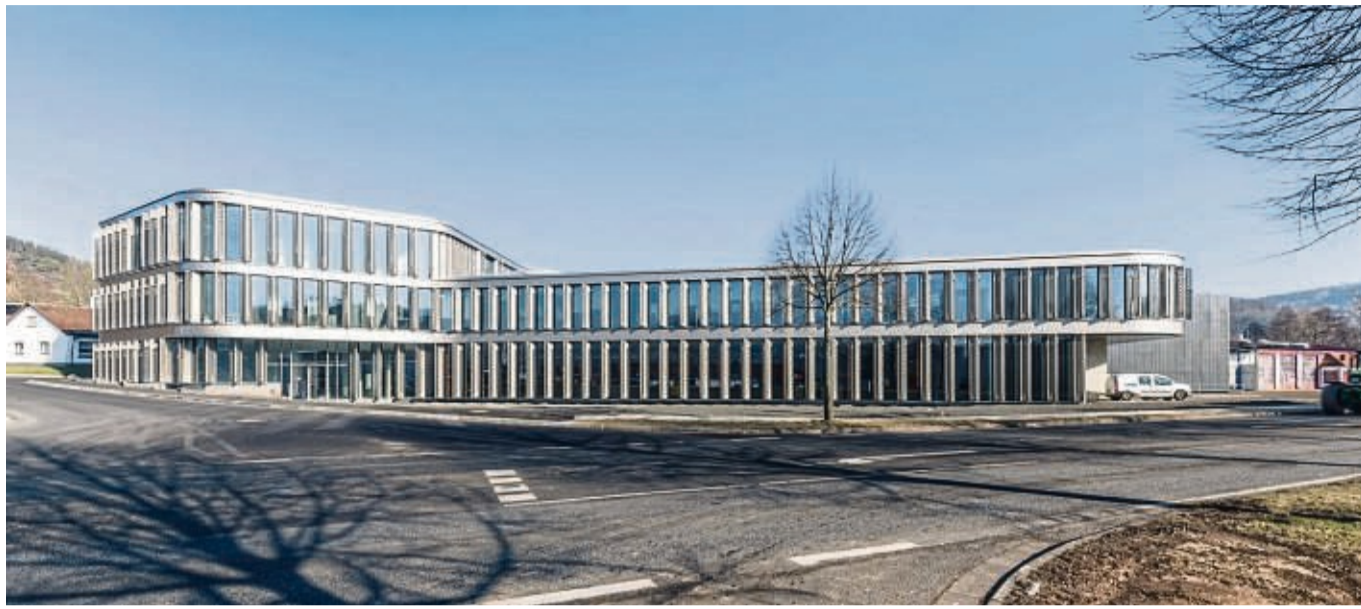
Modern: Das neue Mehrzweckgebäude von Wikus in Spangenberg. Das Unternehmen investiert 13 Millionen Euro in den Standort. Im Erdgeschoss soll die Kundenauftragsfertigung einziehen.

Mit dem Vertriebsprojekt „Wigrow25“ sollen demnach Märkte besser bearbeitet und