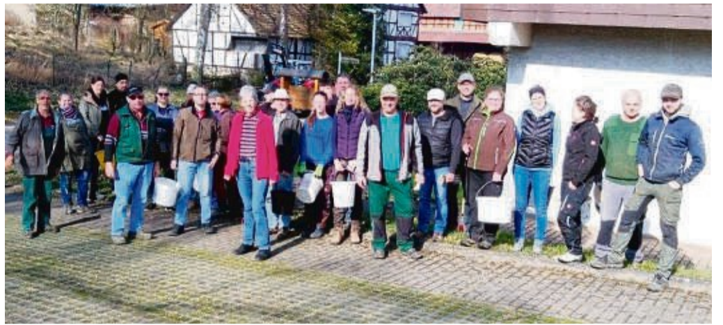
Beim Umwelttag: 29 Teilnehmer reinigten die Gemarkung Beuern.

Die Dorfgemeinschaft Beuern hatte die Lebensmittel bereitgestellt.