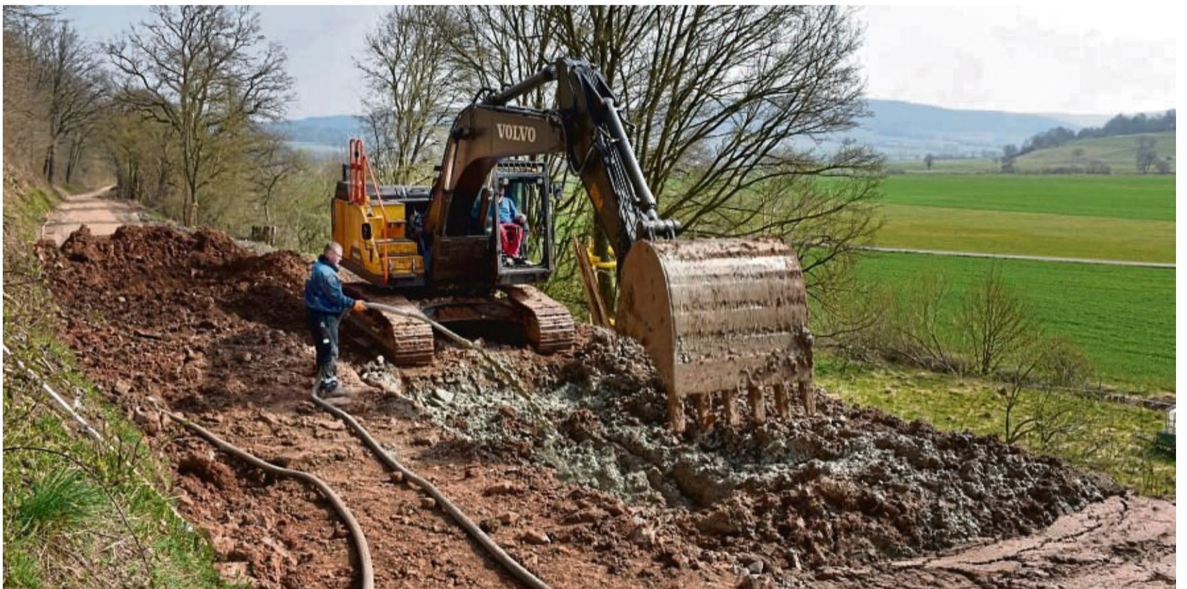
Der Erdboden wird in acht Meter langen Abschnitten (soweit der Baggerarm reicht) aufgedrückt und mit Flüssigzement durchmischt und verfestigt.

Um das Problem zu beheben, wird der Untergrund auf der talseitigen Fahrbahnhälfte nun auf voller Länge mit flüssigem Zement stabilisiert (siehe Hintergrund). Es handelt sich dabei um die bisher größte Baustelle dieser Art im Landkreis Kassel. In einigen