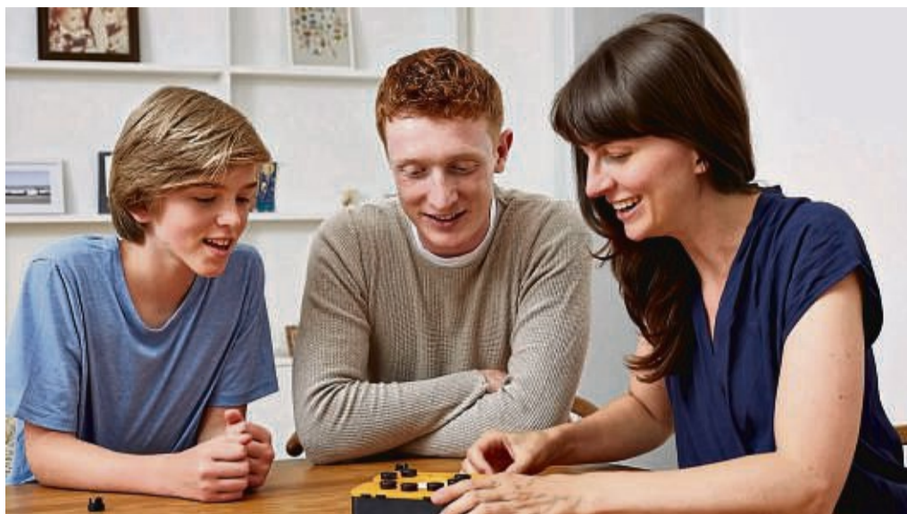
Ob in Bahn, am Esstisch oder auf dem Autorücksitz: Das Zocker-Spiel „Smart 10“ kann ohne Aufwand quasi überall gespielt werden.

Das Kneipenquiz in Brettspielform hat sich zum mo-