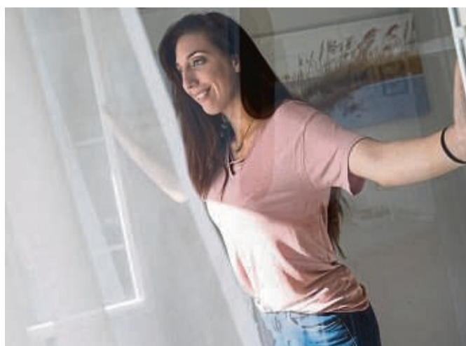
Im Frühjahr trägt die Luft mehr Feuchtigkeit in sich – häufigeres Lüften ist deshalb wichtig.

Im Frühjahr wieder häufiger und länger lüften