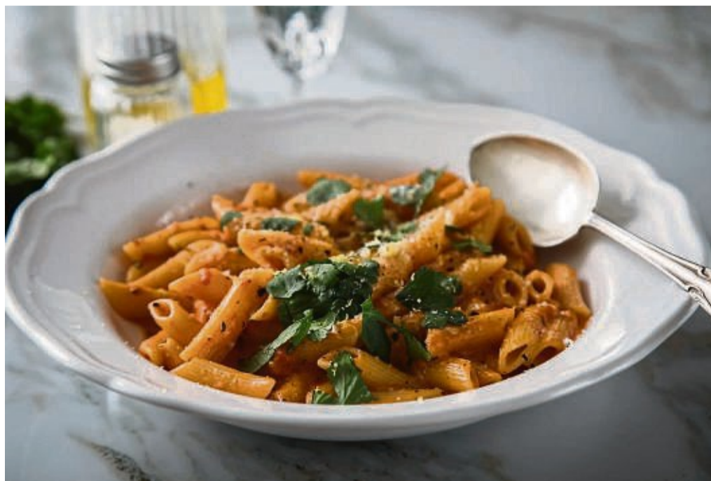
Auch wenn der Name Wodka-Nudeln neugierig macht: Lecker wird das Gericht eher nicht wegen dem Wodka, sondern durch reichlich Butter und Sahne.

So geht's: Auch wenn Wodka-Pasta im Netz oft in einem Atemzug mit Gigi Hadid er-