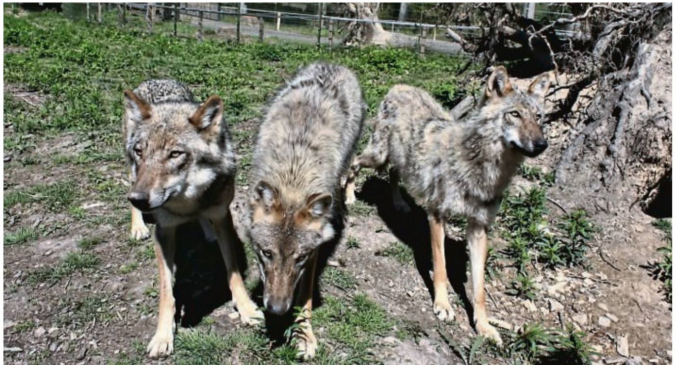
Leihen ihre Spürnasen der Wissenschaft: die Uni Gießen testet in den nächsten Wochen bei den Wölfen des Wildtier-Parks aus, ob bestimmte Gerüche den Wolf von Nutztieren effektiv fernhalten könnten.