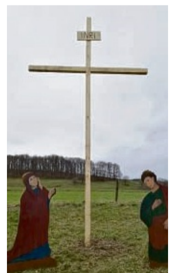
Auf dem Stautenberg bei Benkhäusen wurde ein Passionsweg errichtet, der bis Ende April besucht werden kann.

Der Passionsweg unter freiem Himmel ist von Gründonnerstag bis Ende April aufgebaut und kann selbständig besucht werden.