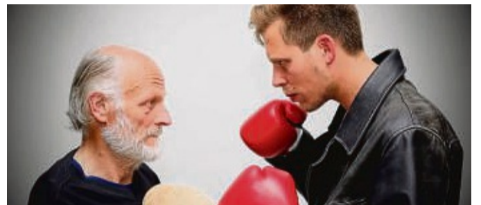
„Das Herz eines Boxers“ kehrt in Bad Arolsen auf die Bühne zurück.