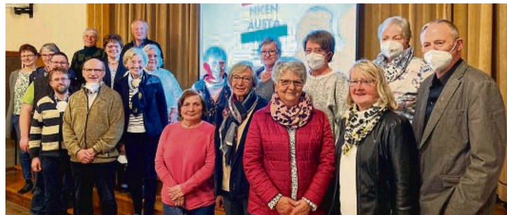
Der Gemeindevorstand von St. Marien muss die Veränderungen in der Kirche bewältigen.