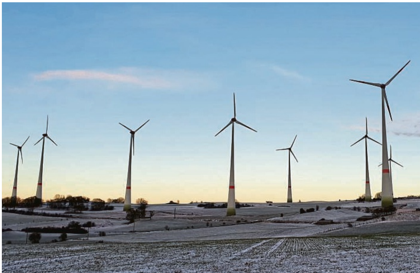
Windpark Martenberg bei Adorf: Wegen einer mutmaßlichen Cyberattacke war die Fernwartung über Satellit mehrerer Tausend Windkraftanlagen in Europa gestört – auch in Waldeck-Frankenberg.

Betroffen waren neben Enercon europaweit rund 30 000 Satellitenterminals, die von Unternehmen und Organisationen aus verschiedenen Branchen genutzt werden. Es wird ein Zusammenhang mit dem russischen Angriffskrieg vermutet. „Die Störung der Kommunikation zu den Windenergieanlagen gilt als Kollateralschaden“, so das Windenergie-Unternehmen in einer Pressemitteilung. Abgeschnitten von der Fernüberwachung waren auch Anlagen in Waldeck-Frankenberg, unter anderem der Windpark Martenberg in Adorf. „Inzwischen funktio-