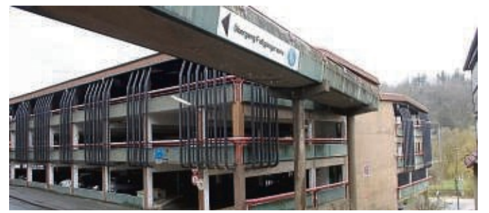
Wird abgerissen: das Parkhaus in Frankenberg. Auf der Fläche soll anschließend die neue Hochschule entstehen.