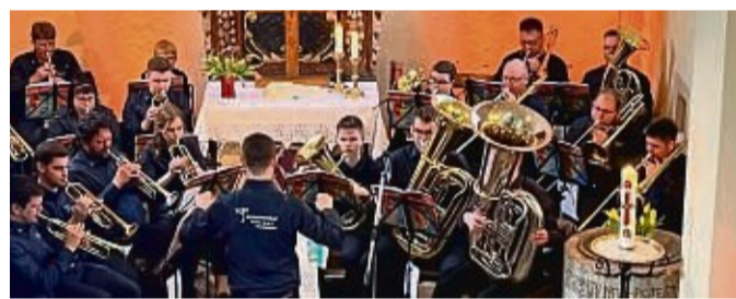
Ein breit gefächertes Repertoire präsentierte der Posaunenchor Nieder-Ense/Immighausen den Zuhörern in der Kirche in Nieder-Ense.