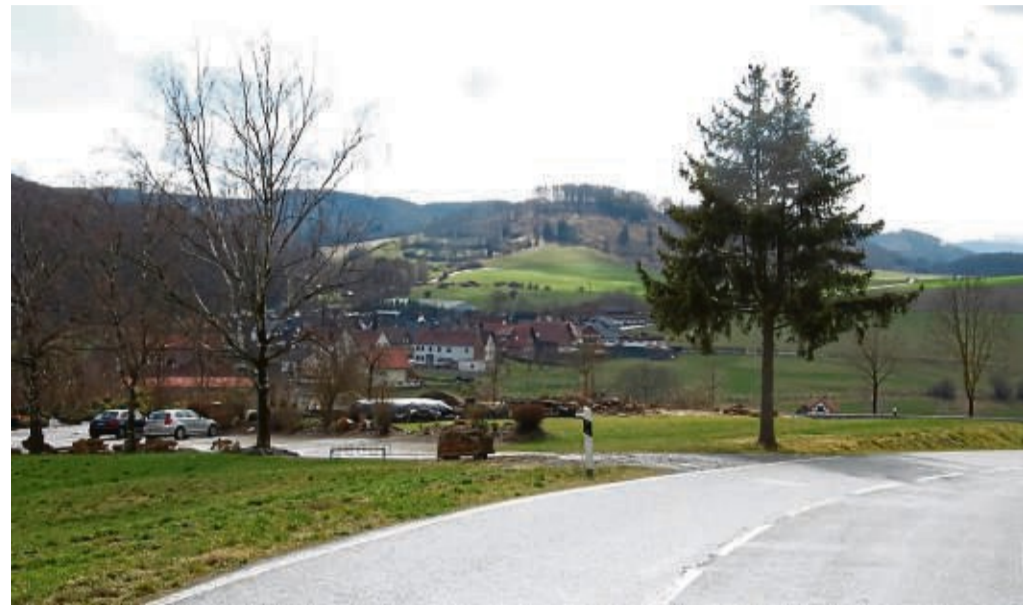
Schöner Ausblick: An der Kreisstraße nach Wirmighausen sollen die Minihäuser für Urlauber entstehen.

und Leo, ein Mann Ende Sechzig, die in sieben Szenen (die Parallele zu den sieben Runden eines Boxkampfes ist natu?rlich kein Zufall) unterhaltsam und nachdenklich Freundschaft schließen. Die Aufführungen beginnen jeweils um 19.30 Uhr im BAC-Theater, In den Siepen 6, Bad Arolsen. Karten gibt es im „FINDLING“ - Fair-Kauf-Laden, Helenenstraße 12, Bad Arolsen, Telefon: 05691-5009092. red