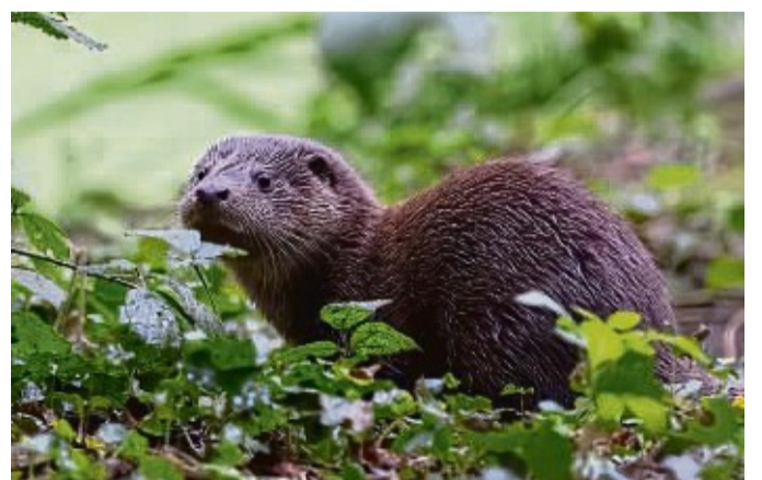
Der Fischotter ist neu in das Gehege eingezogen, soll aber nicht lange alleine bleiben.