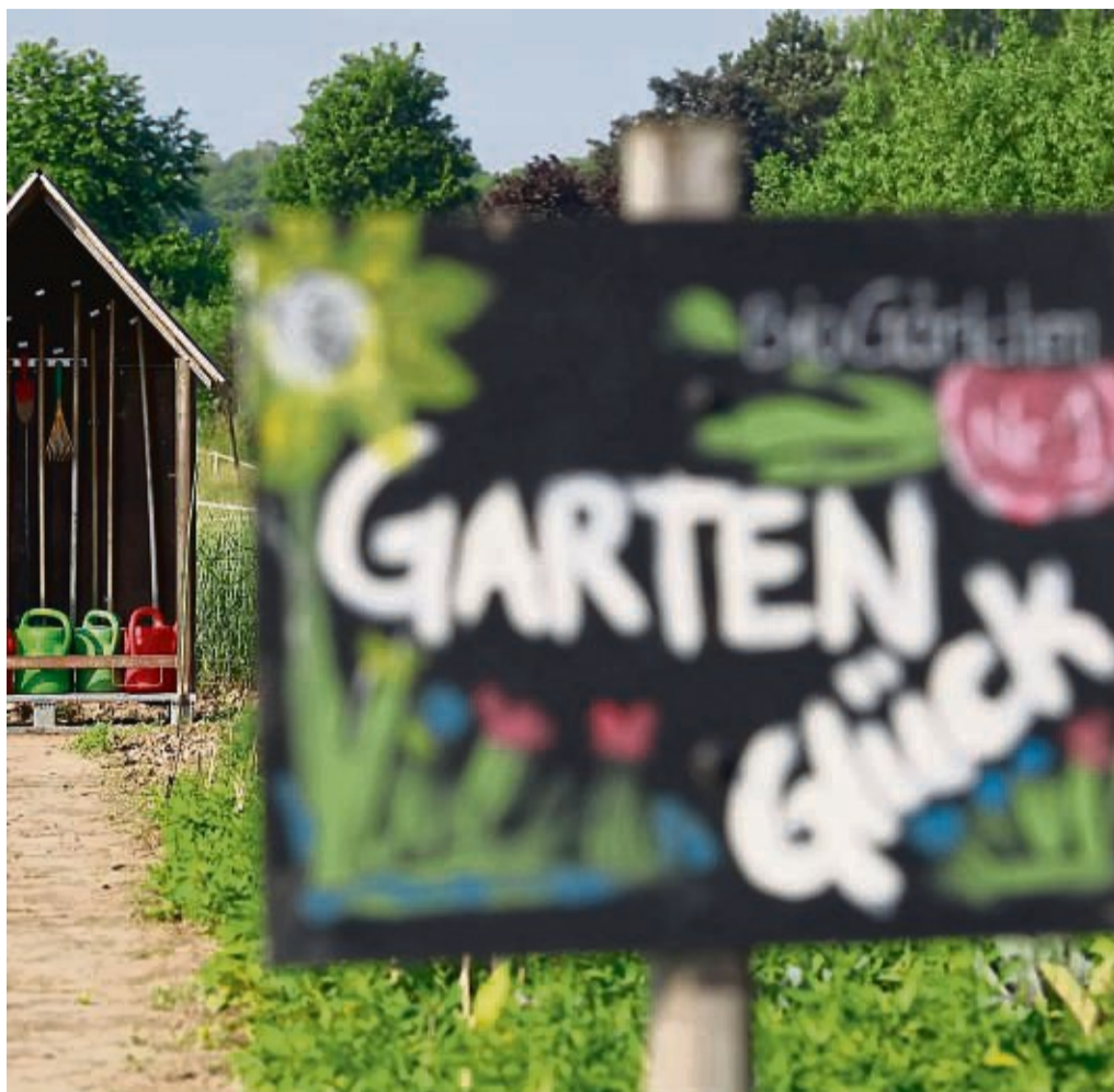
Es ist für viele ein Traum: Ein großer Garten, über den man sich nahezu komplett versorgen kann.

Dazu kommen Gänse, Hühner, Bienen und Kaninchen – wobei letztere nicht mehr ge-