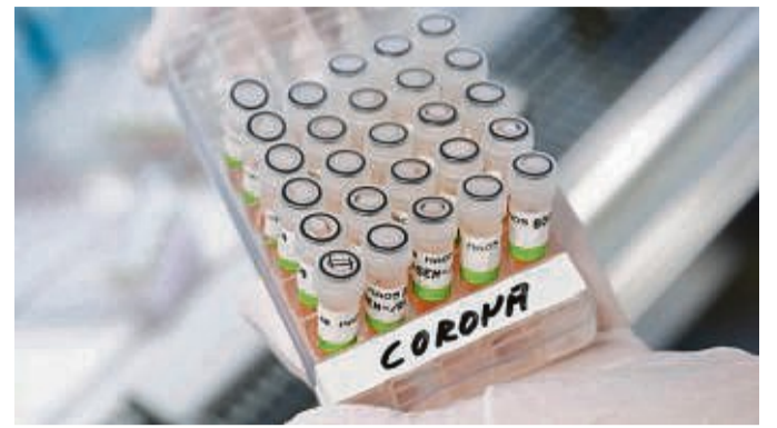
PCR-Tests auf das Corona-Virus sind nach wie vor gefragt, doch für Patienten gibt es weniger Anlaufstellen dafür.