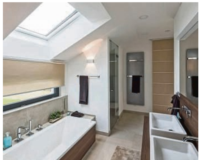
Beim Baden die Sonne oder den Sternenhimmel genießen – Komfort, den richtig geplante Fenster möglich machen.

fugtes Eindringen und warnen den Hausbesitzer über sein Smartphone. „Sicherheitsbeschläge mit Pilzkopfverriegelungen, abschließbare Griffe, eine stabile Befestigung der Sicherheitsverglasung in der Fensterkonstruktion und eine korrekte Montage des Fensters im Mauerwerk sorgen für Sicherheit. Idealerweise sollten diese sogenannten RC2-Konstruktionen mit einer Automation kombiniert sein.“