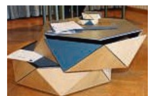
Siegerwerkstück: ein anspruchsvoll gestalteter Couchtisch.

im Rahmen der Ausstellung der Meisterstücke an der Bad Wildunger Holzfachschule für ihre herausragenden Leistungen geehrt. Dozent Karsten Mrzyglod wies in seiner Laudatio auf die besonderen Anforderungen des vor rund 20 Jahren ins Leben gerufenen Wildunger Designpreises hin, der handwerkliche und technische Meisterschaft bei der Erstellung des Werkstücks voraussetzt, letztendlich aber über die