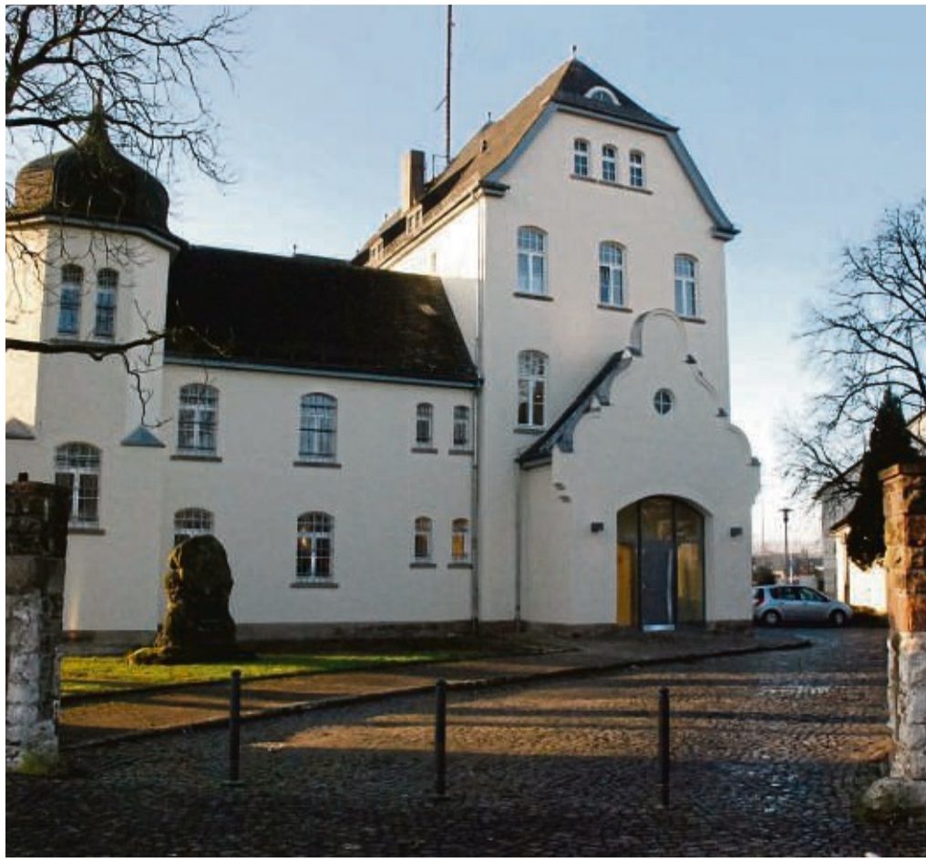
Zum ehemaligen Stabsgebäude der Arolser Kaserne gehört ein Kasernenhof, in dem Gedenktafeln die historischen Zusammenhänge erläutern.