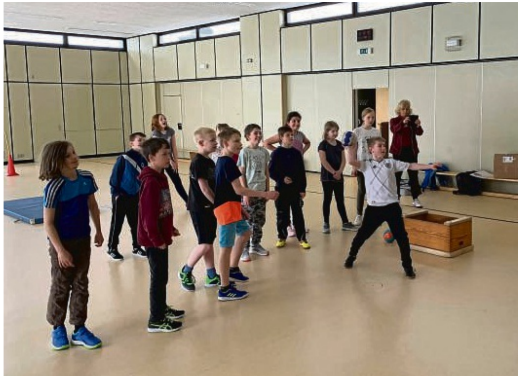
Grundschüler haben in Höringhausen an einem Handballaktionstag teilgenommen.