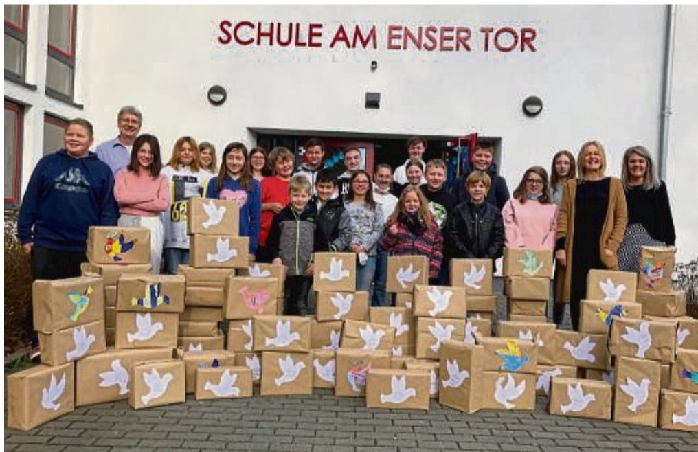
„Auf die Päckchen, fertig, los“: In Kooperation mit youngcaritas Korbach wurden knapp 100 Willkommenspakete für Kinder und Erwachsene aus der Ukraine gepackt.

Doch nicht nur Zahnbürsten, Shampoos und andere