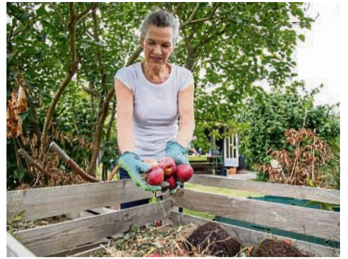
Aus Küchenabfällen wird auf einem Kompost mit der Zeit Dünger oder ein wertvoller Boden – und Bestandteil von selbstgemischter Blumenerde.