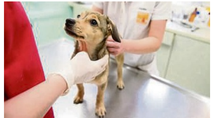
Damit im Notfall schnell die richtige Hilfe gefunden wird, sollten Tierhalter vorbereitet sein.

Doch Vorsicht: Bei einem Tier, das sich übergeben muss oder einem bewusstlosen Tier ist das Schnauzenband tabu, so die ARAG Experten.