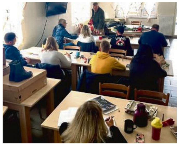
Ein Waffensachkundelehrgang mit abschließender Prüfung im Schützenhaus Netze hat den Neuschützen des „Waldecker Veteranen e.V.“ und des dortigen Schützenvereins Netze die notwendige Kompetenz im Umgang mit Sportwaffen und Munition vermittelt.