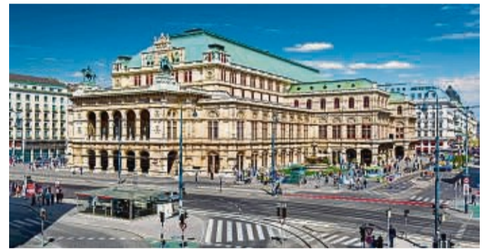
Auf dem Dach der Staatsoper ist schon Tom Cruise herumge- turnt.