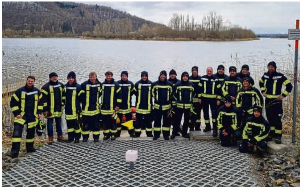
Erfolgreich: Aktive Einsatzkräfte der Freiwilligen Feuerwehren aus Wanfried und aus Schwebda haben Anfang April den Sportbootführerschein abgelegt.

Weil die Landesfeuerwehrschule in Kassel aber höchstens ein bis zwei Plätze im Jahr für die Ausbildung anbieten kann, hat der Schwebdaer Wehrführer sich geküm-