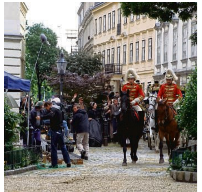
Die Donaumetropole war natürlich auch Kulisse in den «Sissi»-Filmen.