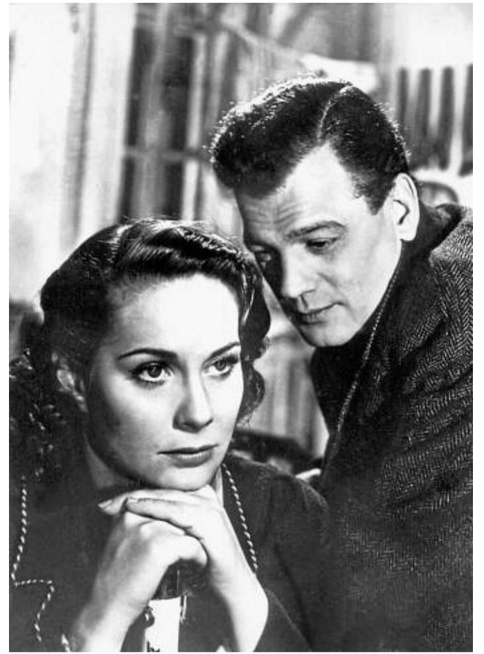
«Der dritte Mann», hier eine Szene mit Alida Valli und Joseph Cotten, gilt als ein Klassiker der Filmgeschichte - und spielt in Wien.