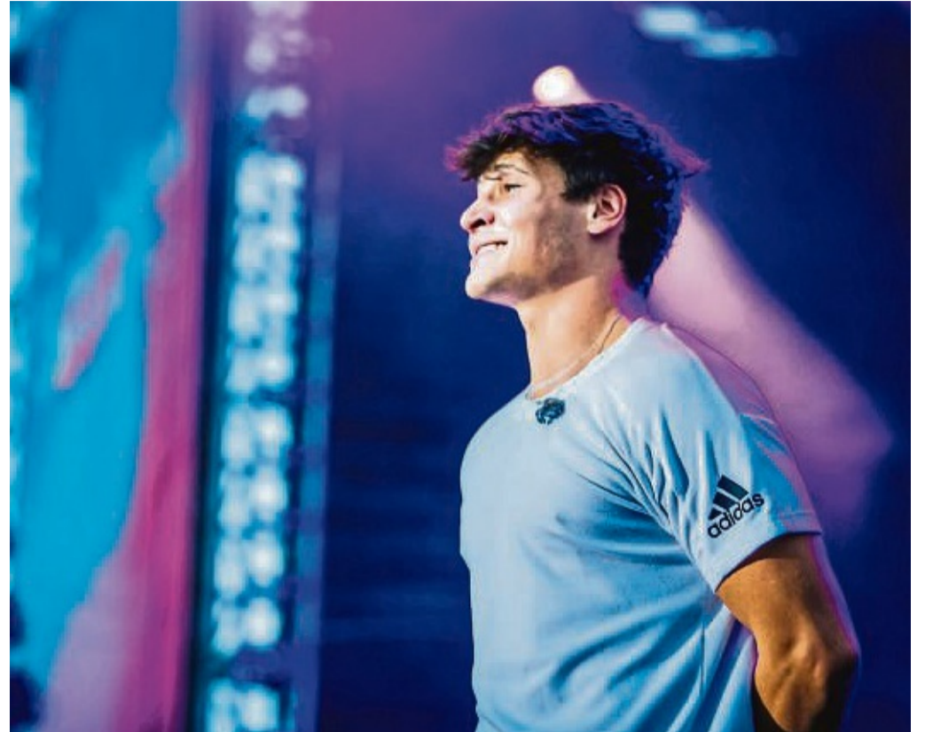
Kommt im Sommer erneut nach Bad Sooden-Allendorf zum SoundGarten Open Air: Popsänger Wincent Weiss.

Popsänger Wincent Weiss kommt nach Bad Sooden-Allendorf