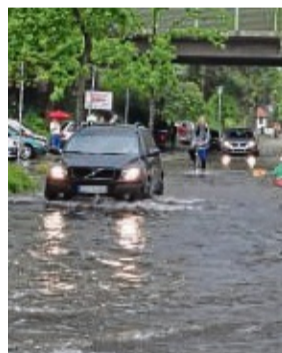
Kommt vermehrt auf: Hochwasser.

der Experte. Besonders Flachdachgebäude und Schrägdächer würden sich für eine Bepflanzung eignen. djd