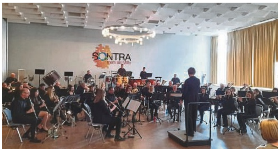
„Concerto for Clarinet and Band“ war Höhepunkt des Konzertes: Benefizkonzert für die Ukraine in Sontra.

Danach erst begann das eigentliche Programm für die Matinee in Sontra mit dem Stück ‚El Camino Royal‘ von Alfred Reed. Ein Stück, das mit lateinamerikanischen Rythmen und Akkordfolgen, die man sonst nur von Flamenco-Gitarren kennt, überraschte und begeisterte.