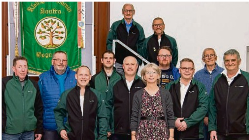
Vorstandswahlen standen auf der Tagesordnung des Kleingartenvereins Sontra. Auf dem Bild zu sehen ist der neu gewählte Vorstand.

Der Vorsitzende berichtete von den im vergangenen Jahr vorgenommenen Arbeiten am Vereinsgelände ebenso wie von teilweise nicht so schönen Vorkommnissen. Weiterhin wurden auch die geplanten Wartungsarbeiten,