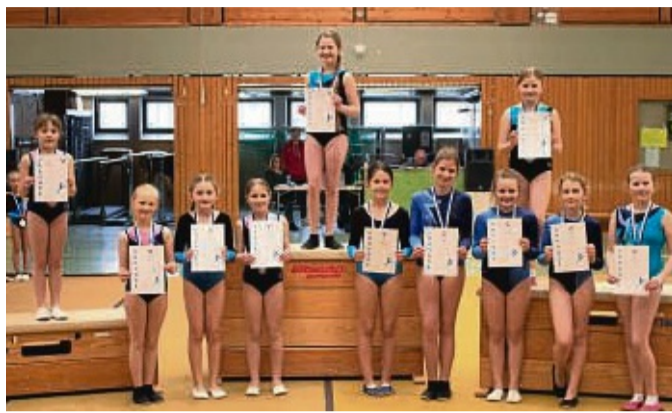
Überglücklich wieder Sport machen zu dürfen: Die Gewinnerinnen des Tages.