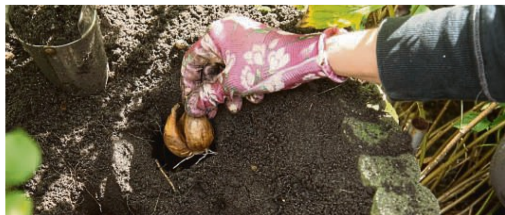
Blumenzwiebeln sollten Tierhalter so tief in die Erde setzen, dass ihre Schützlinge diese nicht ausgraben und daran knabbern können.