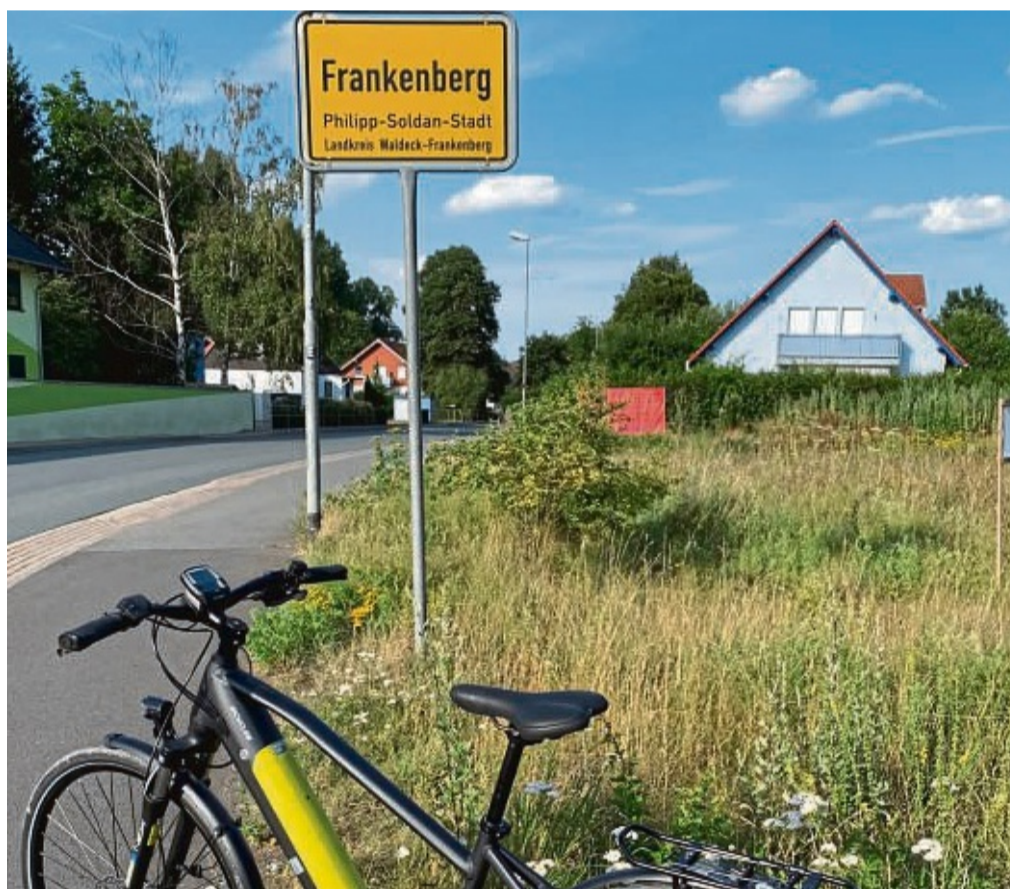
Die Stadt Frankenberg ruft wieder zum Stadtradeln auf.

Mitmachen können alle, die in Frankenberg wohnen, arbeiten, studieren, in die Schule gehen, oder einem Verein angehören – allein oder in einem eigens angelegten Team aus mindestens fünf Personen – etwa aus Stadtteilen, Unternehmen, Familien, Vereinen und Nachbarschaften. „Nach zwei Pandemie-Jahren soll dieses