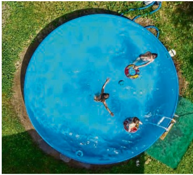
Ob in den Boden eingelassen oder nicht: Für Pools mit festen Wänden gelten dieselben Bauvorschriften.