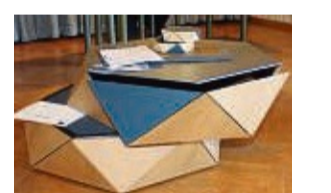
Siegerwerkstück: ein anspruchsvoll gestalteter Couchtisch.

im Rahmen der Ausstellung der Meisterstücke an der Bad Wildunger Holzfachschule für ihre herausragenden Leistungen geehrt. Dozent Karsten Mrzyglod wies in seiner Laudatio auf die besonderen Anforderungen des vor rund 20 Jahren ins Leben gerufenen Wildunger Designpreises hin, der handwerkliche und technische Meisterschaft bei der Erstellung des Werkstücks voraussetzt, letztendlich aber über die