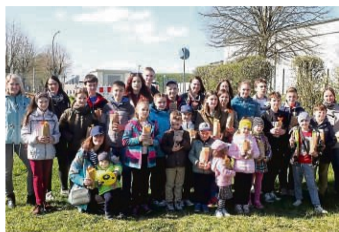
Gelungene Osterüberraschung: Unser Bild zeigt die ukrainischen Kinder mit ihren Müttern, die von der Gemündener Frauenunion mit 50 Ostertüten beschenkt wurden. FOTO: MARISE MONIAC

Splitt und weiteres Material wurden zunächst aus eigener Tasche bezahlt. „Wir versuchen, das Geld über den Förderverein wiederzukriegen“, sagt Michel. Im Bild von links: Heinz Seitz, Dirk Michel, Horst Knoche, Laurenz Michel, Hartmut Schäfer, Harry Hurnik und Helmut Knoche. DS FOTO: SUSANNA BATTEFELD