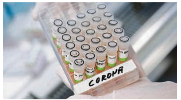
PCR-Tests auf das Corona-Virus sind nach wie vor gefragt, doch für Patienten gibt es weniger Anlaufstellen dafür.