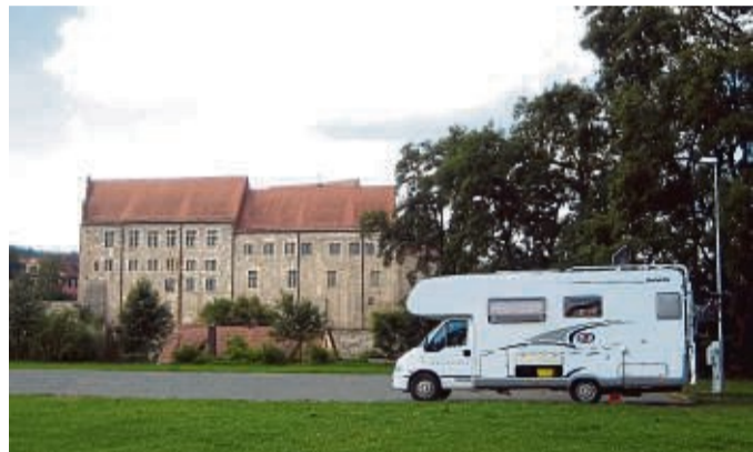
Westlich von Nürnberg liegt der malerische Markt Cadolzburg.