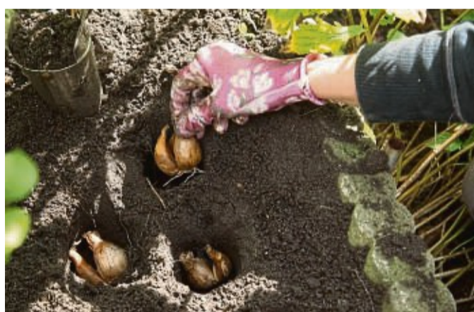
Blumenzwiebeln sollten Tierhalter so tief in die Erde setzen, dass ihre Schützlinge diese nicht ausgraben und daran knabbern können.

Wenn die Blätter vertrocknet sind, können die Zwiebeln in luftige Säckchen kommen, in denen Sie an einem trockenen und kühlen Ort bis zum Herbst lagern. Dann werden sie wieder – zur üblichen Pflanzzeit der früh blühenden Zwiebelblumen – in den Gartenboden gesetzt: Zwischen September und November. tmn