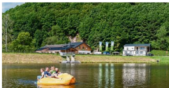
Der Ferienpark Wirftal befindet sich in der wald- und wasserreichen Vulkaneifel.