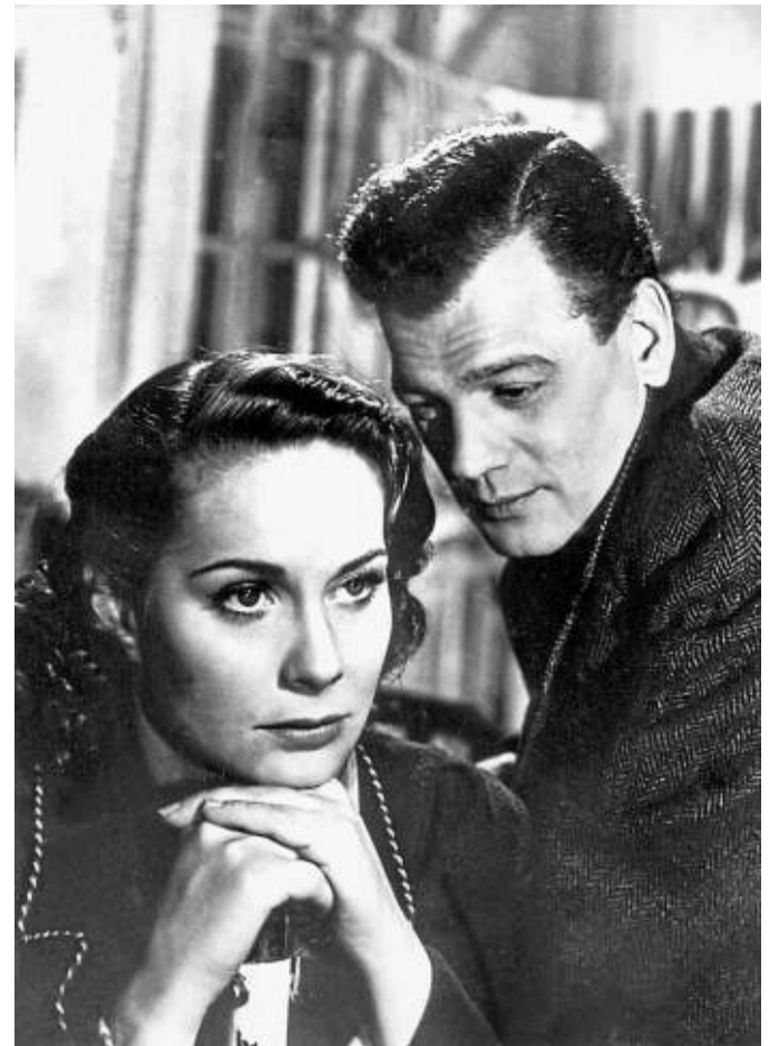
«Der dritte Mann», hier eine Szene mit Alida Valli und Joseph Cotten, gilt als ein Klassiker der Filmgeschichte - und spielt in Wien.