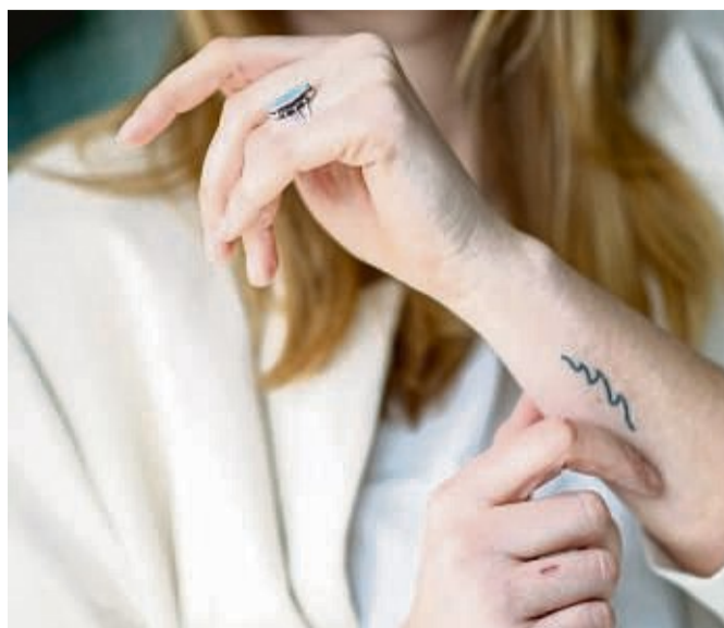
Ein Tattoo ist definitiv eine bleibende Reiseerinnerung.

Manche machen das ganz gezielt und besuchen auf der Reise zum Beispiel einen Maori oder einen Mönch, um sich dort dann ein Tattoo ste-