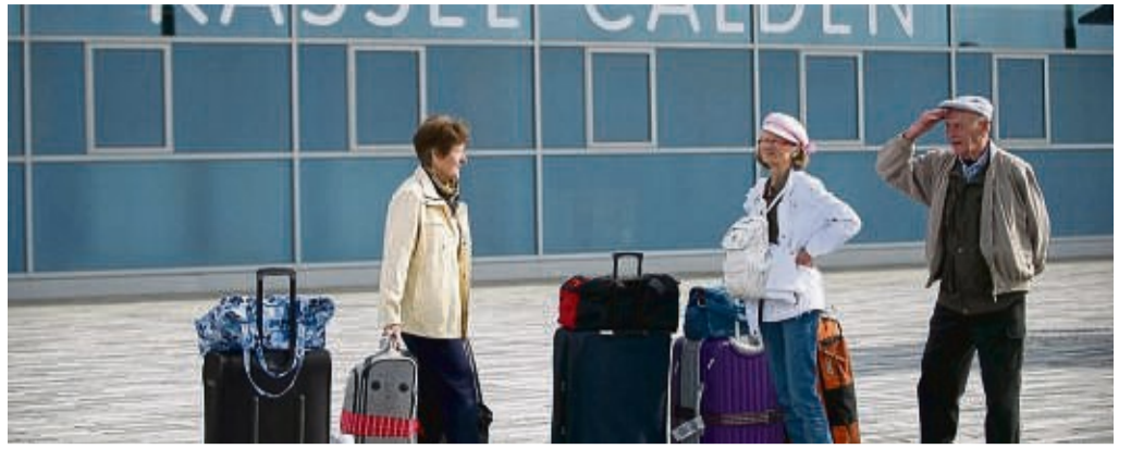
Keine Chance: Vom Kassel Airport in Calden geht es im Mai und Juni nicht nach Fuerteventura. Unser Bild entstand im Jahr 2013.