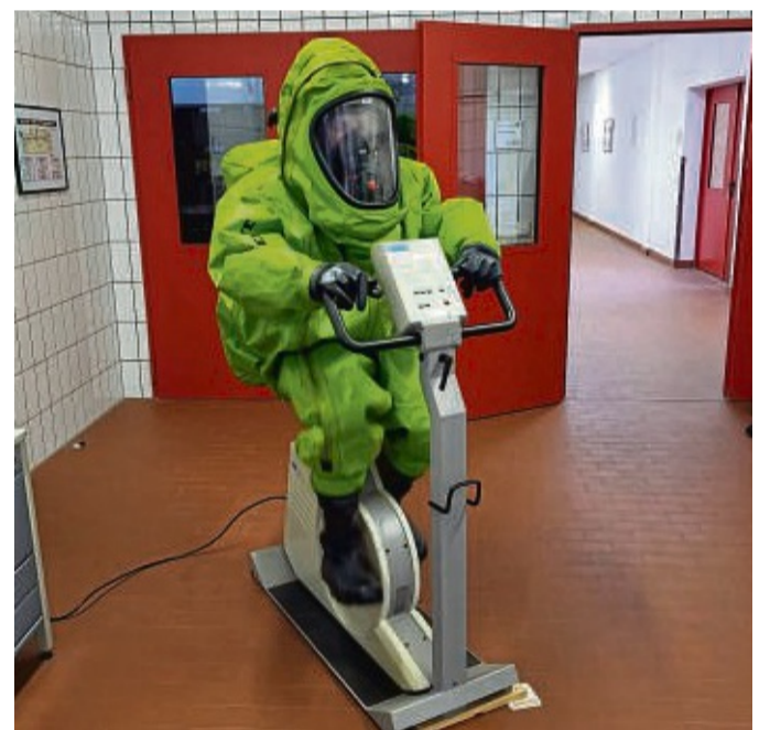
Der Chemikalienschutzanzug (CSA) erfordert genaue Kenntnis und Übung, um bestmöglich von der Feuerwehr eingesetzt werden zu können.

Insbesondere bei der praktischen Übung wurde deutlich, dass das Tragen des CSA um einiges anstrengender ist, als bei einem normalen Atemschutzgeräten und Einsätzen. Sicht, Beweglichkeit und Kommunikation sind durch den Schutzanzug stark