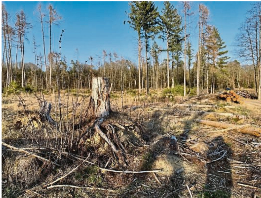
Trockenheit und Sturm schädigten den Stadtwald: Am Pärner Weg im Revier Bad Wildungen sollen auf rund 26 Hektar geförderte Eichenkulturen angelegt werden.

Den Erlösen in Höhe von rund 1,08 Millionen Euro stehen 780 000 Euro an Aufwendungen gegenüber. Erwirtschafteter Gewinn: etwa