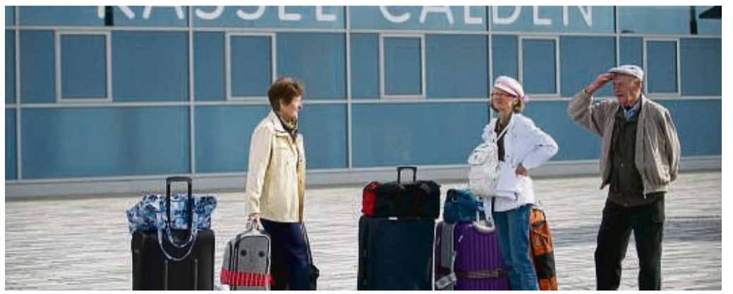
Keine Chance: Vom Kassel Airport in Calden geht es im Mai und Juni nicht nach Fuerteventura. Unser Bild entstand im Jahr 2013.