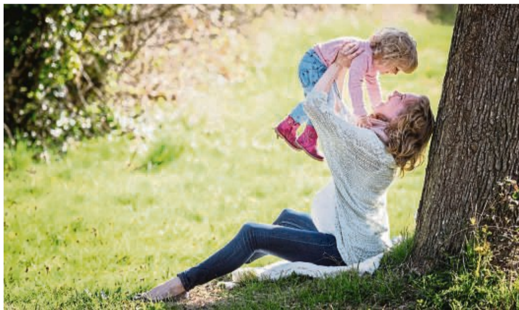
Am 8. Mai wird in diesem Jahr der Muttertag gefeiert. Dabei sorgen besonders die Kinder dafür, dass ihre Mütter ihre Anerkennung spüren.

So feiert man in Norwegen am 2. Sonntag im Februar, in