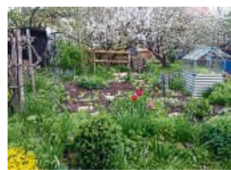
Der Garten von Johanna Konz war 2021 einer der Gewinnerinnen in 2021.

Die Anmeldung erfolgt mit Klarnamen und Wohnadresse bei der Stadt Volkmarzen unter stadt@volkmarsen.de . Aussagekräftige Fotos des jeweiligen Projektes können bis zum 15. September 2022 eingereicht werden. Prämierte werden zwei Kategorien: