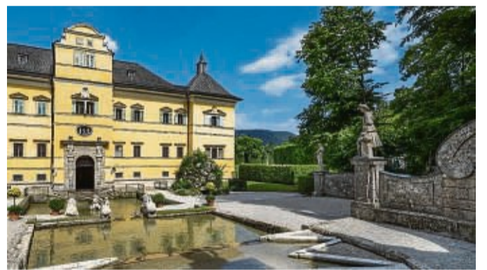
Wunderschöner Touristenmagnet: Das Schloss Hellbrunn im Süden der Stadt Salzburg ist als Ort des Vergnügens und der Erholung schon seit Jahrhunderten bekannt.

Unter www.hellbrunn.at finden sich Öffnungszeiten und Ticketpreise.