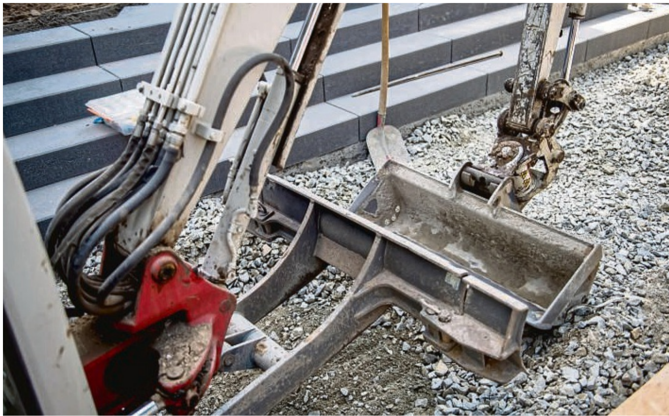
Einen kleinen Bagger hat natürlich nicht jeder zu Hause herumstehen. Ihn kann man aber bei Bedarf leihen.

Sein Rat: „Wer keine Fachkenntnisse hat, sollte ein für ihn neues Werkzeug nie oh-