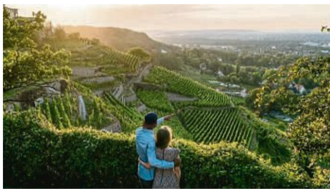
Jahrhundertealte Terrassenweinberge , barocke Baukunst und feine Gaumenfreuden machen einen Ausflug an die Sächsische Weinstraße zum Genuss für alle Sinne.

Die spezielle Verbindung aus Natur und Architektur, Kultur und Genuss in der Region verwandelt Schloss Wackerbarth zu einem besonderen Erlebnis. Jeden Tag begrüßt Europas erstes Erlebnisweingut mit Führungen und Events, einem Weingarten und Gasthaus. Informa-