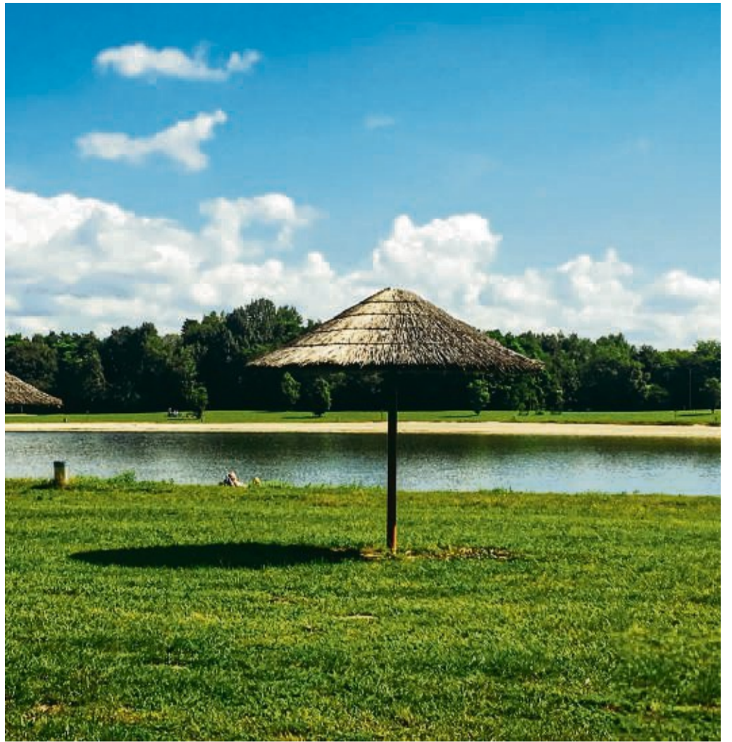
Sommerfreizeiten für Kinder und Jugendliche stehen auch 2022 vor besonderen Herausforderungen. Corona ist untergeordnetes Thema, extreme Preissteigerungen sind für die Kalkulation herausfordernder.