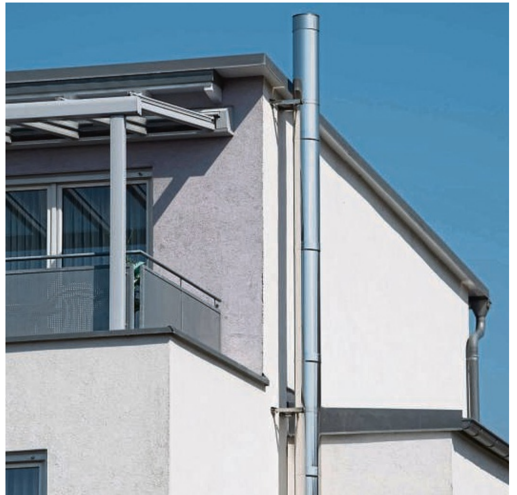
Hoch hinaus: Neue Schornsteine müssen den höchsten Punkt des Dachs um mindestens 40 Zentimeter überragen.