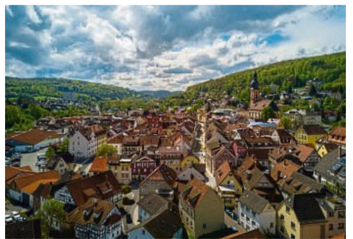
Aus Bad Brückenau führen zwölf Wanderwege in die Ausläufer der bayerischen Rhön.

Danach ist Zeit für wohltuende Wellness und gesundheitsfördernde Heilkuren, etwa in der Saunalandschaft der Therme Sinnflut, in den Heilwasserbecken oder an der Quelle des Georgi-Sprudels, der als erstes Heilwasser