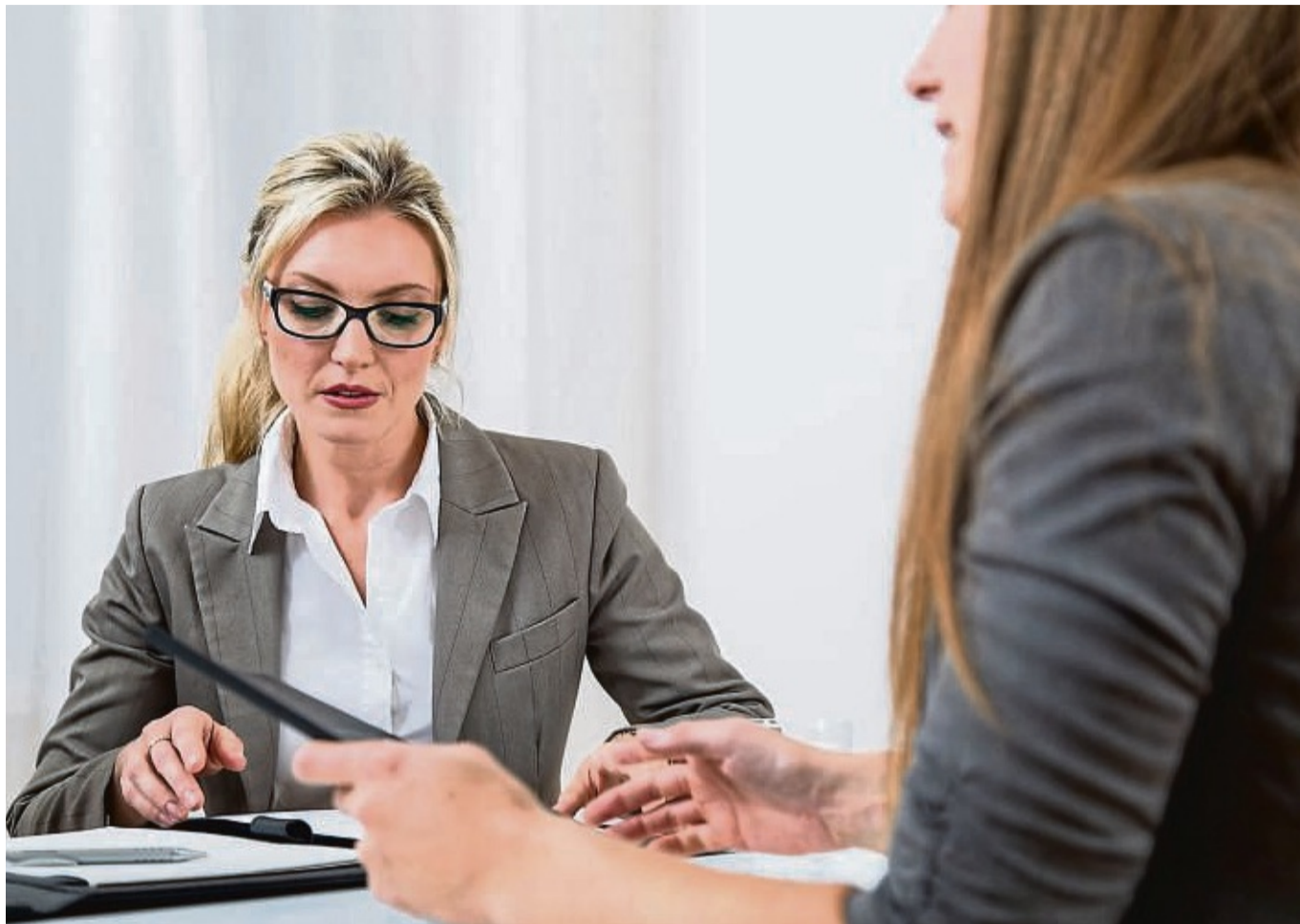
Gut vorbereitet: Wer sich vorab eine grobe Struktur überlegt, kann sich im Bewerbungsgespräch überzeugender präsentieren.

Meist dauert die Selbstpräsentation nicht viel länger als drei Minuten. Wichtig: Die