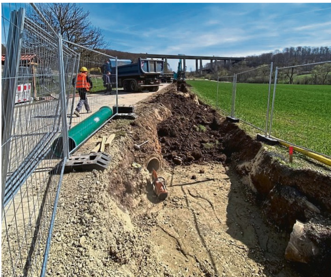
Bauarbeiten an der Autobahn und bei Rhöda: Der Regenwasserkanal für die Parkplätze an der Autobahn wird in Rhöda angeschlossen.

Die A 44 zwischen Kassel und Dortmund bildet eine zentrale Verkehrsachse im europäischen Ost-West-Verkehr. Dies wird unter anderem durch den hohen Anteil