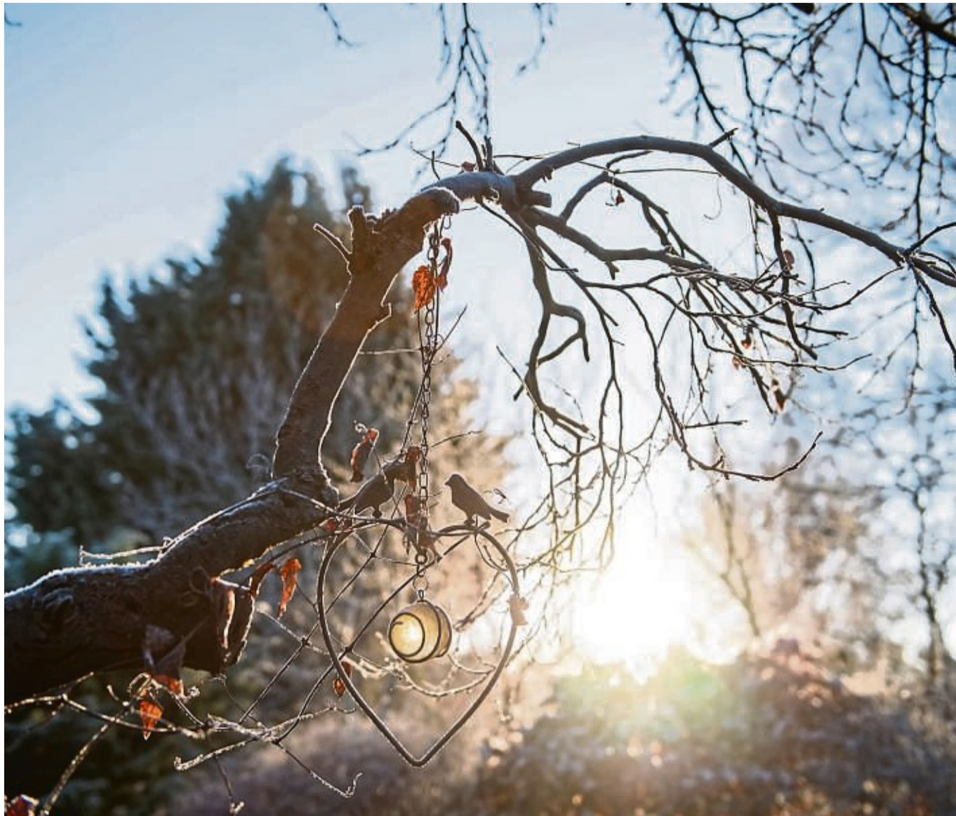
Frostige Morgen kommen auch noch im Frühling vor. Und das gefährdet kälteempfindliche Pflanzen im Garten.