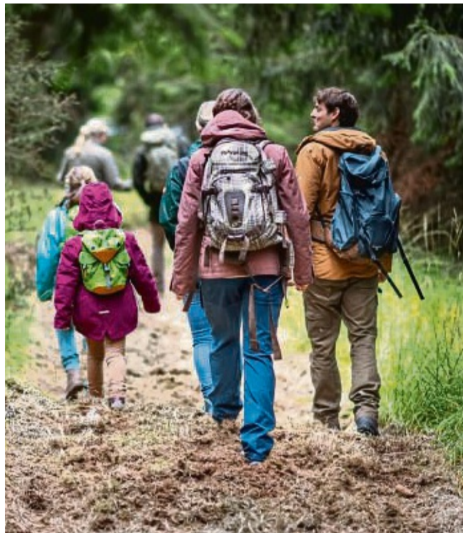
Beliebt sind Wanderungen im Naturpark Reinhardswald, besonders wenn sie unter sachkundiger Führung stattfinden.

Rund 30 Gästeführerinnen und -führer sind im Einsatz, um den Besuchern die Besonderheiten im Naturpark Reinhardswald zu zeigen. Lustige Anekdoten, kuriose Fakten und märchenhafte Geschichten machen die Führungen kurzweilig und interessant. Die zertifizierten Natur- und Landschaftsführer, Umweltpädagogen, Entspannung-