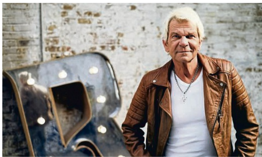
Verspricht eine rauschende Party: Schlager-Ikone Matthias Reim startet am 8. Juni das Programm im Wolfhager Kulturzelt.

Matthias Reim, der inzwischen das Genre gewechselt und den deutschen Schlager für sich entdeckt hatte, schrieb erst mal für andere, belieferte damals angesagte Schlagerinterpreten wie Roy Black, Jürgen Drews und Bernhard Brink mit Kompositionen. Aber dann war auch Matthias Reim an der Reihe und stellte all jene, für die er zwischenzeitlich komponiert