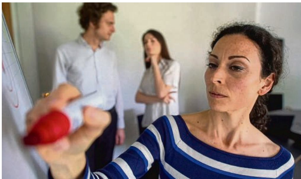
In der Probezeit geht die Recruitment-Phase in die Verlängerung: Beschäftigte sollten sich bewusst sein, dass sie unter Beobachtung stehen.

„Dabei sollte ich mich nicht darauf verlassen, dass der Arbeitgeber mir alles auf dem Silbertablett serviert,