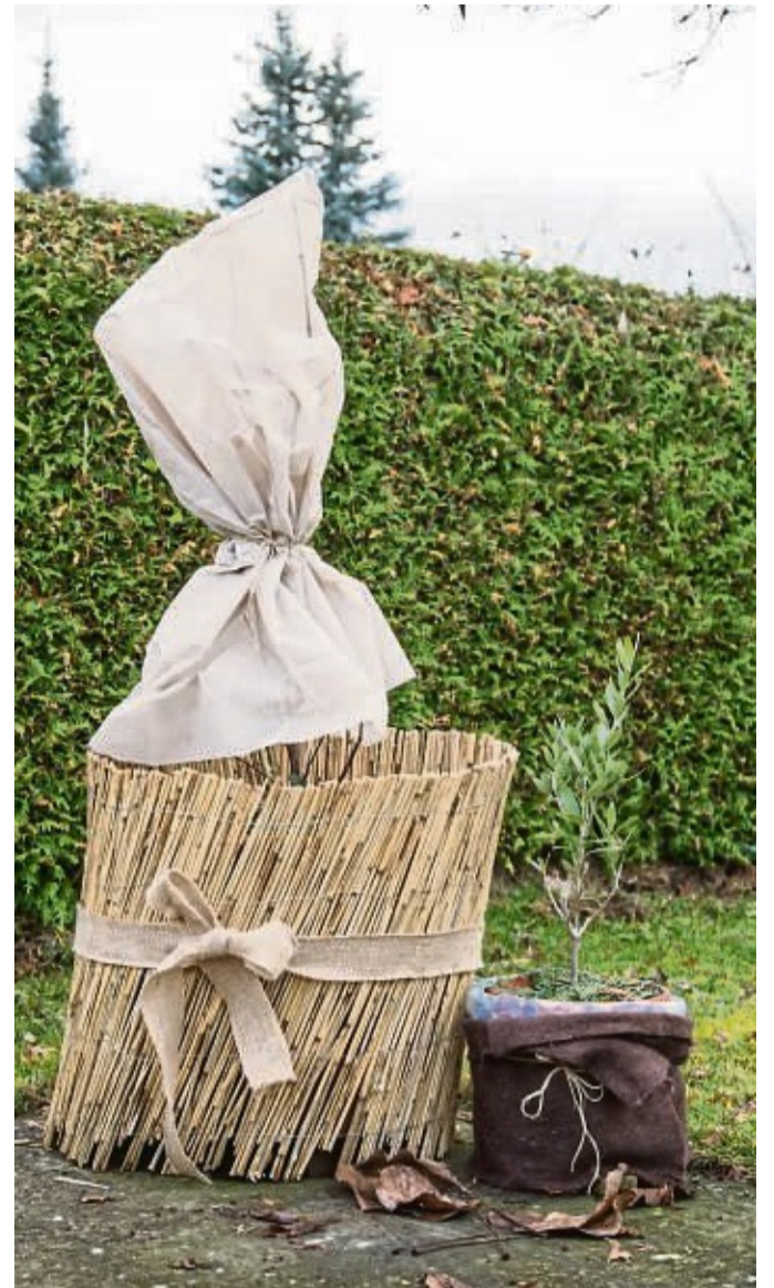
Bei Frostgefahr sollte man kälteempfindliche Pflanzen warm einpacken.