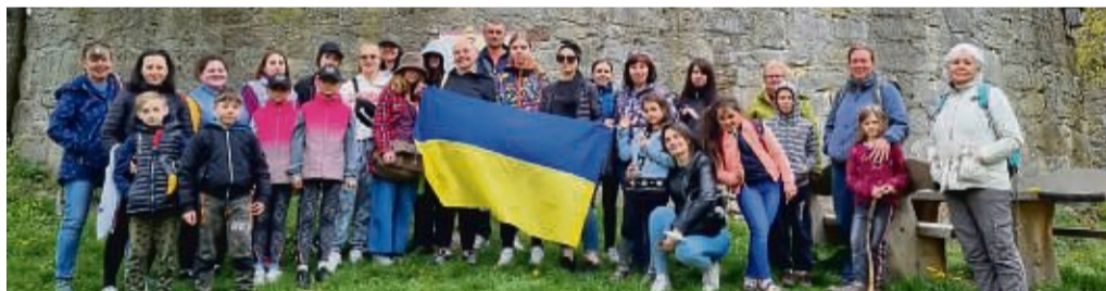
Mit den Landesfarben unterwegs: Ukrainische Flüchtlingsfamilien, Mitglieder der Naturfreunde Bad Emstal und Mitglieder des Flüchtlingsunterstützerkreises Bad Emstal besuchten die Ruine Falkenstein.