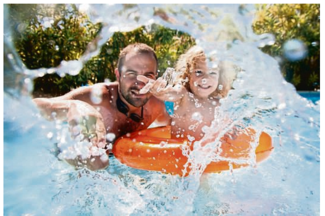
Wenn der Sommer näher rückt, dann heißt es auch endlich wieder: Ab ins Wasser und das mit der ganzen Familie.

Hingehen, Eintritt zahlen oder Jahreskarte vorzeigen und von den vielen Vorzügen der Freibäder profitieren. Ganz unkompliziert. Es schadet sicherlich nicht, wenn in der Regel freiwillig im Freibad, wie auch andernorts eine Maske in Innenräumen getragen wird und auf die Abstands- bzw. Hygieneregeln geachtet