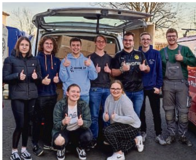
Transporter vollgepackt: Die Schüler des Ethikkurses und ein Helfer.

Zum einen rief der Ethikkurs der Oberstufe zum Sammeln von Sachspenden auf. Schülerinnen und Schüler, Lehrkräfte, Eltern, Verwandte und Freundinnen und Freunde hatten die Möglichkeit, einen kleinen Teil zur Hilfe für die Ukraine beizutragen. Dabei entstand eine