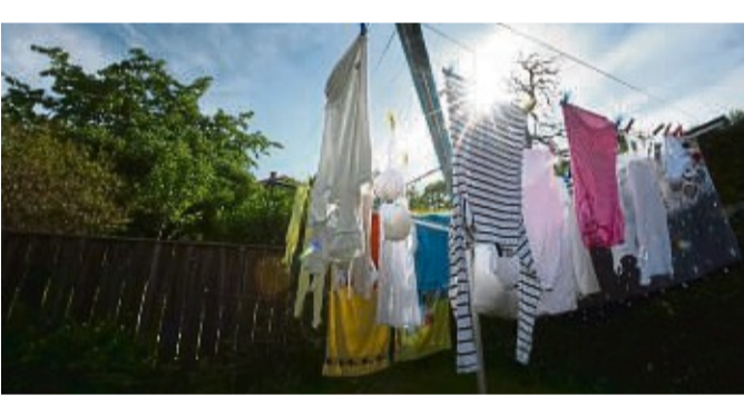
Die Wäsche draußen trocknen zu lassen, spart nicht nur Stromkosten.