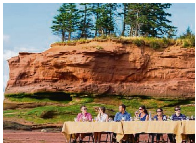
Dinieren auf dem Meeresboden – das ist bei Ebbe in der Bay of Fundy in Nova Scotia möglich.