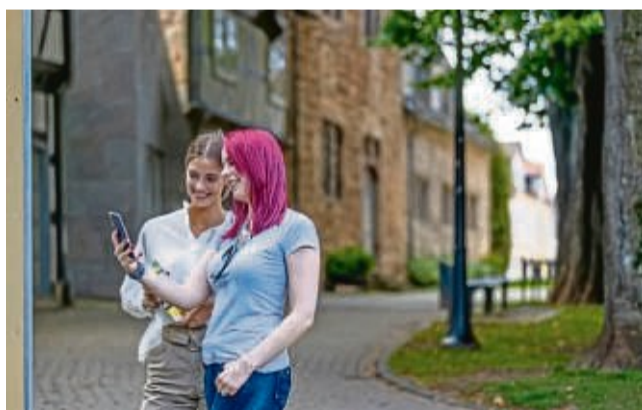
Auf einer Stadtkrimis-Route durch Korbach.

Im Kriminalfall „Mord in der Spalte“ wird ein Forscher nach seiner Ankündigung, eine bahnbrechende Entdeckung gemacht zu haben, die die Evolutionsgeschichte der Säugetiere in ganz neuem Licht erscheinen lässt, plötzlich tot in der