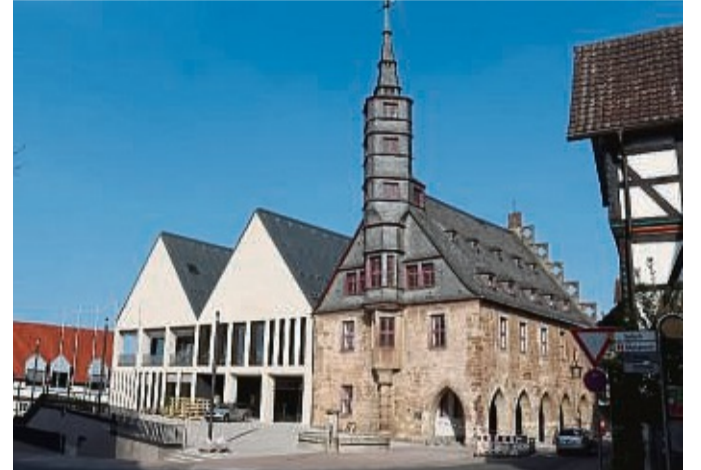
Nach knapp drei Jahren Bauphase zeigt sich das Gebäude mit seinen drei Frontgiebeln nun weithin sichtbar und ergänzt das Stadtbild. Neue städtebauliche Akzente wurden gesetzt und die zuletzt unbefriedigende bautechnische, energetische und funktionale Situation des Vorgängeranbaus sind nun Vergangenheit.

Es ist ein Haus der Begegnung, der Kommunikation, aber auch der politischen Mitwirkung, das in dieser Woche eröffnet wurde.