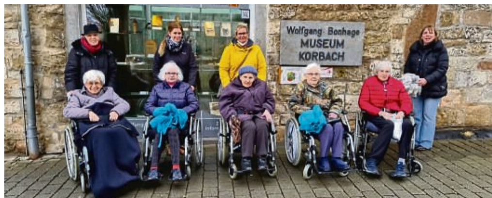
Eindrucksvoller Nachmittag: Seniorinnen aus dem Haus am Nordwall und ihre Begleiterinnen vor dem Wolfgang Bonhage-Museum in Korbach.

Einige der in der Ausstellung zu Wort kommenden Zeitzeugen wohnen heute im Korbacher Haus am Nordwall oder stehen in Verbindung zu der Einrichtung. Vielen der Senioren war es ein Anliegen, mehr über andere Zeitzeugen zu er-