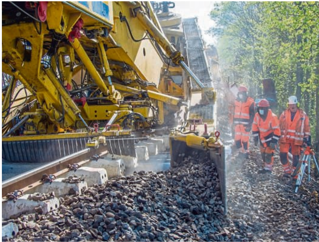
Aus alt mach neu: Der Schotter wird mit einer Förderkette ausgeräumt, die unter den Schienen hindurchläuft. Vorher hat ein Umbauzug bereits neue Schienen und Schwellen gelegt.