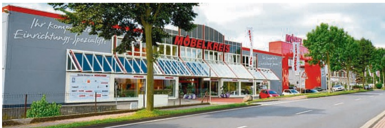
Beliebtes Einrichtungshaus in der Region: Möbelkreis in Meininghausen.

Dabei handelt es sich um Möbel aus dem gesamten Sortiment des Einrichtungshauses. Eine besondere Gelegenheit bietet sich vor al-