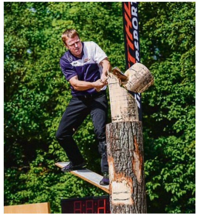
Sportholzfäller in Aktion: Die Schlepperfreunde Auenberg veranstalten am letzten Mai-Wochenende in Odershausen die Waldecker Holztage mit Traktorenausstellung und Timbersport.

Am Sonntag, 29. Mai, beginnt das Programm in Odershausen ab 9.30 Uhr mit stündlichen Touren der Mini Hot Rod's. Timbersport ist wieder ab 10 Uhr bei Vorführungen auf der Aktionsbühne zu bestaunen. Eine kleine