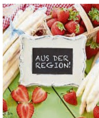
Frischen weißen Spargel und reife rote Erdbeeren – diese und viele andere Produkte gibt es auch im hiesigen Landkreis zu entdecken und zu probieren.

das von den regionalen Müllereien zu Mehl gemahlen wird. Ideale Zutaten für Teigkünstler – ob im eigenen Ofen oder in den traditionellen Bäckereien. Steak, Schnitzel, Wurst und Co. kann in Waldeck-Frankenberg aus artgerechter Tierhaltung und Wild ohne Umwege auf den Grill wandern. Für Veggie-Fans zaubern die hofeigenen Käseereien leckere Alternativen aus Ziegen- und Kuhmilch. An den Wochenenden laden zahlreiche Bauernmärkte zum Probieren und Verweilen ein. Das Gute: einig der regionalen Erzeugnisse aus Waldeck-Fran-