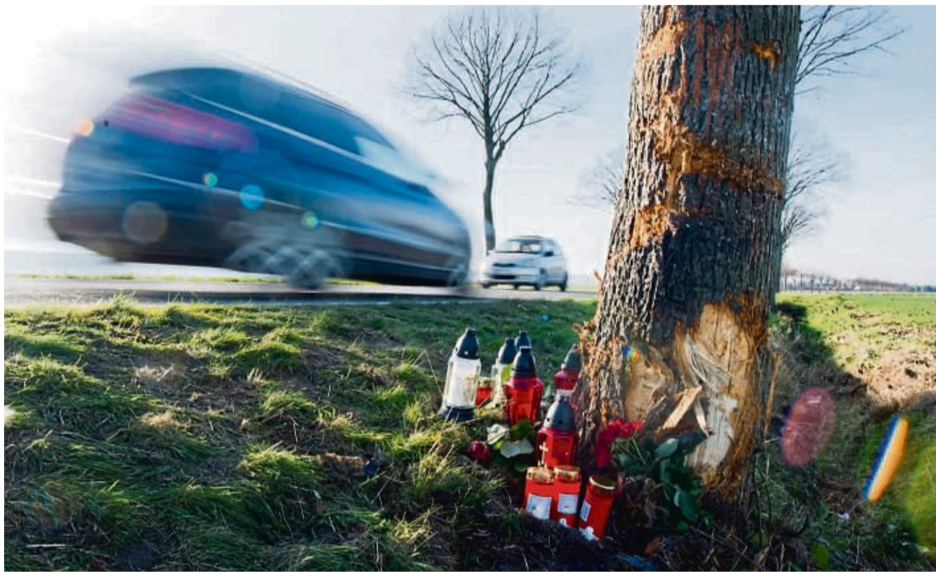
Trotz gesteigener Unfallzahlen, ereigneten sich im Landkreis die wenigsten tödlichen Unfälle seit Jahren.

Dass bei Verkehrsunfällen in Waldeck-Frankenberg im vergangenen Jahr deutlich weniger Menschen getötet und verletzt wurden, ist bemerkenswert – schließlich stieg die Zahl der Unfälle insgesamt um 182 (plus 5,5 Prozent) leicht an: von 3303 im