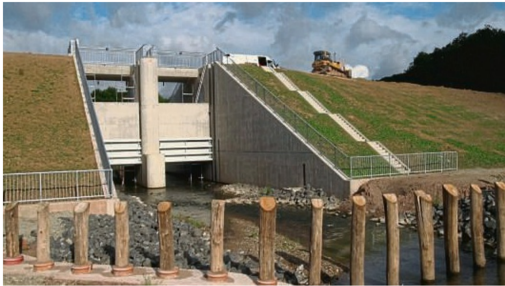
Bauphase am Hochwasserrückhaltebecken Ehringen kurz vor der Einweihung 2008. Eine reguläre Überprüfung findet nunmehr statt, dafür muss der Stau reduziert werden. Das Bild zeigt im Vordergrund den Grobrechen und in der Mitte das Ablaufbauwerk, das den normalen Durchfluss der Erpe erlaubt.