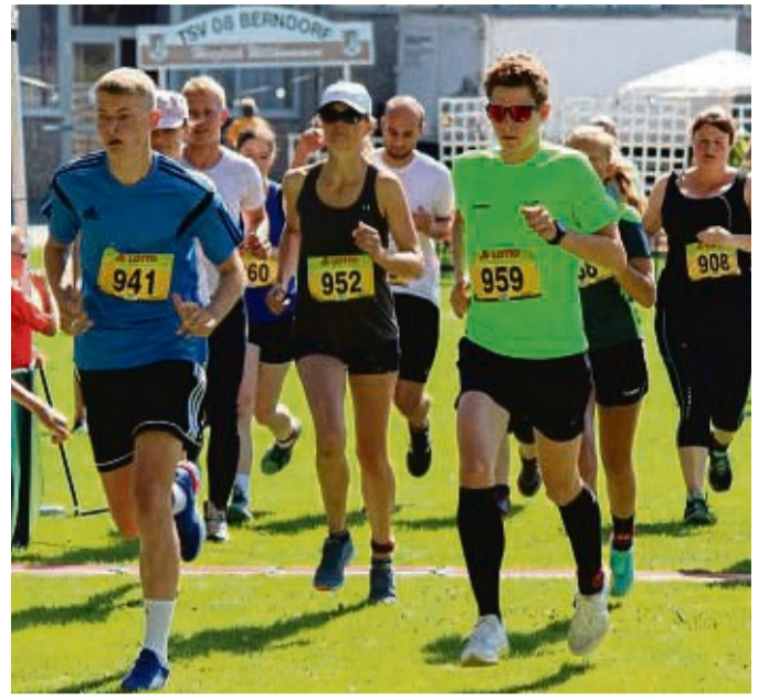
Proberennen: Teilnehmer des Berndorfer Volkslaufs zum 111. Geburtstag des Vereins im Juni 2019. Am 15. Mai gibt der TSV sein Laufcup-Debüt.

Diese Lose müssen vor den Verlosungen, die Samstag um 17.30 Uhr und Sonntag um 17 Uhr auf der Bühne in der unteren Pforte stattfinden, in die Lostrommel an der Bühne eingeworfen werden. Es warten tolle Einkaufs- und Warengutscheine auf die Gewinner. red