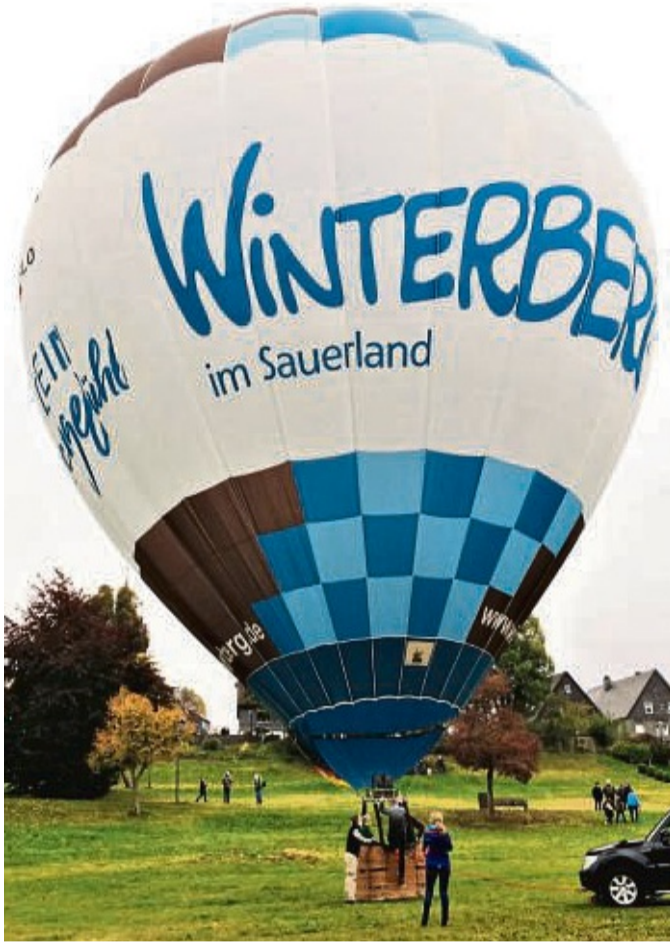
Der Heißluftballon „Flocke“ wird ein Highlight des Winterberger Stadterlebnisses sein.