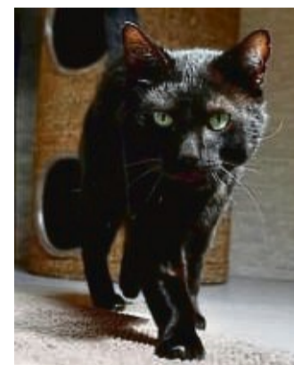
Das Tierheim Korbach sucht ein neues Zuhause für Kater Bilbo.

Interessierte melden sich unter Tel. 05631/7847 beim Tierheim Korbach.