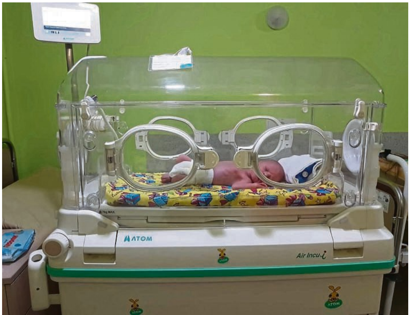
Wichtig für Frühgeborene: Inkubatoren werden in der Kinderklinik im ukrainischen Lwiw benötigt.

Sie haben vieles selbst ausprobiert und Fragen gestellt. Das sei sehr effektiv gewesen. Nach einer kurzen Auffrischung in der gesetzlichen Verpflichtung zur Ersten Hilfe, Absetzen eines Notrufes sowie Absichern der Unfallstelle durch DRK-Rettungssanitäter Nico Bartsch, haben die Jugendlichen sogleich im Wortsinn Hand angelegt. Sie probierten sie sich an den unterschiedlichen Arten und Möglichkeiten der Wundversorgungen und den verschiedenen ersten Schritten im Umgang mit lebensbedrohlichen Erkrankungen wie Herzinfarkt und Schlaganfall. red