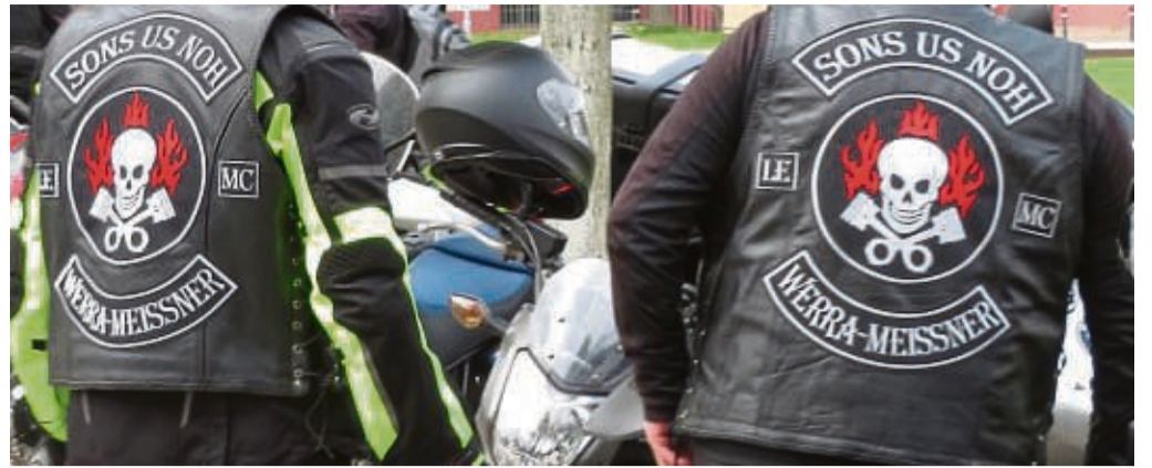
„Sons us Nordosthessen“: die Biker stehen auf der guten Seite des Gesetzes und wollen sich für karitative Zwecke einsetzen.

Die Freude am Motorradfahren steht bei der Bruderschaft im Fokus. Mehrere Wochenendtouren sind schon in Planung. Eine längere Tour über fünf oder sechs Tage soll in Eschweger Partnerstadt Regen führen. Auf die Landstraßen im Bayerischen Wald freuen sich die Biker schon. Nebenbei wollen sie aber mit ihrem Hobby auch Gutes tun. Deswegen planen sie bereits eine sogenannte Charity-Fahrt. Sie wollen eine geführte Tour für die Biker aus der Region und auch darüber hinaus anbieten. Dabei geht es zu den schönsten Attraktionen in Nordosthessen. Die Teilnahmegebühr soll dann karitativen Zwecken gespendet werden. Ein genauer Termin für die Ausfahrt steht noch nicht fest.