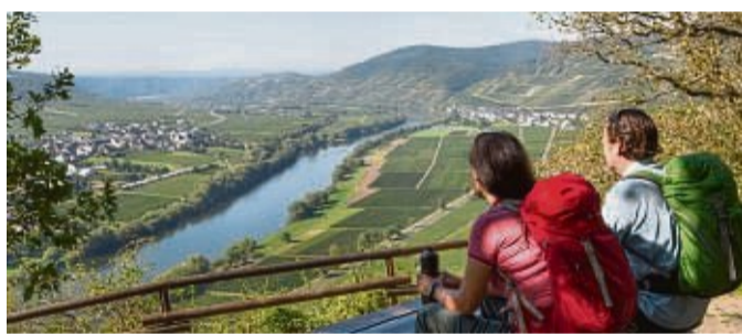
Panoramablick ins Moseltal: Das Ferienland Bernkastel-Kues ist ein Wanderparadies.

Radeln, Wandern, durch romantische Städtchen spazieren und zwischendurch traumhafte Aussichten, den berühmten Moselwein und die köstliche Moselküche genießen: Wer Lust auf einen entspannten Aktivurlaub hat, ist im Ferienland Bernkastel-Kues richtig. Radfans kommen auf den überwiegend flachen Radwegen entlang der Mosel auf ihre Kosten. Mit dem E-Bike lässt sich aber auch gut die hügelige Landschaft der angrenzenden Regionen Eifel und Hunsrück entdecken. Wer lieber die Wanderschuhe schnürt,