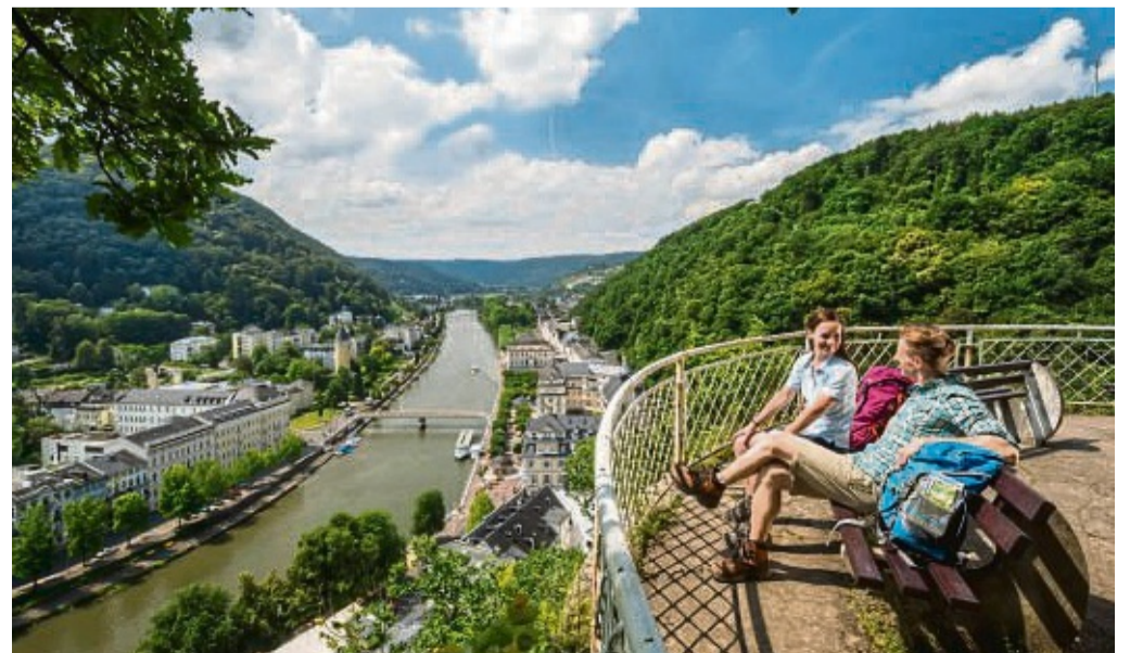
Einer der Höhepunkte am Lahnwanderweg: der Ausblick auf Bad Ems.

Auf den Spuren einer weiteren Sage führt der Dörsbach-Mühlenweg von Katzenelnbogen nach Obernhof durch das Jammertal: Dessen Name erinnert an eine traurige Legende, die von erfrorenen Kindern erzählt. Von Nassau aus kann man auf der „Vier-Täler-Tour“ in fünf Stunden bis nach Obernhof wandern: Durch stille Wälder geht es ins felsige Mühlbachtal, hinauf zum Kloster Arnstein und durch das einzige Weinbaugebiet an der Lahn. Oder man wählt in Nassau einen leichten, zweistündigen Rundweg auf dem Philosophenweg um den Burgberg im romantischen Mühlbachtal.