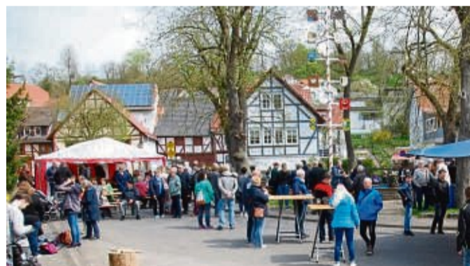
Maibaumfest in Ulfen: Kam bei den Besuchern sehr gut an.

Gemeinden und den Ulfenern selbst. Das Fest begann mit einer Andacht unter der Linde am Anger, umrahmt durch den Männergesangsverein Ulfen. Anschließend gaben die Ulfener Jungs ein Ständchen mit zünftiger Blasmusik. Lustig ging es am Nagelklotz zu. Erlebnisreich waren die angebotenen Touren im Ulfener Umland und dem Premiumwanderweg 20 mit dem historischen Lanz Bulldog Spannung von Michael Stein. So-