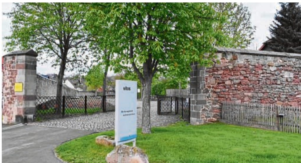
Blick auf den Eingang zur Klosteranlage: Gleich hinter der Mauer sollen Wohnhäuser entstehen. Dort wurden bereits Garagen und eine Scheune abgerissen.

Vorarbeiten hat Vitos auf dem Breitenau-Gelände bereits erledigt. So wurden die dort befindlichen Garagen und eine Scheune hinter der die Klosteranlage umgebenen Mauer abgerissen, um Platz für Neubauten zu schaffen. pdi