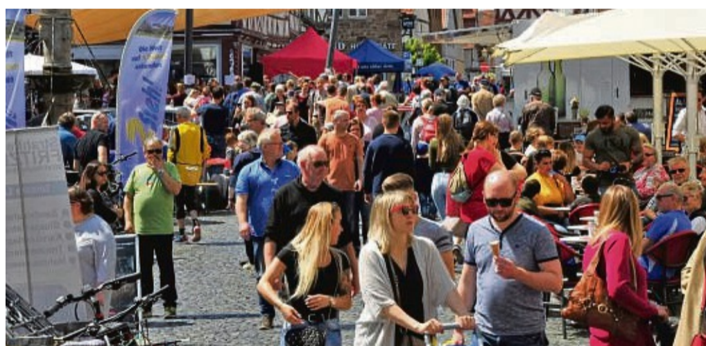
Reges Treiben: Die letzte InForm 2019 avancierte zum Publikumsmagneten. Für dieses Jahr wünschen sich die Veranstalter einen ähnlichen Zuspruch.

Süße und deftige Leckereien bieten die Gastronomen der Altstadt und die vielfältigen Essens- und Getränkestände an. Bratwurst,