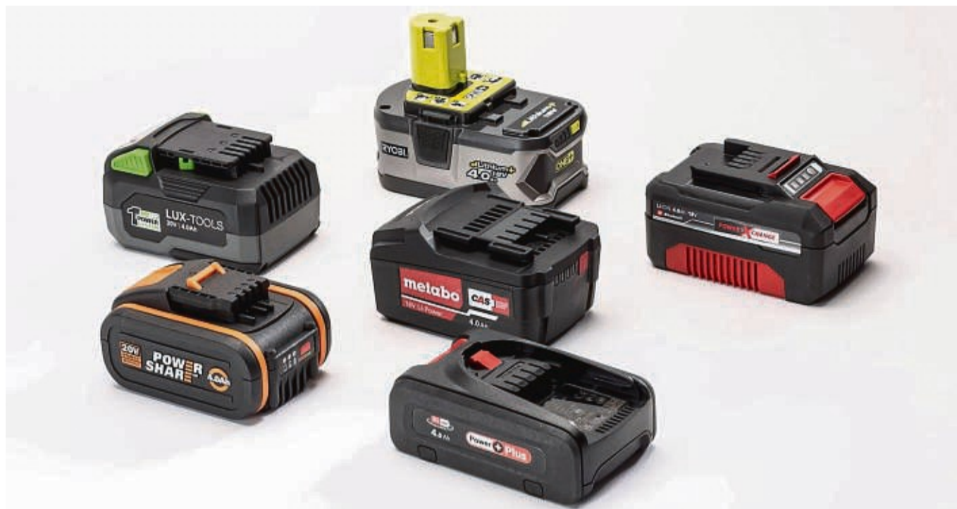
Volle Power: Die Zeitschrift „Selbst ist der Mann“ hat gemeinsam mit dem TÜV Rheinland sechs Akkus für Heimwerker- und Gartengeräte getestet.

Aber: Die Akkus sind teuer und sie halten zwar lange, aber nicht ewig. Die Zeitschrift „Selbst ist der Mann“ (Ausgabe 6/2022) hat gemeinsam mit dem TÜV Rheinland Werkzeugakkus von sechs