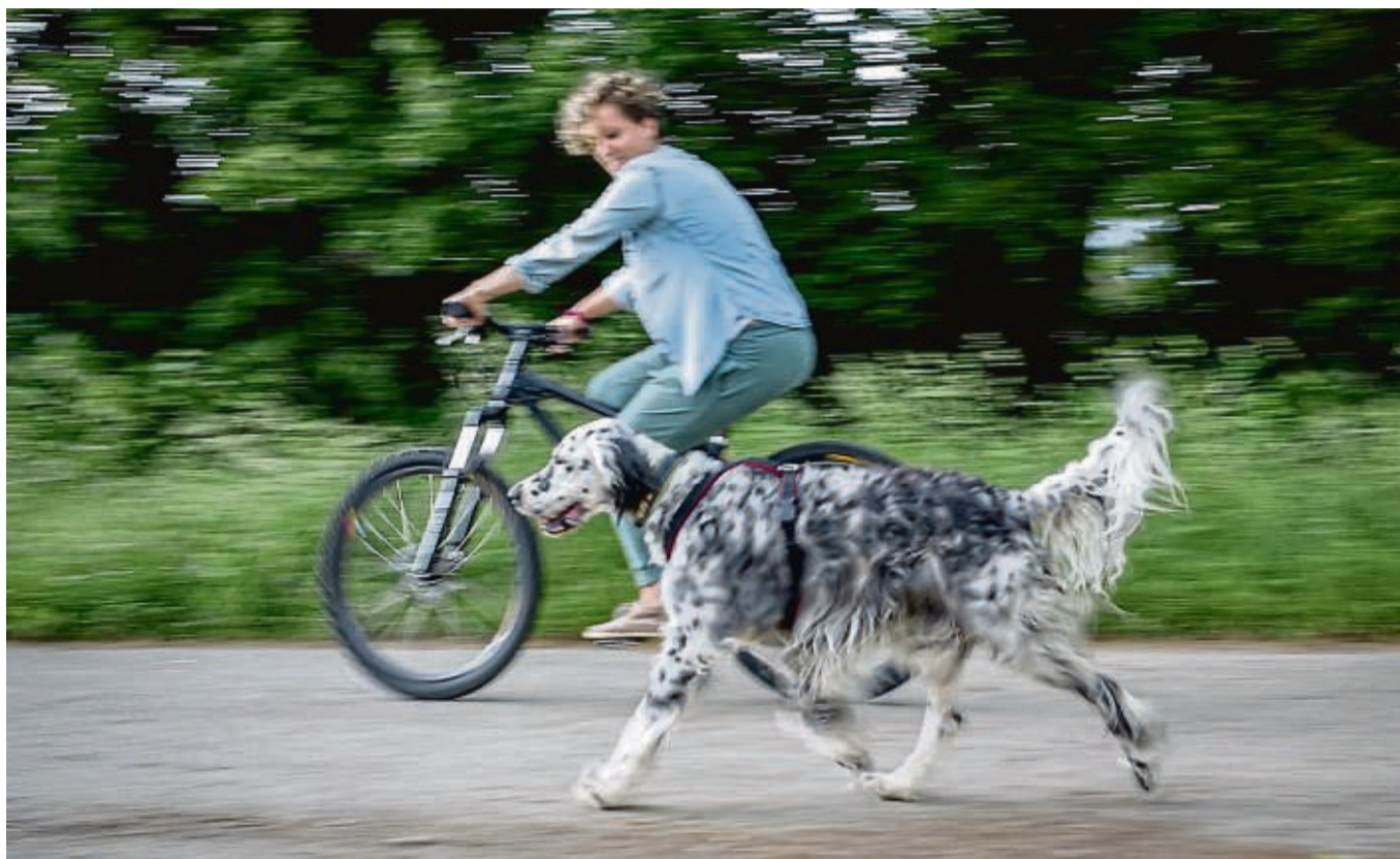
Das gemeinsame Fahren mit Rad und Hund sollte zunächst in einer verkehrsberuhigten Zone oder auf einem Parkplatz geübt werden.

Auch die Rasse spielt eine Rolle: Während Familien-