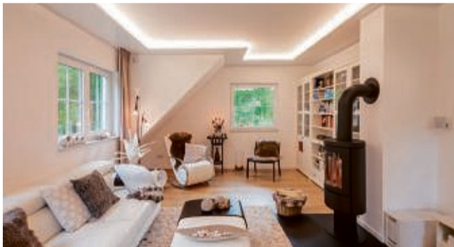
Mit Licht dein Wohnzimmer verzaubern.

Plameco bietet dir dazu flexible Zimmerdecken in vielen verschiedenen Farben und Dessins. Ob matt, hochglänzend, mit Zierprofilen, oder LED-Beleuchtung: Die Decken sind so vielseitig, dass du sie harmonisch jedem Wohnstil anpassen kannst. Wohn-, Schlaf- und Esszimmer sowie Küche, Flur und Bad erhalten damit schnell ein neues Gesicht. Montiert werden sie einfach unterhalb der vorhandenen Decke. Kein ausräumen nötig, lediglich die Möbel werden abgedeckt. Das machen