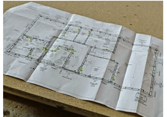
Der maßstabsgetreue Grundriss ist eine wichtige Planungsgrundlage für Bauherren.

Ebenso macht die Platzierung von Steckdosen, Licht- und Rollladenschaltern so-