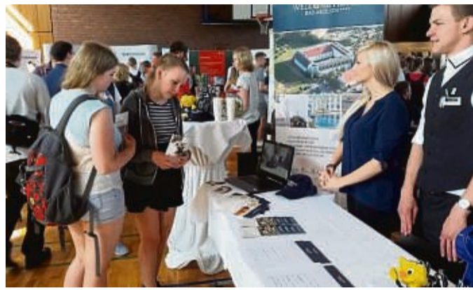
In Ruhe informieren und interessante Betriebe kennenlernen – dazu bietet die Ausbildungsbörse am morgigen Mittwoch, 1. Juni, in Bad Arolsen gute Gelegenheit.