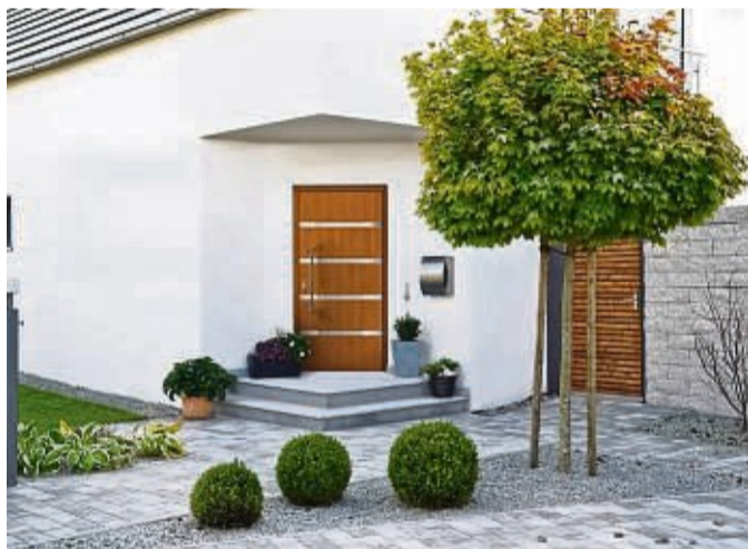
Eine natürlich anmutende Tür in modernem Design vereint Gestaltung und Funktionalität.

Viele Haustürmodelle zeichnen sich heute durch ihre Geradlinigkeit sowie ei-