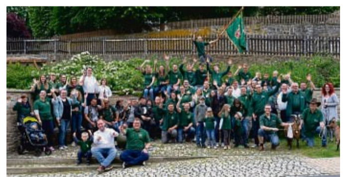
Vereinsbild der Ziegenzuchtfreunde „Weiße Wolke“ Bergheim 1979 e.V. aus dem Jahr 2019.

Der Sonntagnachmittag beginnt ab 14 Uhr mit dem ZZF-Menschenkicker-Pfingstturnier auf dem Festplatz. Für eine Mannschaft werden fünf Teilnehmer benötigt (ein Torwart, vier Feldspieler). Die Anmeldung der Mannschaften ist ab 13 Uhr vor Ort möglich.