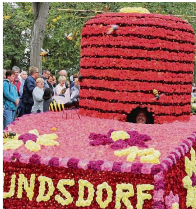
Das Bild einer vollen Brunnenallee, entlang der das Publikum dicht gedrängt den Zug der mit Dahlien prächtig gestalteten Motivwagen verfolgt, hier im Jahr 2018, wird es auf lange absehbare Zeit nicht mehr geben. An die Stelle des Korsos tritt das „Bad Wildunger Blumenfestival“.

Die meisten Stadtteile hätten ihre Teilnahme in der Tradition des Korsos zugesagt. Ihre Motivwagen stehen an den drei Festtagen über die kleine Brunnenallee verteilt. Weitere Gruppen, Geschäfte oder Gastronomiebetriebe seien mit eigenen Ideen willkommen. „Zusätzlich zu den Wagen sollen auf