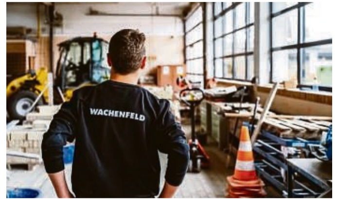
Mit dem fachlichen Abschluss in der Tasche stehen frisch gebackenen Baufachleuten alle Türen offen.

Für den Ausbildungsstart zum 01.09.2022 sind noch in vielen Berufen freie Ausbildungsstellen auf unserem Karriereportal zu finden www.continental-ausbildung.de .