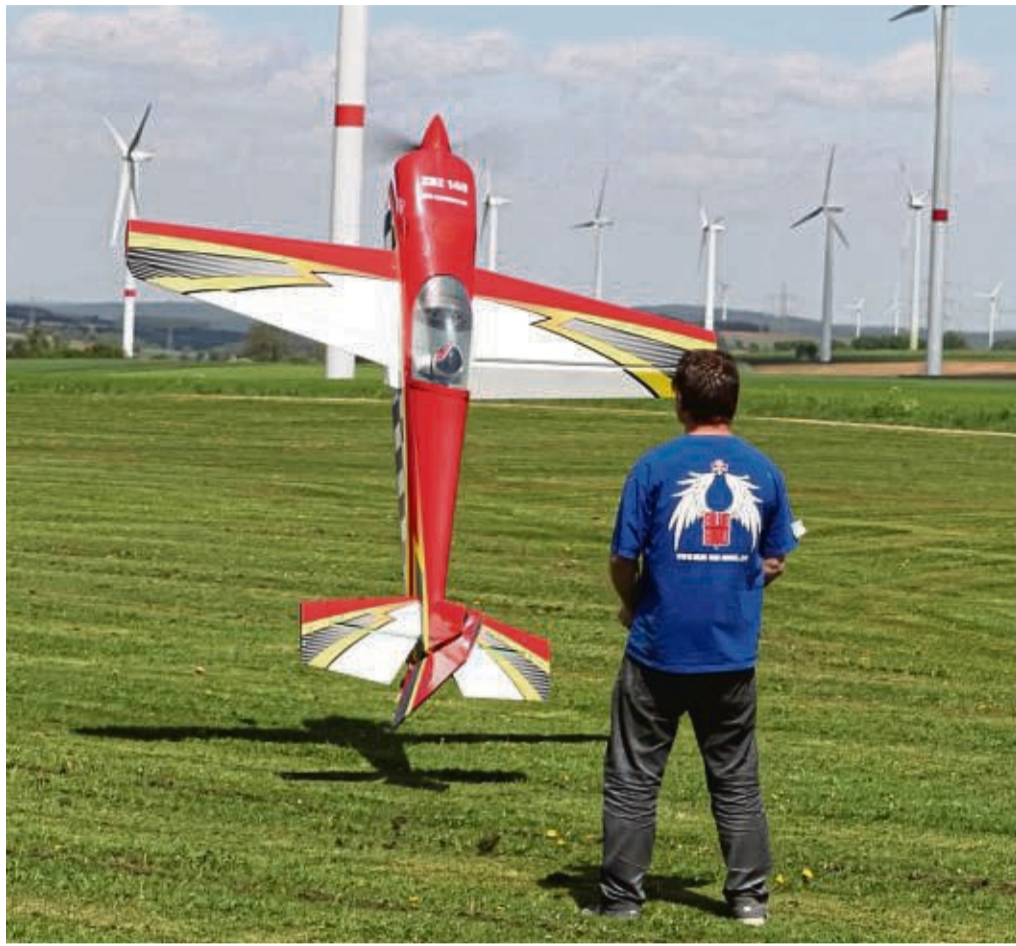
Beim Modellfliegen ist das Training genauso wichtig wie bei jeder Sportart. Könner, wie Christian Calder, lassen das Flugzeug auch mal in der Luft stehen mit nur einer handbreit Abstand zum Boden.

Mal kreisen Modellflugzeuge mit hoher Geschwindigkeit