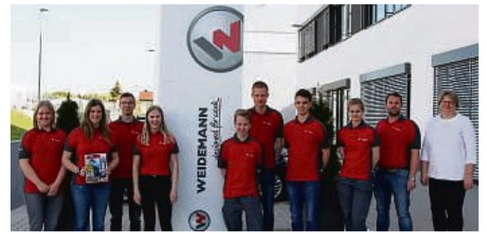
Die Ausbilder und Auszubildenden von Weidemann freuen sich sehr über die Auszeichnung.

Auf jeden Fall. Die Zusammenarbeit mit meinen Kollegen und die Arbeit für die Bürgerinnen und Bürger der Stadt bereiten mir immer eine große Freude. Daher war es definitiv die richtige Entscheidung, hier bei der Stadtverwaltung Bad Arolsen meine Ausbildung zum Verwaltungsfachangestellten zu machen.