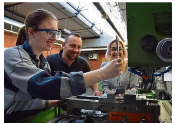
Das BBW Nordhessen bietet jungen Menschen mit gesundheitlichen Einschränkungen oder besonderem Förderbedarf gute Perspektiven.

Auch der Nachhaltigkeitsgedanke wurde beim Entwurf berücksichtigt: Das Gebäude wird mit einer Holzfassade ausgestattet, die flachen Dachbereiche werden begrünt, eine Photovoltaikanlage kann nachgerüstet werden. Rund 350 jungen Menschen soll hier ab 2024 ein erfolgreicher Start in ein selbstbestimmtes Leben durch eine fundierte Ausbildung ermöglicht werden.