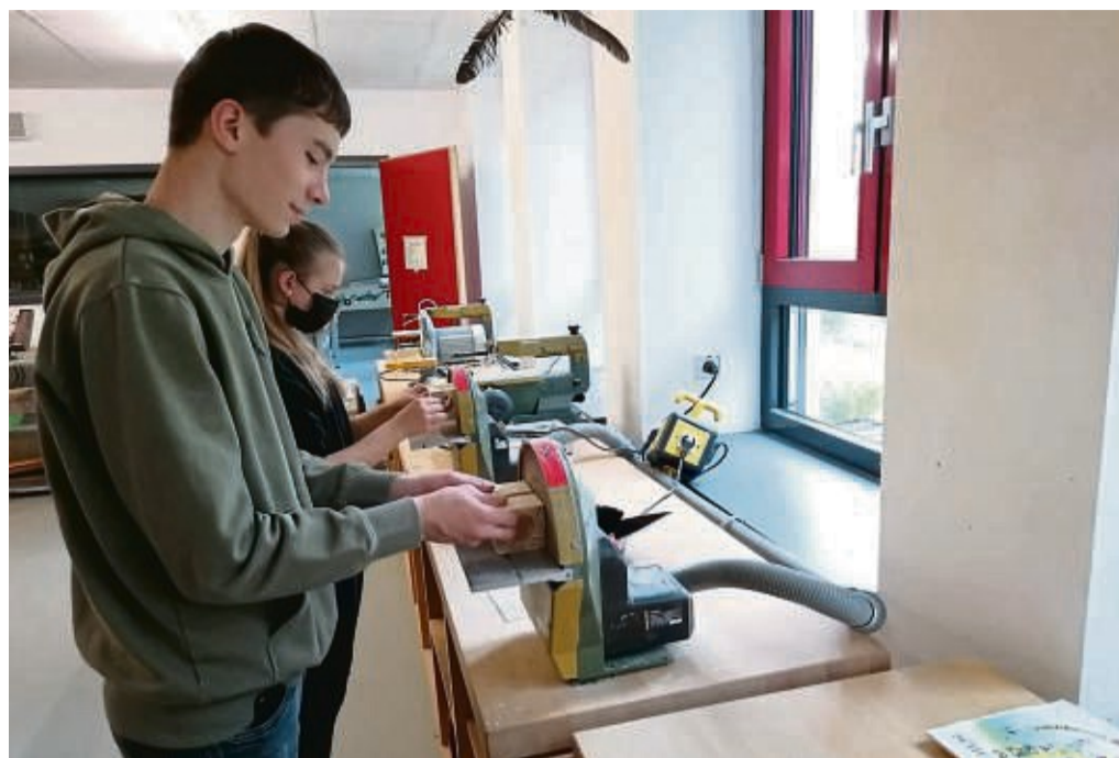
Neues ausprobieren: Ein Workshop „Arbeiten mit Holz“ wird auch in diesem Jahr wieder beim Discovery Day der Evangelischen Jugend angeboten.

Angebot für Jugendliche am 25. Juni beim Discovery Day