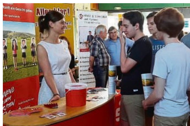
41 Betriebe stellen ihre Ausbildungsangebote vor. Der Austausch zwischen Unternehmen und Schülern findet in lockerer Atmosphäre statt.

Gemeinsam haben die Schulen, das Berufsbildungswerk Nordhessen (BBW), die Agentur für Arbeit, die Industrie- und Handelskammer Kassel-Marburg, die Kreis-Handwerkerschaft Waldeck-