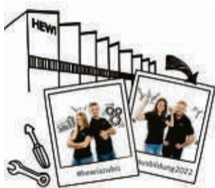
„Unsere Azubis sind Teil des Teams“, so HEWI.

„Wir können auch mit Stolz sagen, dass in fast jedem Auto ein Bauteil von HEWI steckt“, so das Unternehmen. HEWI Kunststoff-