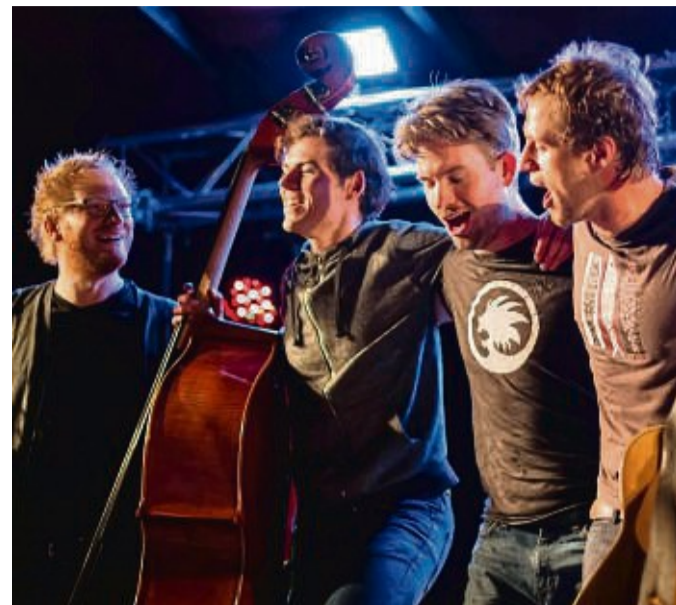
„Ramm Tamm Tilda“ verspricht Musik, die überall und zur Not auch ohne Strom funktioniert.

80 Künstler treten am 3. und 4. September in Korbach auf