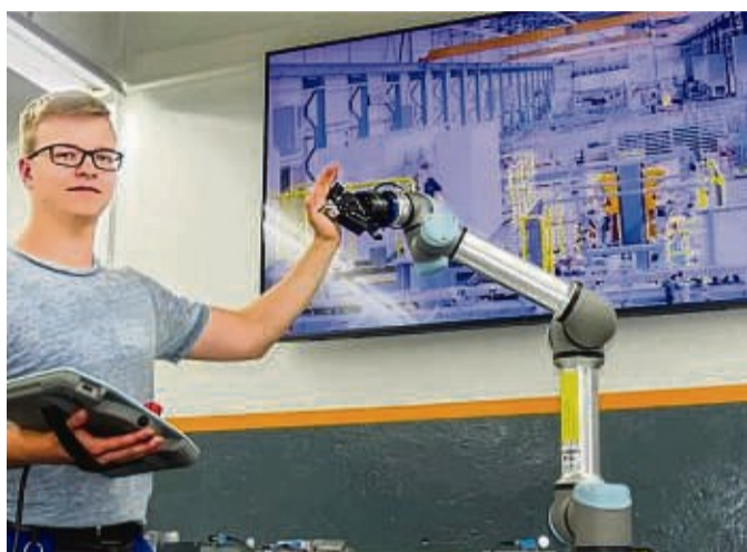
Auszubildende und duale Studenten finden bei Continental ein zukunftsorientiertes und digitales Arbeitsumfeld vor.

In die Schwerpunktbereiche der technischen und