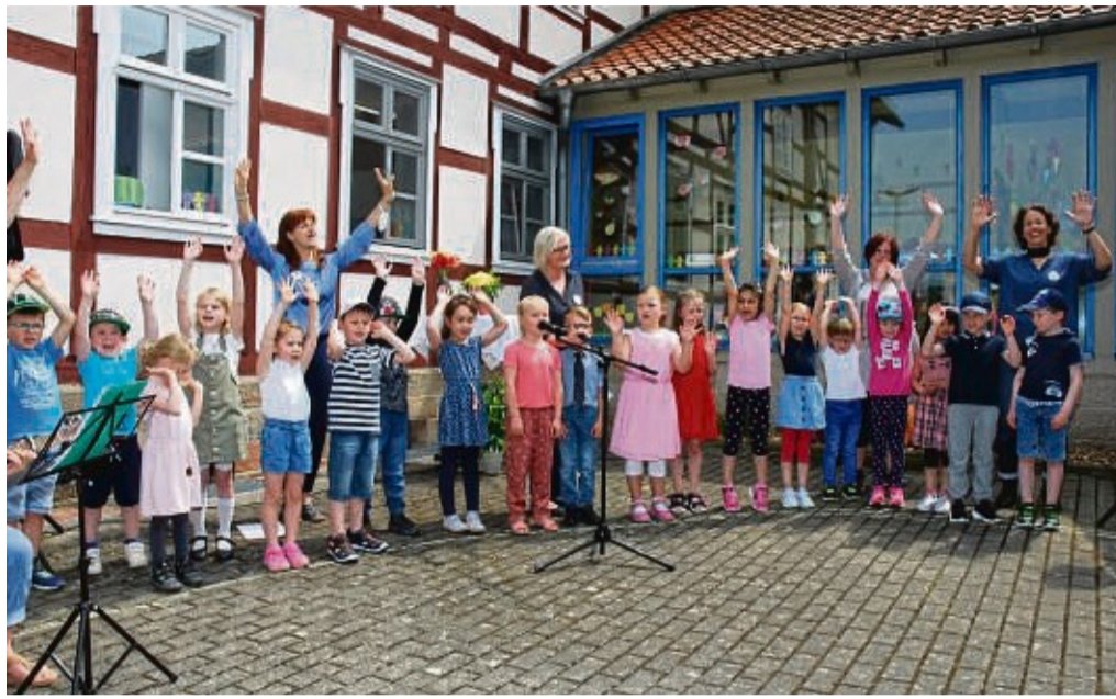
Mit Singen und Spielen umrahmten die älteren Jungen und Mädchen die 150-Jahr-Feier des evangelischen Kindergartens Helsen.