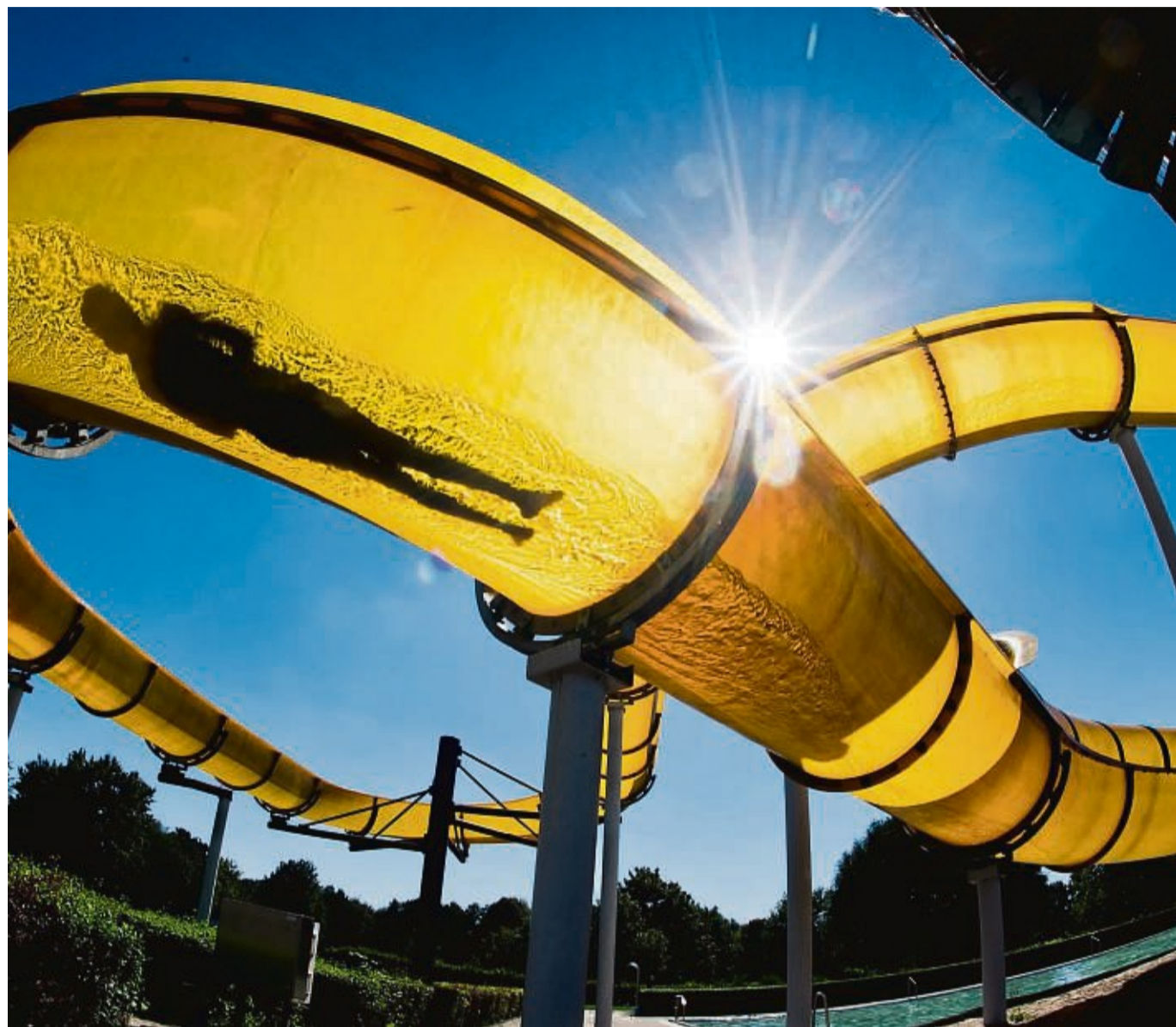
Mit mehr Körperspannung geht es noch schneller. Wer auf der Wasserrutsche ordentlich Tempo sammeln will, sollte nur mit einer Ferse und beiden Schulterblättern die Rutsche berühren.