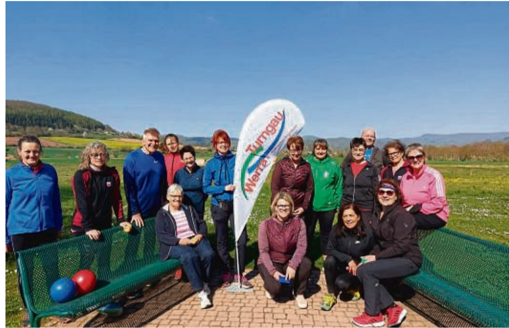
Die Teilnehmer der Übungsleiter-Fortbildung „Outdoorfitness“ des Turngau Werra in Oberdünzsbach.