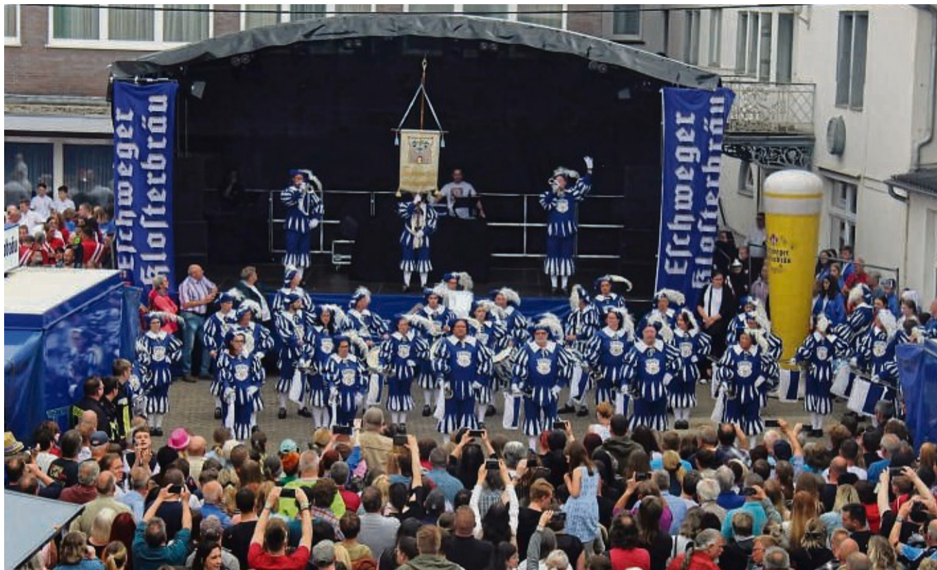
Brauereifest und Frühjahrskonzert: Gute Laune war hier vorprogrammiert.

Grill-Experten, frisch gezapftes Bier und live Musik in Eschwege