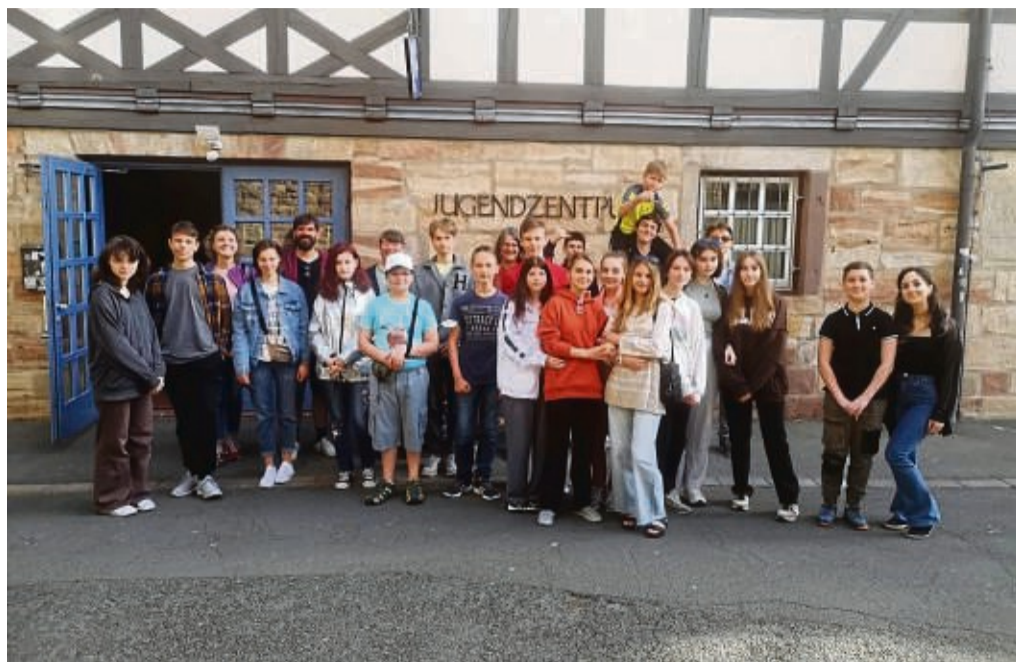
Das Jugendzentrum Schlossmühle lernten die 30 Schülerinnen und Schüler ebenfalls kennen: Hier erwarteten sie nach einem deutschen Frühstück zahlreiche gemeinsame Aktivitäten.

Dadurch wolle man die kulturelle Identität für die Schü-