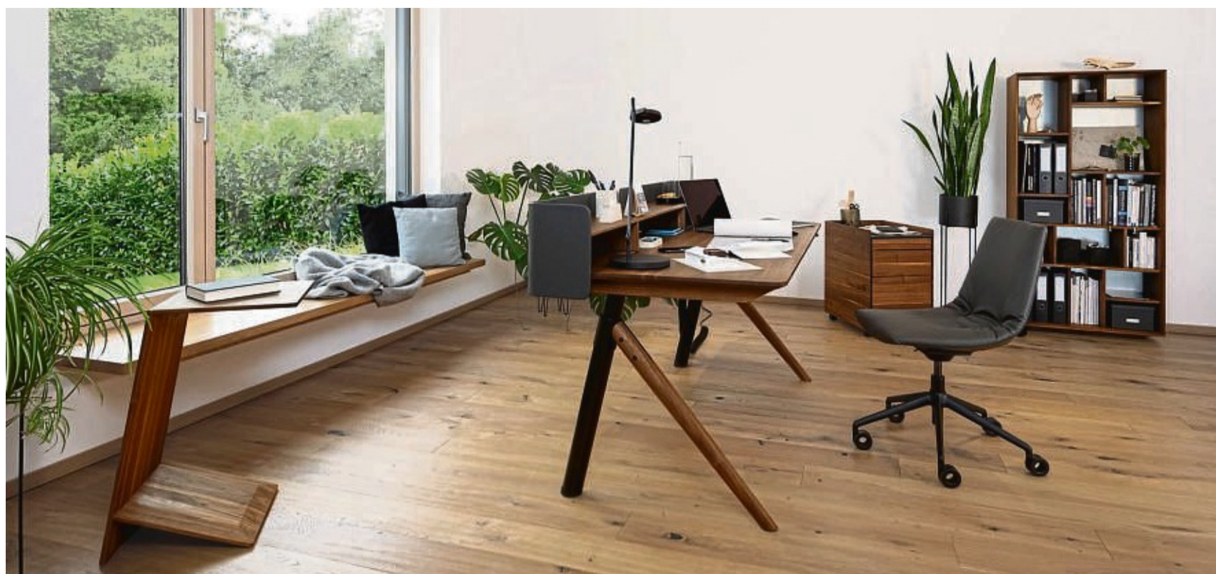
Die Bürostuhl-Variante der Stuhlfamilie lui von Jacob Strobel für Team 7 hat ein um 360 Grad drehbares Aluminium-Gestell.