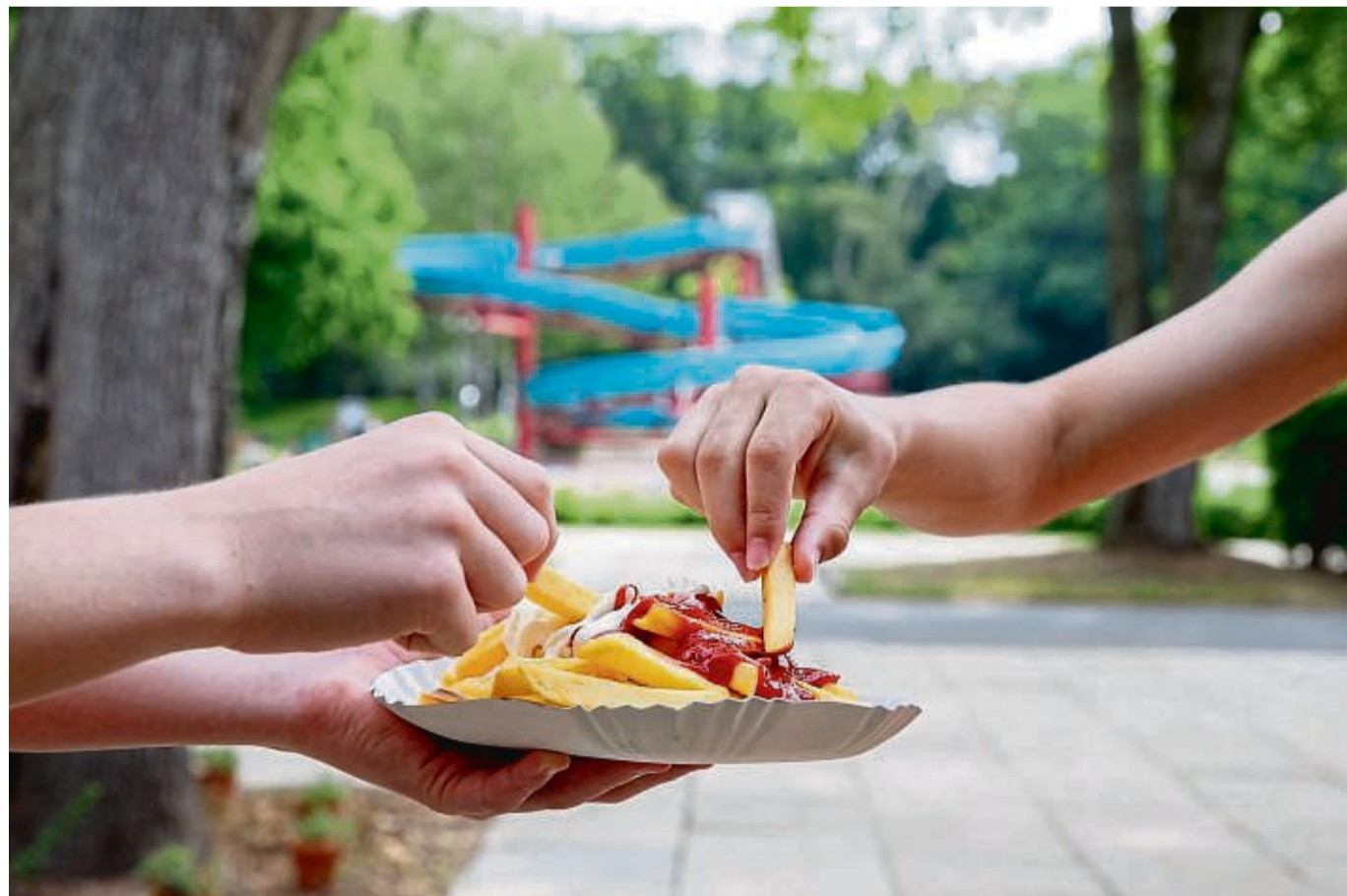
Heiße, fettige Freibad-Pommes wecken Erinnerungen an die Kindheit - eine Erklärung, warum sie so gut schmecken.