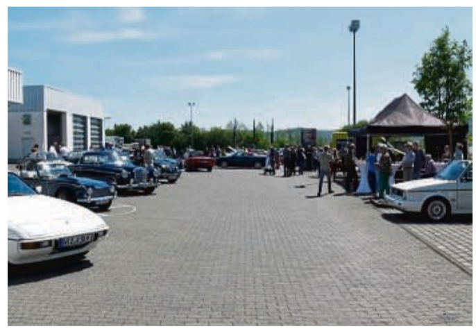
Am 28. Mai kommen Freunde von Young- und Oldtimern voll auf ihre Kosten.