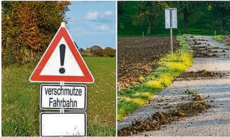
Verschmutzte Straßen durch landwirtschaftliche Maschinen oder forstwirtschaftliche Fahrzeuge

Um Beschwerden oder evtl. Unfälle im Zusammenhang mit der Verschmutzung zu vermeiden, gilt es: die Verschmutzung unverzüglich zu