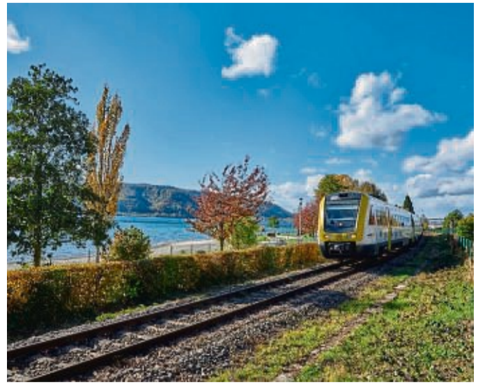
Das Bahn- und Busnetz am Bodensee macht eine autofreie Anreise und Fortbewegung in der Region möglich.

Entsprechende Formulierungen finden Urlauber in den Geschäftsbedingungen (AGB). Wer sicher gehen möchte, ob der Veranstalter die Preise anziehen darf, kommt also nicht drumherum, das Kleingedruckte zu lesen. Genauso beinhalten solche Klauseln auch, dass