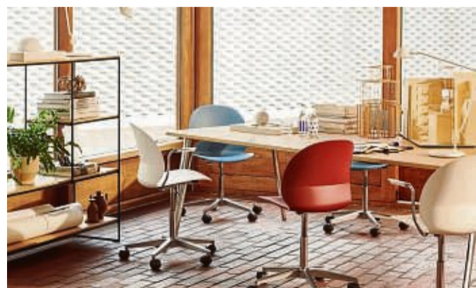
Auch in der Stuhlfamilie N02 Recycle von Oki Sato für Fritz Hansen finden sich rollbare Varianten fürs Büro.