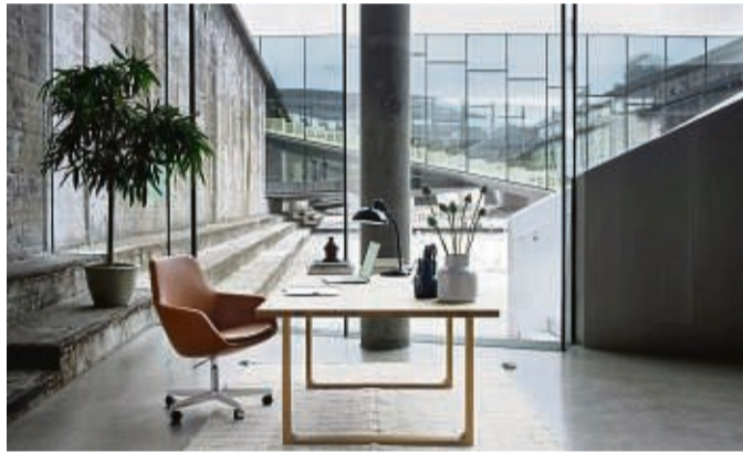
„The little Giraffe“, eine Weiterentwicklung des bekannten „Giraffen“-Stuhls von Arne Jacobsen für den Einrichter Fritz Hansen, gibt es auch in einer Variante mit Rollen an den Füßen.

Von der Notlösung zum Dauerzustand: Viele Arbeitnehmer können im Homeoffice bleiben. Das braucht einen besseren Arbeitsplatz als den Esstisch- oder Esstisch-Stühle in der Büro-Variante.