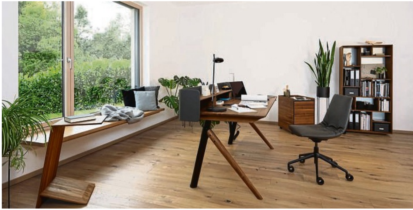
Die Bürostuhl-Variante der Stuhlfamilie lui von Jacob Strobel für Team 7 hat ein um 360 Grad drehbares Aluminium-Gestell.