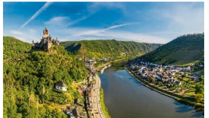
Mehr als 100 Meter über der Mosel thront der wuchtige Turm der Burg Cochem, umgeben von dicken Mauern, verziert mit Zinnen und Erkern.