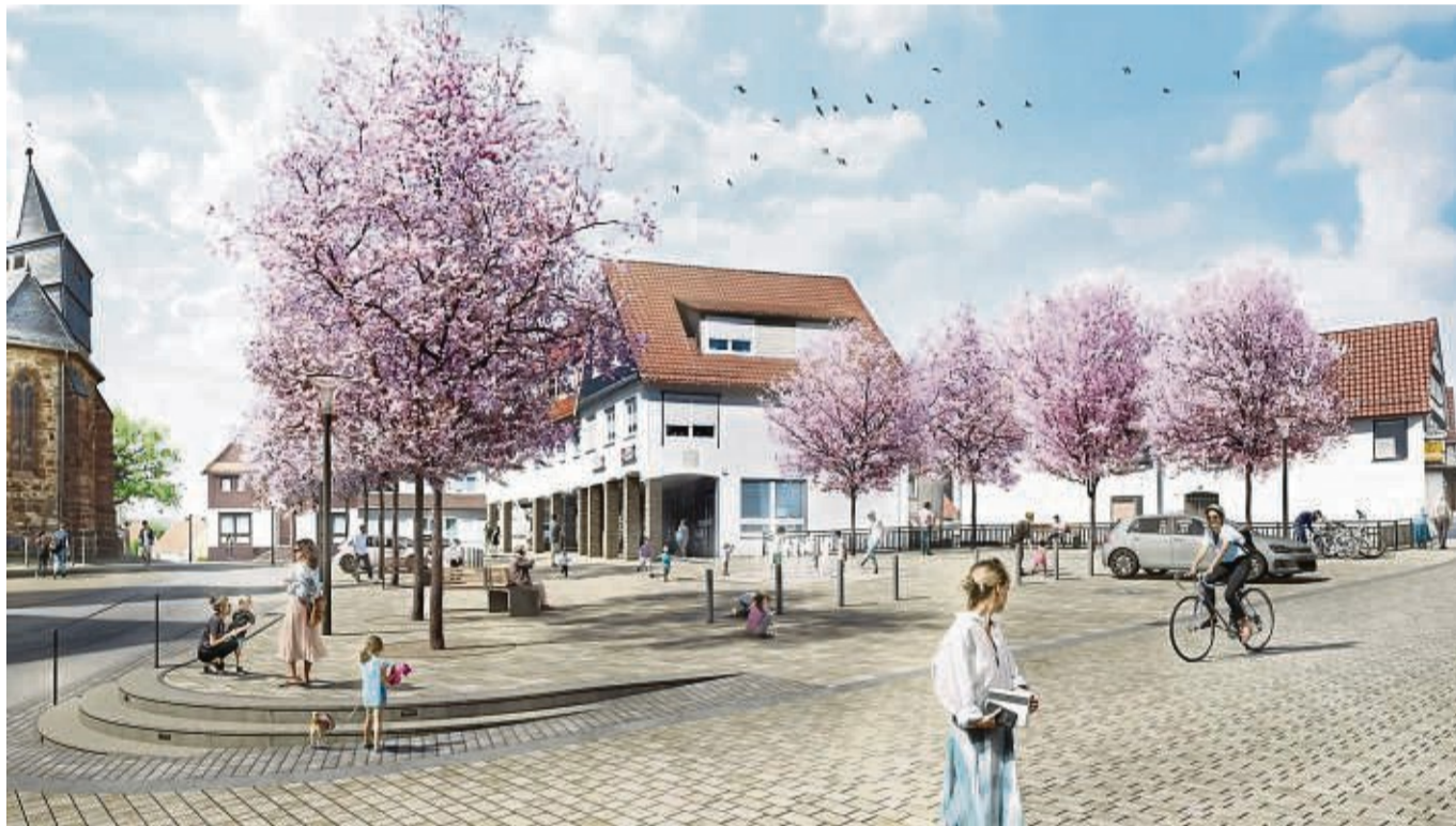
Mit Charme und Aufenthaltsqualität: So soll der Marktplatz in Waldeck nach Abschluss der geplanten Umgestaltung aussehen. ZEICHNUNG: STADT WALDECK/PR

Eine einheitliche Gehölzpflanzung mit Zierkirschen ist vorgesehen, die mit einer rosa Blüte im Frühjahr und einer rotorangen Herbstfärbung Akzente setzt. Die Waldecker können sich auf einen lebendigen Ortskern mit einer attraktiven Freiflächen-