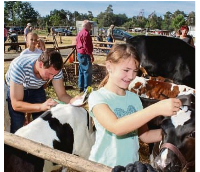
Kälber vorbereiten für den Auftritt im Ring: Nach zweijähriger pandemiebedingter Pause werden beim Viehmarkt am 23. Juli wieder Kälber, Pferde und Rinder aufgetrieben.