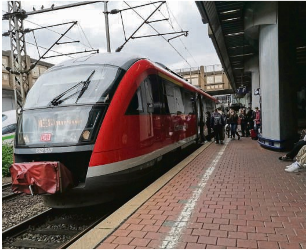
Die Einschränkungen durch die Bauarbeiten werden im Raum Kassel den Fern- und Nahverkehr betreffen. Unser Foto zeigt eine Regionalbahn (RB38) an Gleis 7 des Fernbahnhofs Kassel-Wilhelmshöhe.

Noch größer sind die Folgen für den Nahverkehr im Raum Kassel. Fahrgäste müssen sich auf immer neue Ausfälle von Zugverbindungen und Busersatzverkehre einstellen.