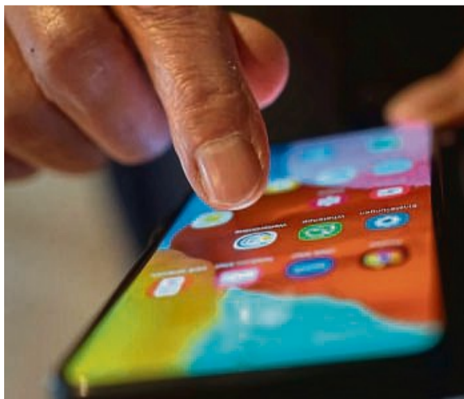
Regionale digitale Angebote können die Teilhabe und Gemeinschaft stärken.

Dazu gehört vor allem die Aufrechterhaltung der Nahversorgung mit Waren und Dienstleistungen des kurz- und mittelfristigen Bedarfs. „In vielen Dörfern und Kleinstädten ist der Wegfall von Bäcker, Metzger, Tante-Emma-Laden und der Dorf-kneipe gleichbedeutend mit