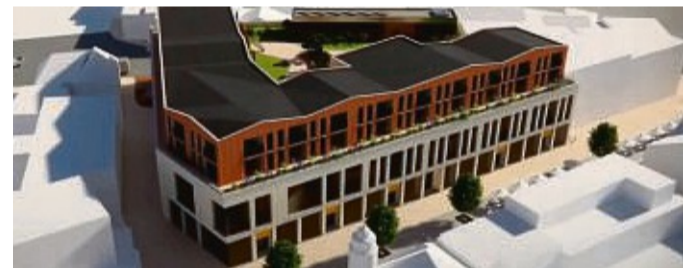
Geplant ist in der Bahnhofstraße ein viergeschossiges Geschäftshaus mit einer Tiefgarage und 31 Wohneinheiten.

Nach dem oberirdischen Abriss des alten Woolworth-Gebäudes war es zunächst ruhig auf der Baustelle in der Bahnhofstraße geworden. Zunächst mussten technische und baurechtliche Fragen geklärt wer-