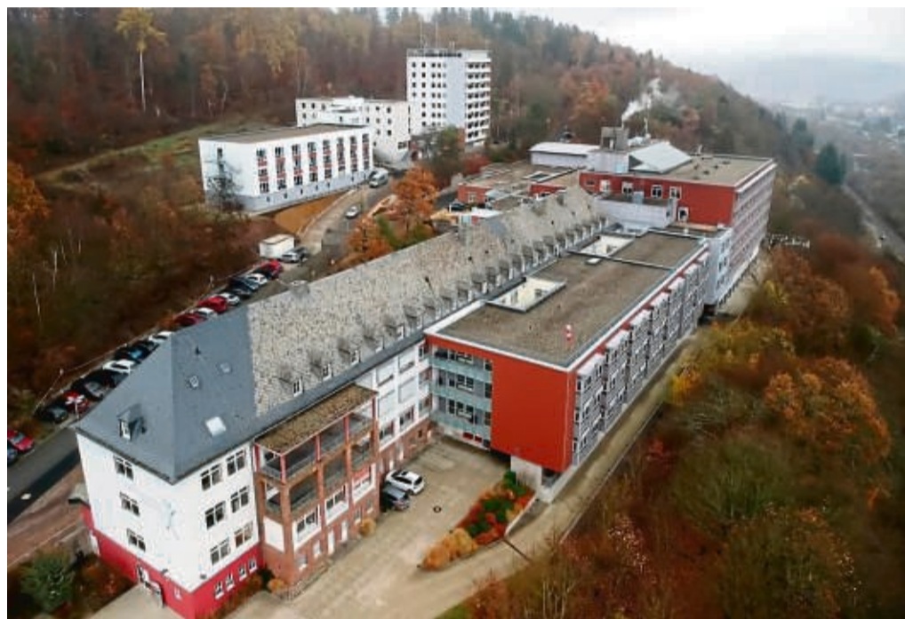
Das Kreiskrankenhaus in Frankenberg soll mithilfe einer Machbarkeitsstudie neu aufgestellt werden. Dabei kommt als Option ausdrücklich auch ein Neubau in Frage.

nen, ist aber nicht der Auftrag des Krankenhauses.“ Aktuell seien im Kreiskrankenhaus 1,1 Millionen Euro als Zuschuss für das Kreiskrankenhaus eingeplant. „Aufgrund der wirklich guten Geschäftsführung sind wir auf Kurs“, sagt der Landrat. „Das Defizit werden wir aber auch nicht kurzfristig aufheben können, dafür brauchen wir eine komplett andere Lösung, die ganz neu gedacht werden muss. Dafür brauchen wir den großen Plan.“ (...) „Wir haben einen Konsens im Kreisausschuss. Alle Fraktionen gehen diesen Weg mit, das grundsätzlich zu betrachten. Das gibt natürlich Rückendeckung.“ jpa