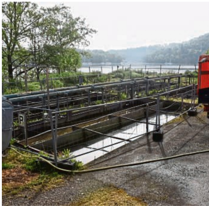
Tage sind gezählt: Die Kläranlage aus den 1960er-Jahren macht Platz für einen Neubau.

Nach Recherchen von Boos wurden im Jahr 2021 von diesem Typ nur 16 Anlagen in