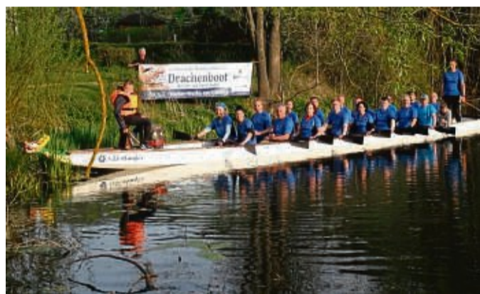
Die 4. Nordhessischen Meisterschaften im Drachenboot werden auf dem Vorstau Becken in Nieder-Werbe ausgetragen.

16 Freizeit-, Firmen- und Vereinsmannschaften haben sich für die Rennen mit 20er und 10er Booten angemeldet. Die weiteste Anreise haben der Titelverteidiger „Hellas Drachen“ aus Gießen sowie die „Weserpiraten“ aus Beverungen. Für das leibliche