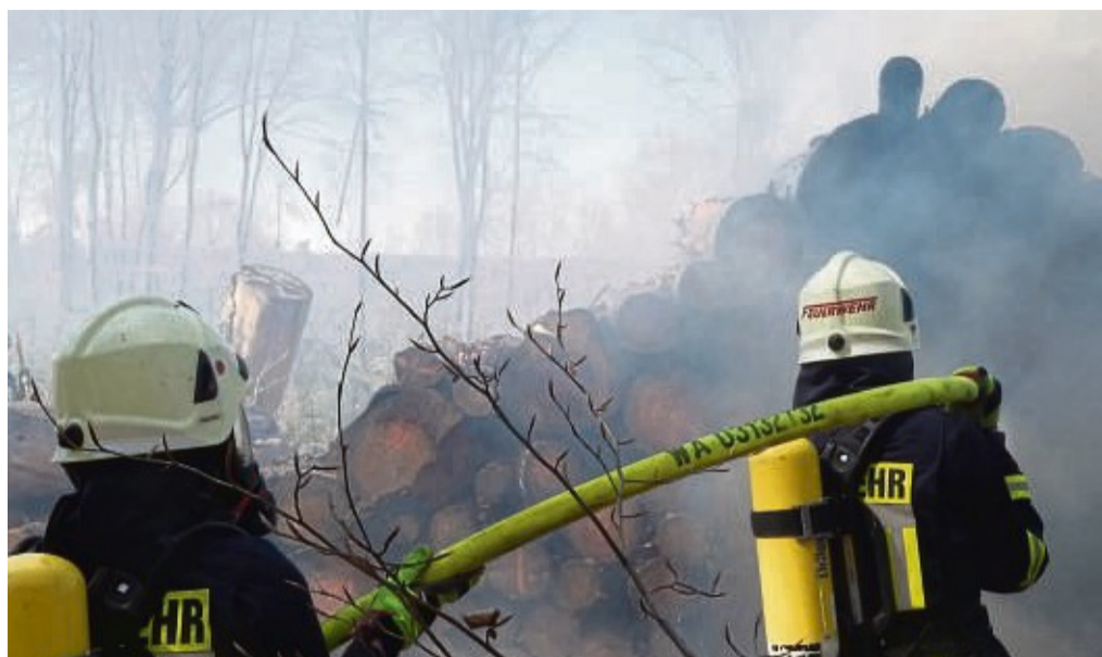
Die Brandstifter zünden vorwiegend Holzpolter an. Hier ein Löschgriff unter Atemschutz beim Waldbrand am Schiebenseid bei Sachsenhausen.

Ein Großteil der Brände wurde rechtzeitig entdeckt und von den alarmierten Feuerwehren schnell gelöscht. In mindestens zwei Fällen gab es auch Flächenbrände, wo-