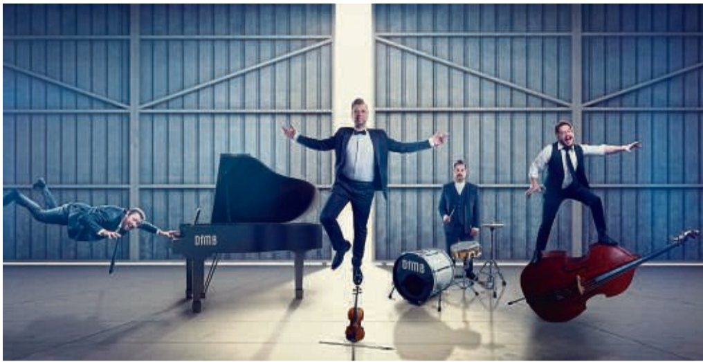
Die „Fabelhaften Monday Boys“ treten beim Tag der offenen Gärten im Garten der alten Mühle Dalwigksthäl auf.

„Die fabelhaften Monday Boys“ sind am 19. Juni zu Gast