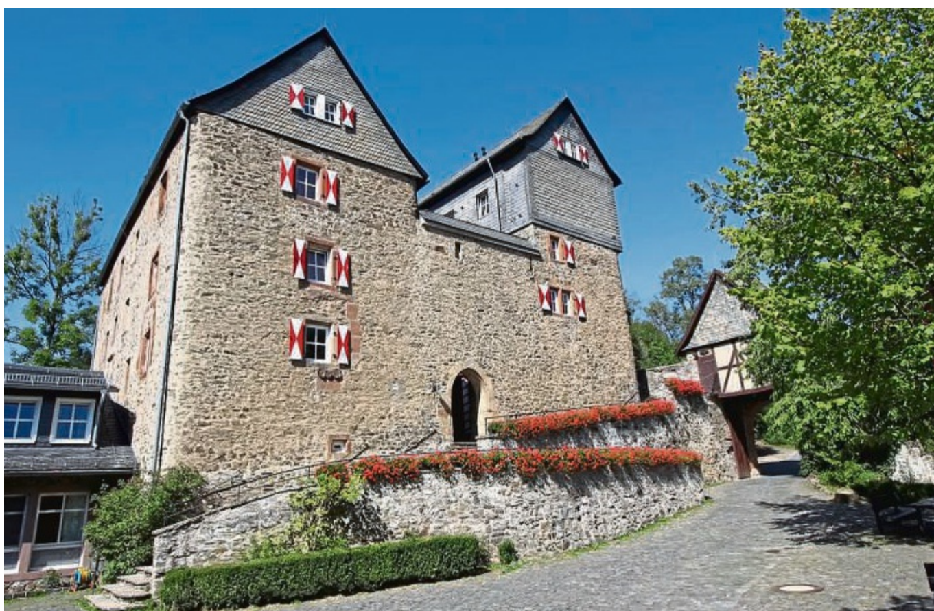
Zum Jubiläum auf die Burg: Mit einem Unterhaltungsprogramm und vielen Informationen wird der 100. Geburtstag der Jugendherberge gefeiert.

Um 12 Uhr beginnt das Fest mit Grußworten. Ein Markt der Möglichkeiten mit Kinderprogramm von 12.30 bis 17.30 Uhr bietet vielfältige Angebote von Burgführungen hinter die Kulissen der Herberge über Werkarbeiten für Kinder mit dem 3D-Drucker bis hin zu Bogenschießen im Steinbruch. Leckeres Essen und erfrischende Ge-