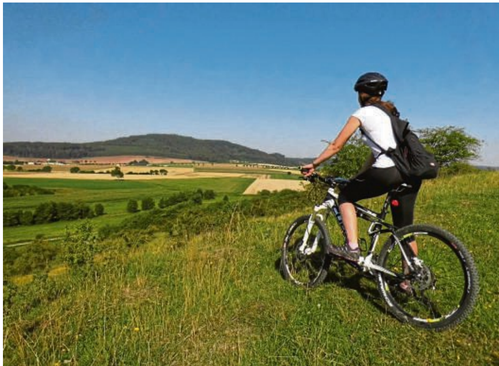
Menschen in Bewegung bringen: Dazu bietet die Kirch-Tour des Kirchenkreises eine gute Gelegenheit.

Seit Anfang des Jahres wird nun in den einzelnen Kooperationsräumen des Kirchenkreises getüftelt, welche Wegstrecken die besten sind, welche Kirchen am 12. Juni geöffnet werden können? Herausgekommen ist ein abwechslungsreiches Programm, mit vielfältigen Ver-