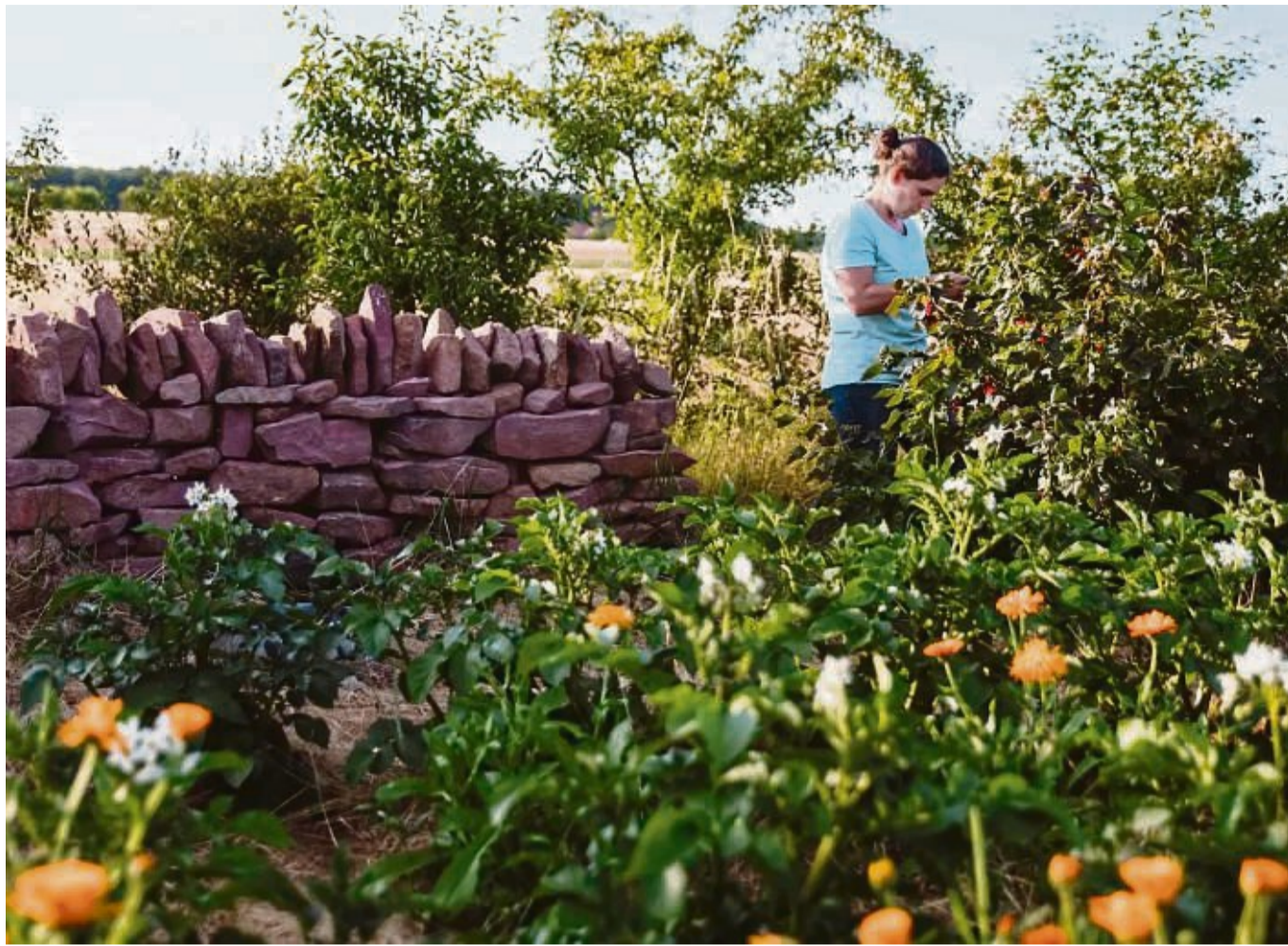
Üppig grün und voller spannender Ecken: Permakultur hat viel zu bieten.