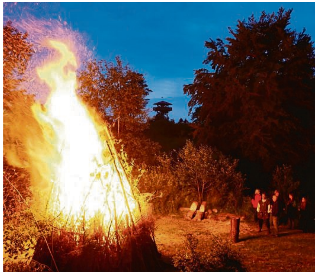
Zur Sommersonnenwende wird auf der Schwalenburg ein mittelalterliches Mittsommernachtsfeuer entfacht.

niges über die Mythen, Sagen und Legenden der Schwalenburg zu erfahren. red