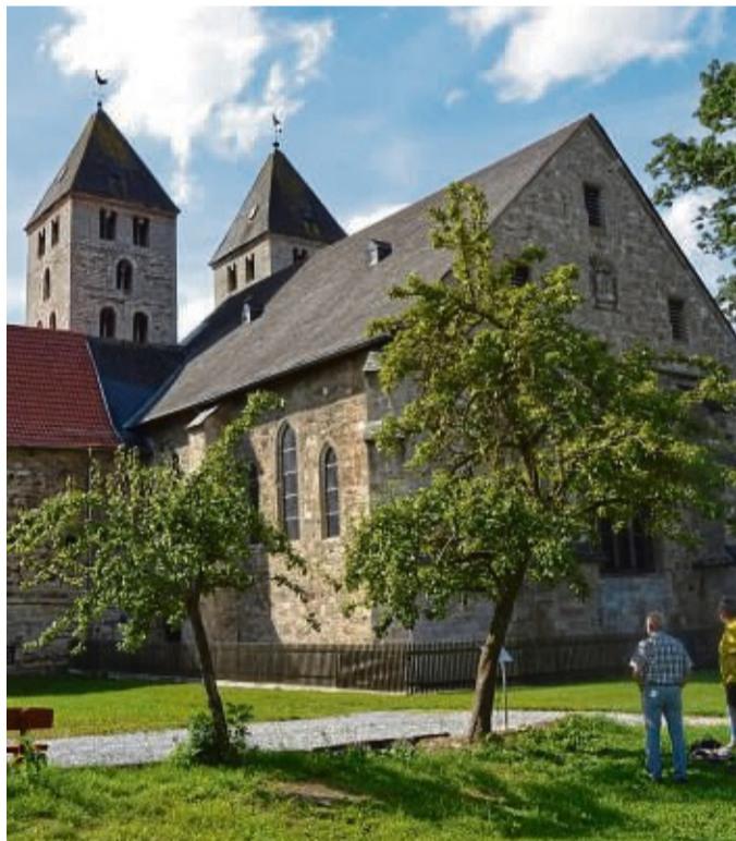
Im Kloster Flechtendorf findet an 12. Juni eine Führung statt. Das Café ist geöffnet.