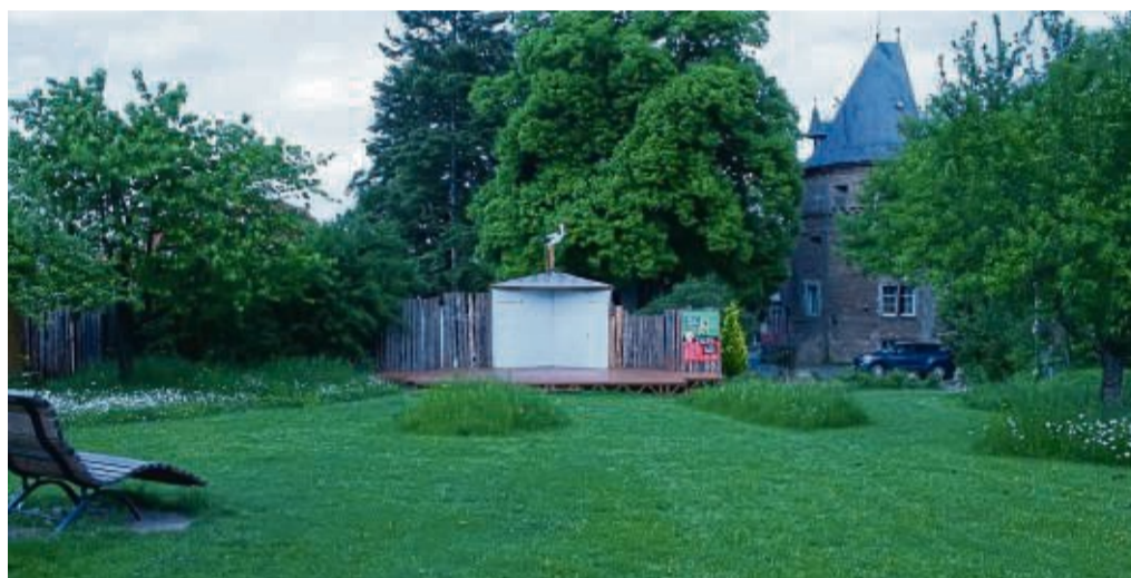
Da die Bühne im Schießhagen umgebaut wird, zeigt die Freilichtbühne das Stück „Hans im Glück“ auf einer Bühne hinter dem Wollweber-turm.

Das Stück für die ganze Familie verbindet das klassische Märchen und ein modern-frechtes Märchen-Thea-