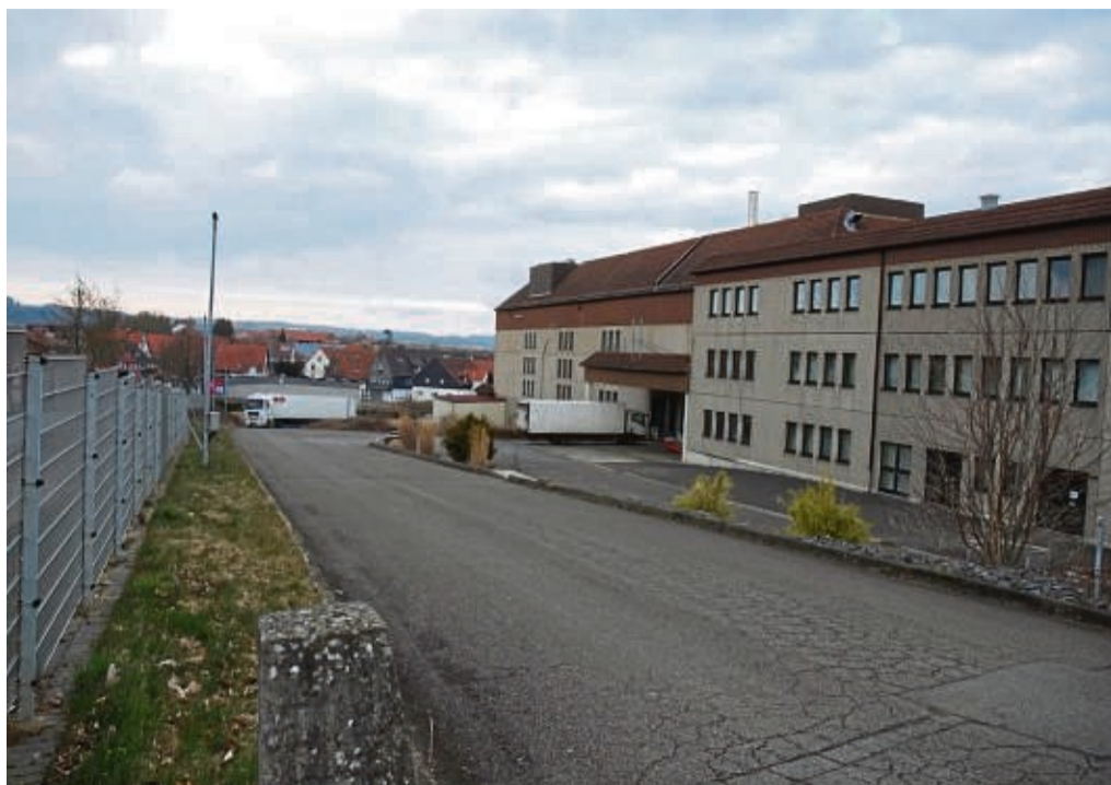
Für den Abriss der ehemaligen Wurstfabrik Wilke in Berndorf und die Entsorgung veranschlagt die Firma HPC in Fulda Kosten von rund fünf Millionen Euro. Der Aufwand für die Beseitigung von Phenol und Asbest erschwert die Arbeiten.

Was den Abbruch erschwert, ist die Verwendung von Asbest für die Stahlbeton-Konstruktion des Hauptgebäudes. Zudem enthalten die mit Kunstharz versiegelten Böden Phenole. Das müsse mit hohem Arbeitsaufwand abgeschliffen und beseitigt werden. Die Mengen