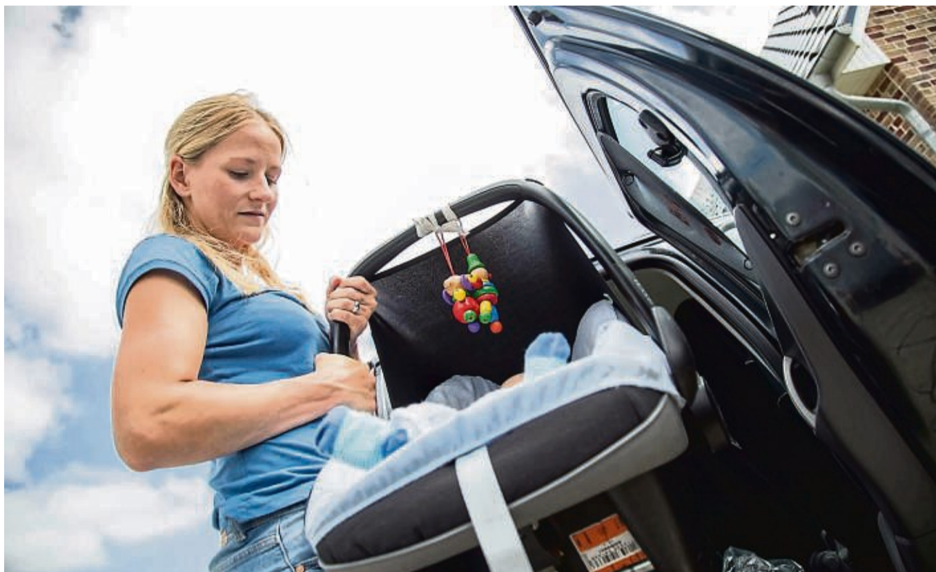
Die Auswahl an guten Babyschalen ist für Eltern groß. Mit nur wenigen Klicks sind die Kleinsten gut gesichert.

Grundsätzlich müssen alle zugelassenen Sitze eine sogenannte UN-ECE-Norm erfüllen, ein internationaler Standard für Kinderautositze. Drei Normen sind derzeit laut ADAC zugelassen: i-Size / UN ECE Reg. 129, UN ECE Reg. 44/04 und UN ECE Reg. 44/03. Nicht zugelassen sind ältere Sitze mit der Norm ECE-R 44/01 und 44/02. Alle zugelassenen Modelle erfüllen also Mindestanforderungen - Luft nach oben und unten gibt es aber trotzdem.