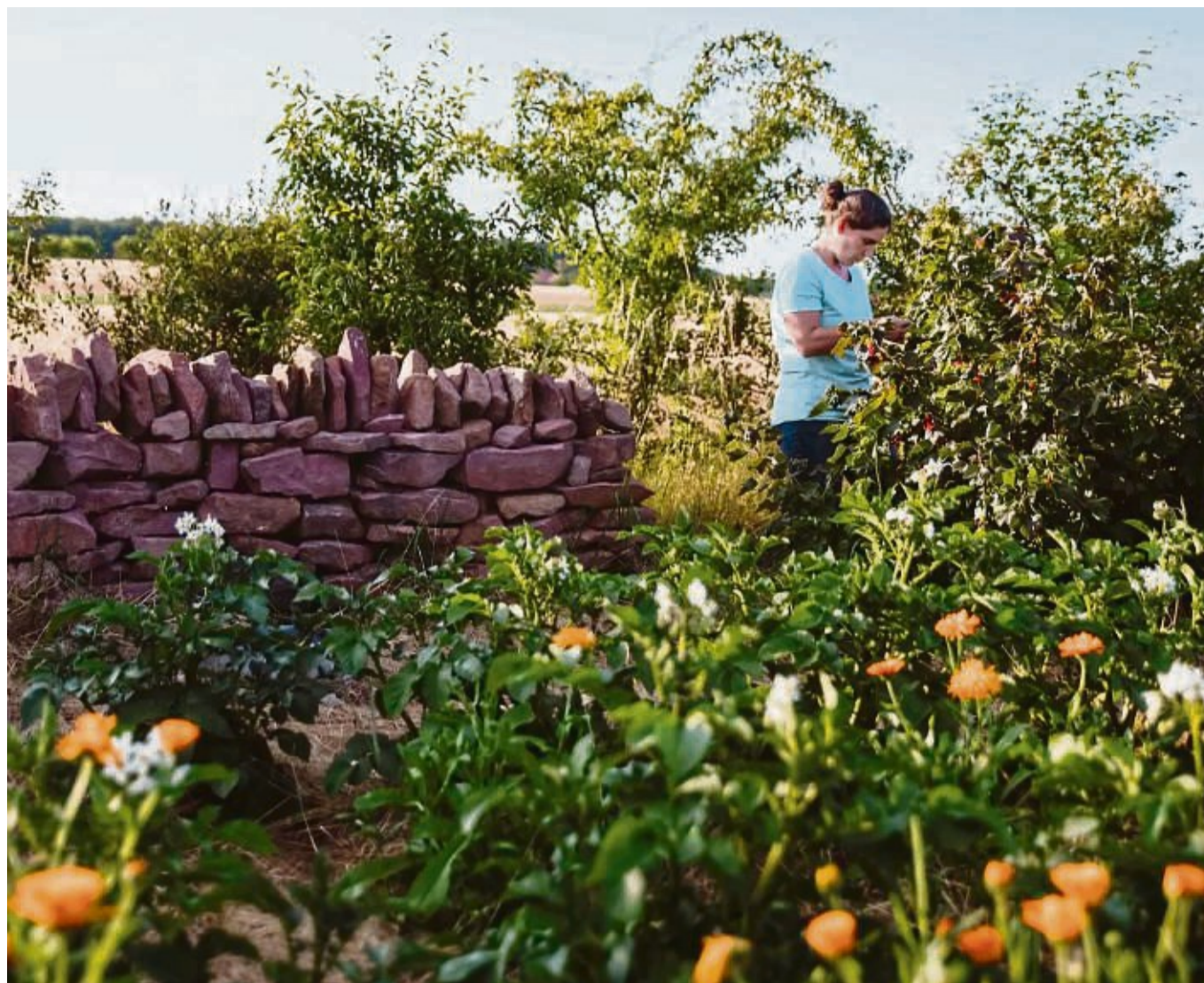
Üppig grün und voller spannender Ecken: Permakultur hat viel zu bieten.

Im zweiten Schritt gilt es, die geografischen Besonderheiten anzuschauen: Lage, Boden, Licht- und Windverhältnisse und vorhandene Ressourcen wie Pflanzen, Gebäude und Wasser. Auf diese Weise entsteht ein Garten, der zum Standort und den Bedürfnissen der Bewohner passt. Meist kommt dabei üb-