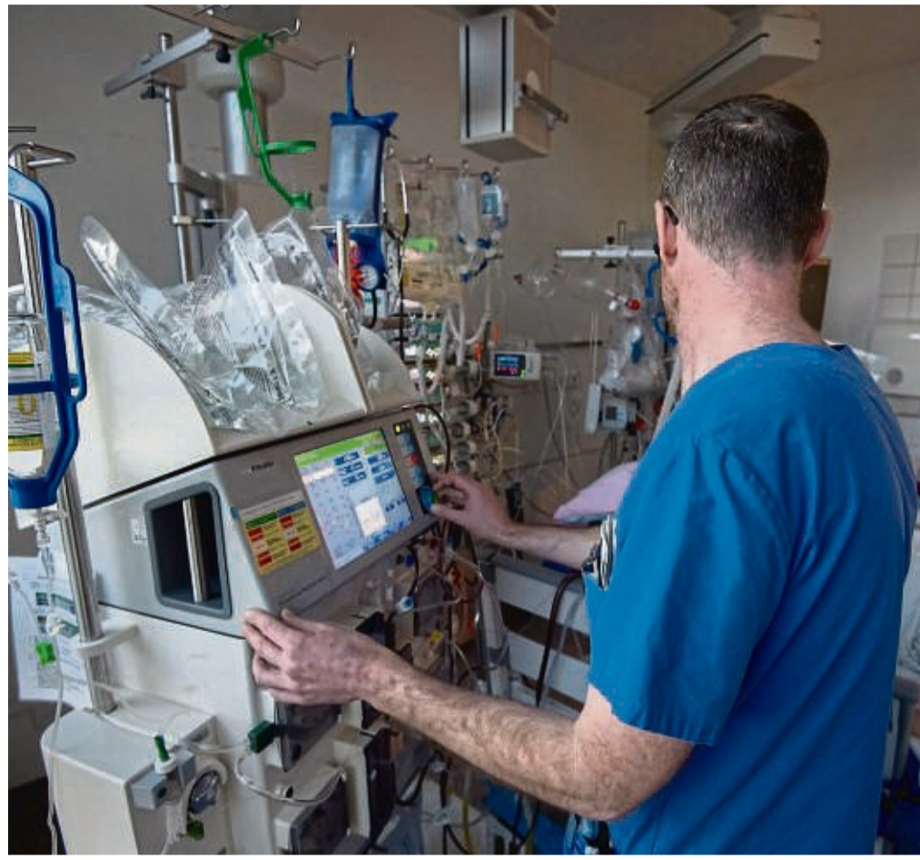
Wenn die Nieren nicht mehr in der Lage sind, das Blut zu filtern, muss ein Dialysegerät diese Aufgabe übernehmen.