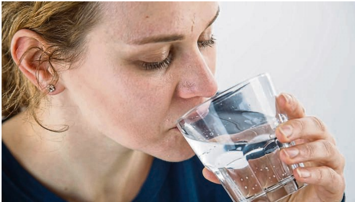
Wer beim Essen trinkt, greift am besten zu Wasser. Denn das verfälscht den Geschmack der Mahlzeit nicht – anders als Wein, Limo oder Cola.