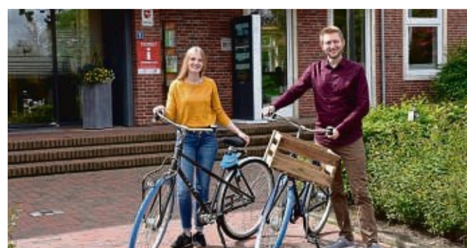
Bewegung, etwa auf zwei Rädern, tut nicht nur dem Körper, sondern auch der Seele gut.

Aktivurlaub tut Körper und Seele gut. Einsteiger sollten sich am Anfang nicht zu viel vornehmen. Wie geschaffen für die Entdeckung der Freude an der Bewegung ist die Parklandschaft des Ammerlandes im Nordwesten Niedersachsens. Im Herzen der Urlaubsregion liegt die Gemeinde Wiefelstede. Dank der geringen Steigung lässt sich die Gegend gut auf zwei Rädern erkunden. Allein sieben Themenrouten verlaufen