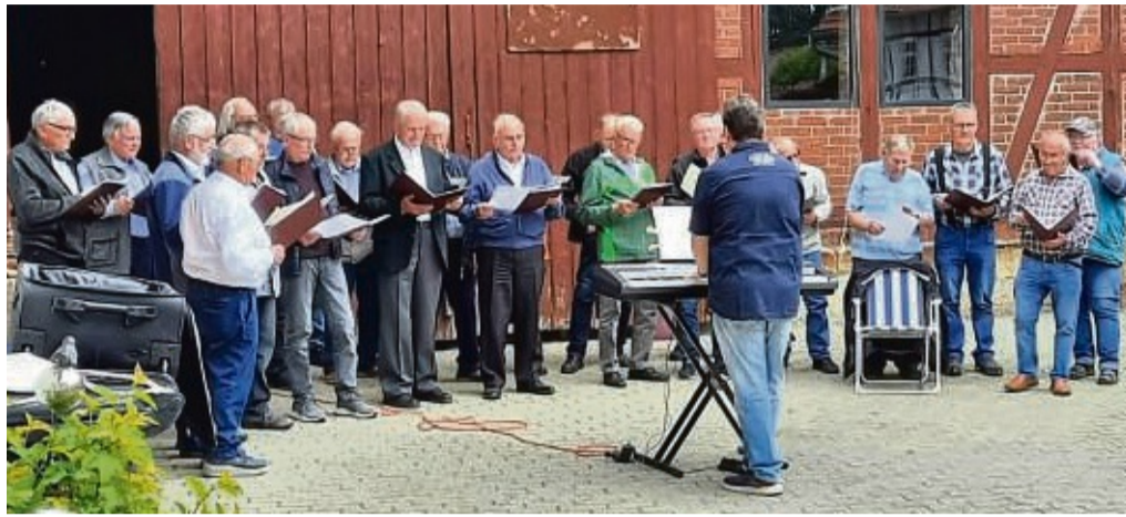
Zusammen unterwegs: Der MGV Ulfen hat bei seinem Ausflug an Christi Himmelfahrt ein Ständchen gespielt.