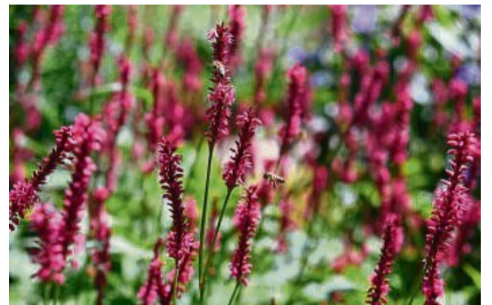
Der Kerzen-Knöterich bevorzugt feuchten und lehmigen Boden.