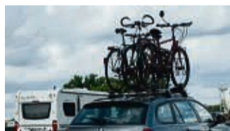
Wer Fahrräder transportiert, muss sich auf ein anderes Fahrverhalten einstellen.

Werden Fahrräder transportiert, fahren sich Autos anders als gewohnt: Durch das höhere Gewicht leidet nicht nur die Beschleunigung, auch Bremswege verlängern sich. Darauf weist die Sachverständigenorganisation Dekra hin. Je nach Trägersystem kommt es zu weiteren Störfaktoren: Reisen Räder auf dem Dach mit, verschiebt sich der Schwerpunkt nach oben - die Folgen: In Kurven neigt sich das Auto stärker, und es ist anfälliger für Seitenwind. Bei Hecksystemen dagegen kann sich das Lenk-