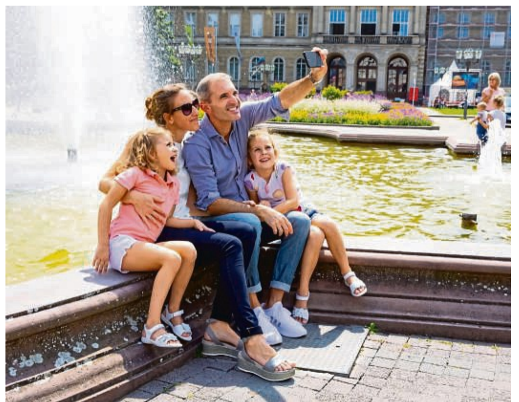
Familien können sich in der Fächerstadt auf vielfältige Erlebnisse freuen.

Mit ihrem breiten Kulturangebot für Familien sowie den weitläufigen Grünflächen und Naturräumen ist die badische Metropole eine Stadt der perfekten Gegensätze. Ob spannende Naturentdeckungen im Naturkundemuseum, ein Malworkshop für die Kleinen in der Städtischen Galerie, eine gemeinsame Rätsel-Rallye durch die Innenstadt, ein Ausflug zu Eseln, Gämsen und Pferden im Tierpark Oberwald, eine Radtour entlang des Rheins oder Wasserspaß im Rheinstrandbad Rappenwört: In der badischen Fächerstadt können Familien jeden Tag etwas anderes unternehmen. Tipps für die Urlaubsgestaltung gibt es unter www.karlsruhe-erleben.de/familien .