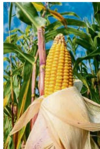
Hat gute Prognosen: Mais.

mit Mikrogranulat, Mykorrhiza und N-fixierenden Bakterien durch. Bei Fragen oder Anregungen sowie Untersuchungsaufträge rufen Sie uns an. www.aglw.de