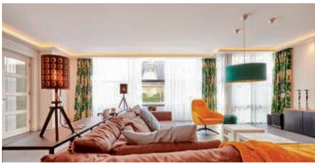
Mit Licht dein Wohnzimmer verzaubern.

Plameco bietet dir dazu flexible Zimmerdecken in vielen verschiedenen Farben und Designs. Ob matt, hochglänzend, mit Zierprofilen, oder LED-Beleuchtung: Die Decken sind so vielseitig, dass du sie harmonisch jedem Wohnstil anpassen kannst. Wohn-, Schlaf- und Esszimmer sowie Küche, Flur und Bad erhalten damit schnell ein neues Gesicht. Montiert werden sie einfach unterhalb der vorhandenen Decke. Kein ausräumen nötig, lediglich die Möbel werden ab-